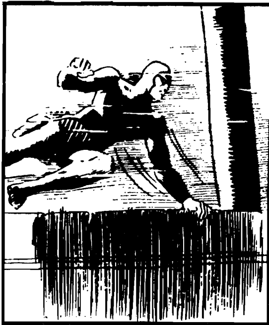
Bijeg iz banalne svakidašnjice: strip u potrazi za egzotičnim pejzažima i pustolovinama ( Džim iz džungle i Fantom ).