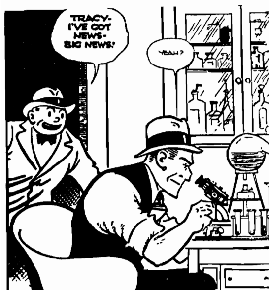
Sugestivnost crteža: oble linije (lijeva figura) i izlomljene linije (desna figura) kao pokazatelji različitih karakternih svojstava junaka Dika Trejsija Čestera Golda.