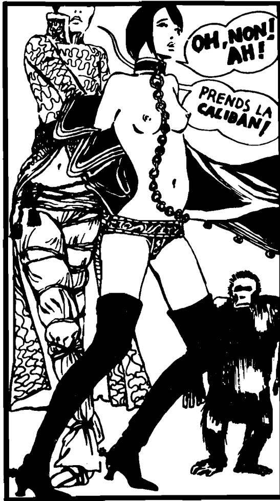
Erotska komponenta modernog stripa: Valentina (1972).