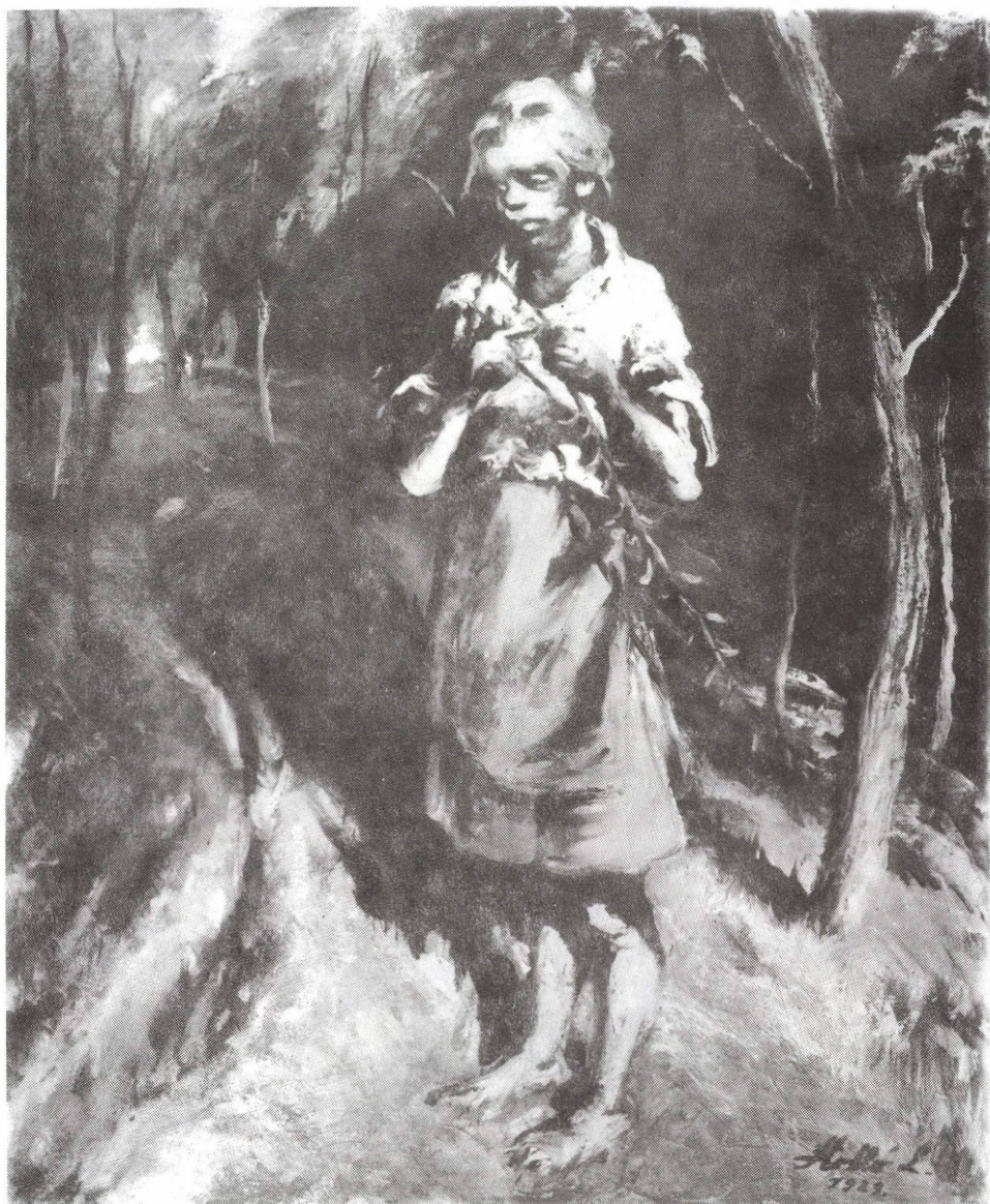
Holló László: Vesszőhántó lányka (1929)