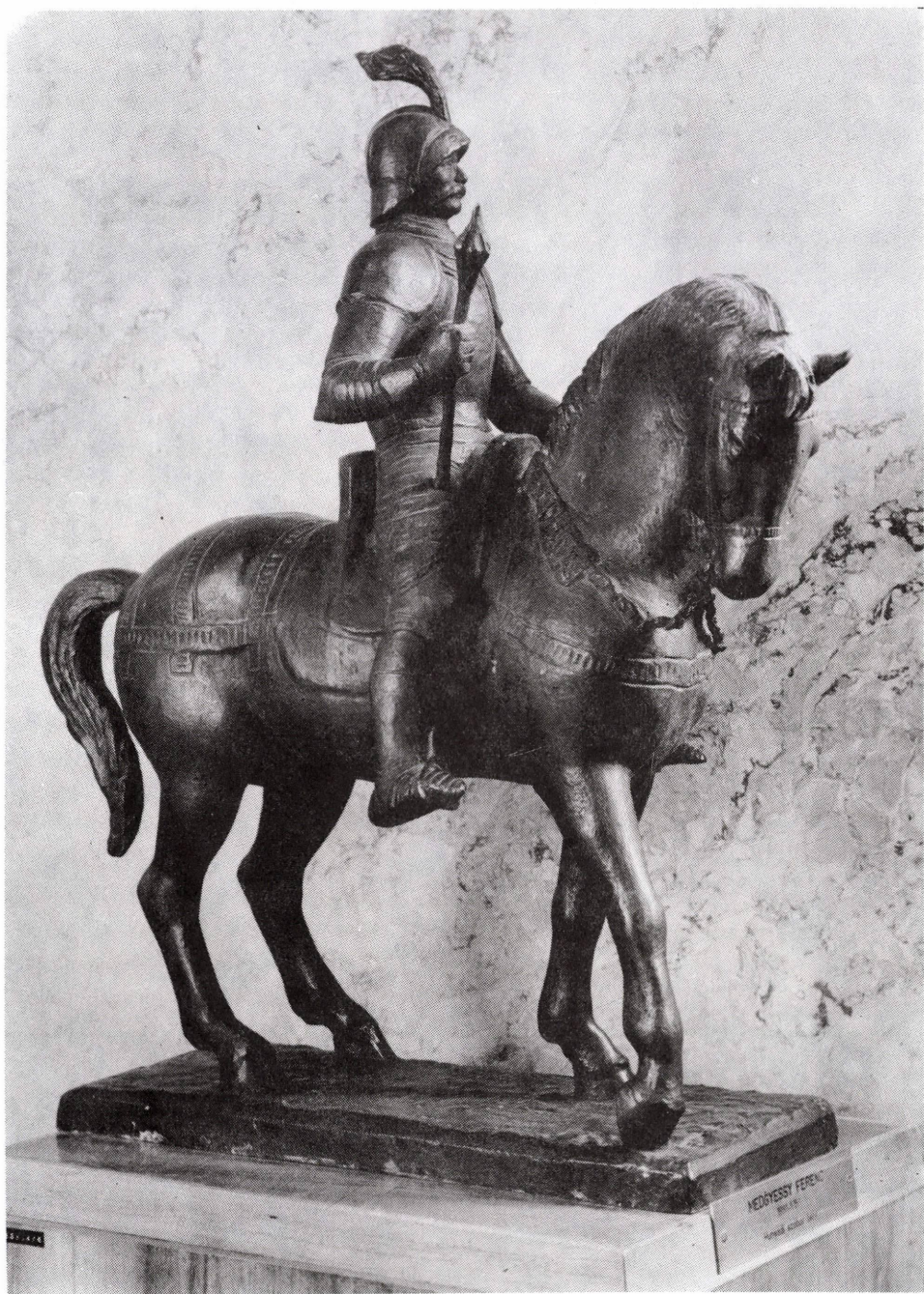
Medgyessy Ferenc: Hunyadi János (1951)