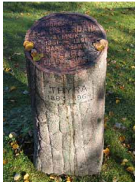
Familjegravvård med det symboliska motivet det avbrutna livsträdet. Från 1921, i kv E.