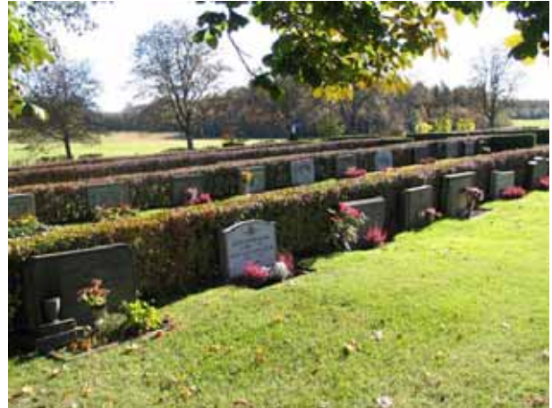
Inne i kv N, från N-V.