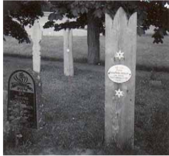
Trästavar i olika former med emaljskyltar.

Mer konkreta och detaljerade uppgifter om kyrkogårdens utseende i äldre tider får man först genom gamla fotografier. De tidigaste fotografierna är från 1906 och visar en i stora stycken annorlunda kyrkogård jämfört med dagens. På marken växer högt ängsgräs mellan gravkullar med företrädesvis trävårdar men även en och annan av gjutjärn. Av trävårdarna finns de som har formen av resta brädor, sk stavar, men även sådana som imiterar gjutjärnskors med trepassformer i ändarna. Många av de äldre vårdarna står trärena sedan färgen försvunnit men de nyare är målade i vitt. På kyrkogårdens södra sida står trävårdar både öster och väster om den sneda gången fram till sydporten. Runt Nordenfalks familjegrav öster om korväggen finns cypresser planterade, men de är ännu inte tuktade. Några årtionden längre in på 1900-talet har, på södra sidan om kyrkan, trävårdarna på den ostliga delen om gången börjat ersättas av höga stenvårdar.