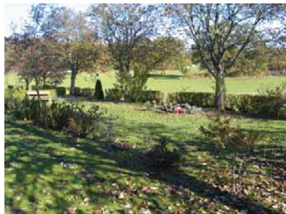
Minneslund från sydväst.