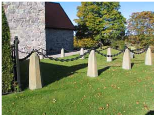
Kvarter AB, Nordenfalks familjegravplats.