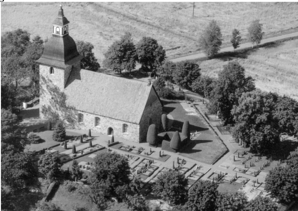
Flygbild från 1950.

Lika länge som det har funnits en kyrka på platsen lika länge har det förmodligen även funnits en kyrkogård. Gravarna har sannolikt som var brukligt funnits söder om kyrkan. Detta är ett drag som kyrkogården i stort sett behållit fram till idag. Endast få gravar finns på den norra sidan.