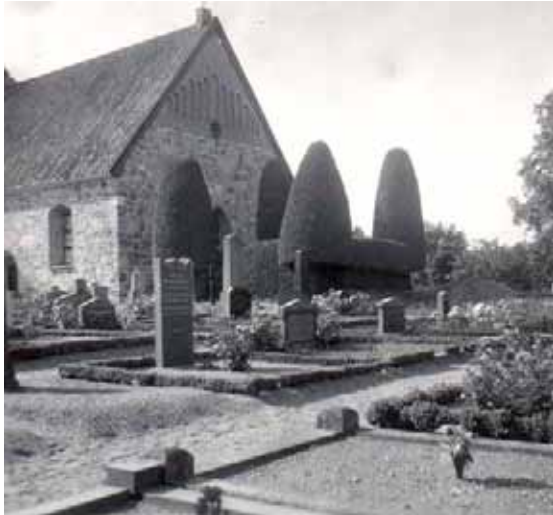
Sydöstra delen , från om ca 1940-talet.