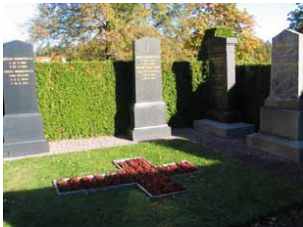
Kvarter AB, Nordenfalks familjegravplats.