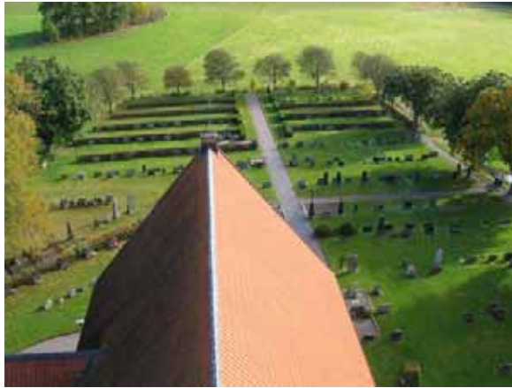
Kyrkogården mot öster sedd från tornet.