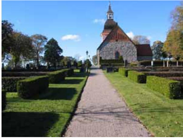
Kvarter M till vänster och N till höger.