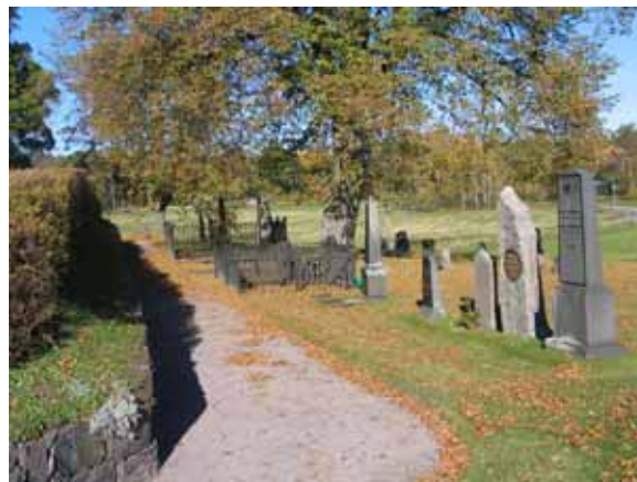
Kvarter B från söder.