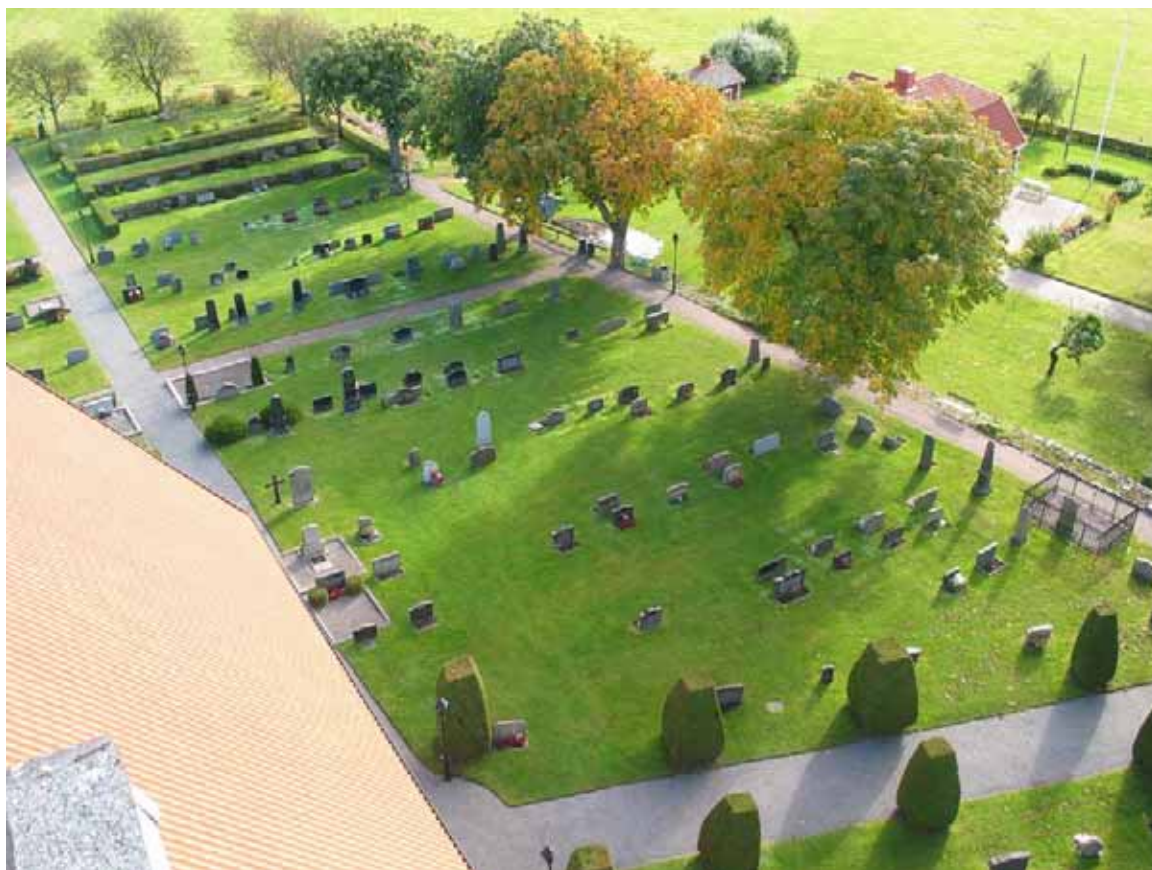
Kvarter F-L sedda från kyrkotornet.