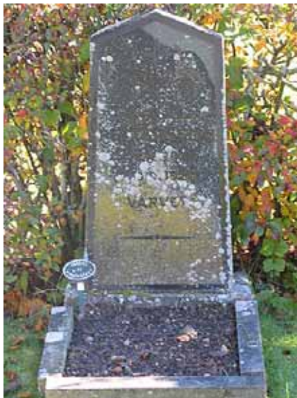
Trolig linjegravvård i kvarter D.

Kvarter D liknar i sin struktur de kvarter som anlades 1959, M och N. Det är därför troligt att området lades om ungefär vid den tiden. Förekomsten av äldre vårdar skvallrar dock om att kvarteret har en historia som är äldre än så. De små gravvårdarna av svart granit härrör av allt att döma från när kvarteret hyste linjegravar. De större köpegravarna utmed mittgången hör också till samma epok. Det är viktigt att de äldre vårdarna även i framtiden får stå kvar i kvarteret för att detta historiska lager inte ska falla i glömska. För kvarter