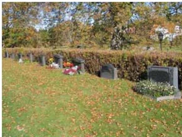
Kvarter A från söder.