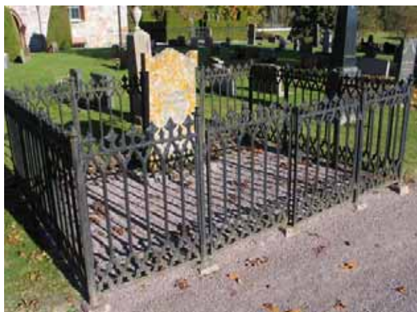
Gjutjärnsstaket i kvarter G.