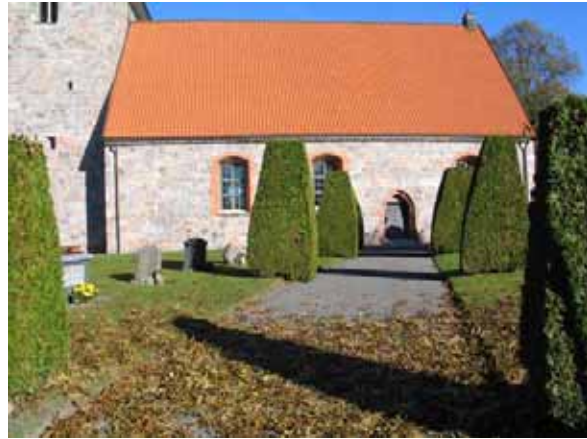
Gången med formklippta tujor fram till sydportalen.