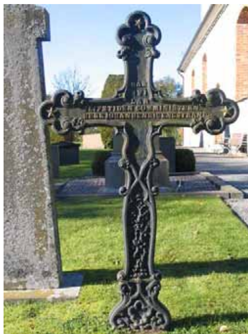
Gjutjärnskors i kvarter G.