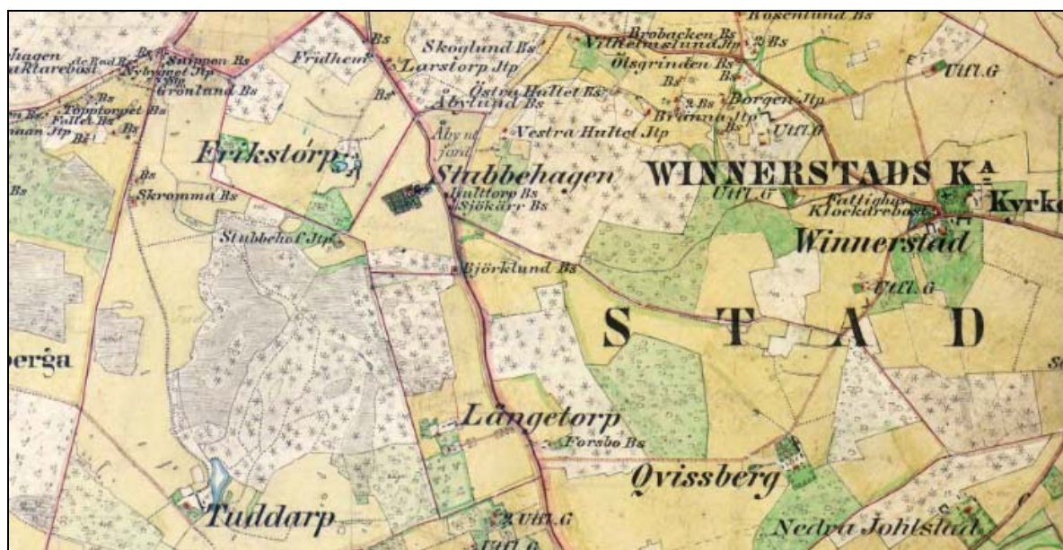
Utsnitt ur häradsekonomska karta 1868-1877, Hagebyhöga

idag av Motala kommun och används för bl a utställningsverksamhet. År 1948 inkorporerades socknen i Motala och bostadsbebyggelse dominerar numer socknens västra delar.