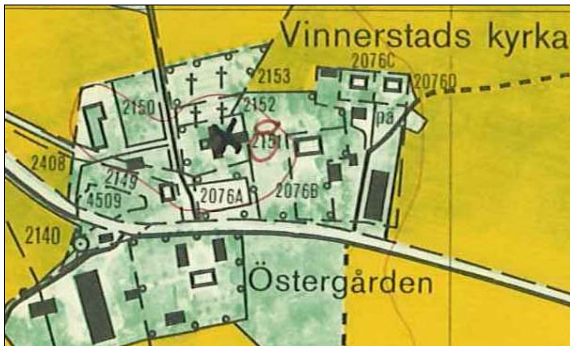
Utsnitt ur ekonomiska kartans blad, 085 71 Vinnerstad, 1983.