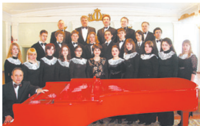
Камерный хор училища

– Набор формируется на все отделения равномерно – в соответствии с контрольными цифрами, утвержденными нашим департаментом. Большую работу ведут члены приемной комиссии. Преподаватели училища наблюдают за детьми с момента их поступления в ДШИ и ДМШ, проводят открытые уроки, беседуют с родителями. В конце каждого учебного года пополняется база данных перспективных детей. В музыкальных школах работают выпускники училища, которые способствуют приходу ребят в нашу профессию.