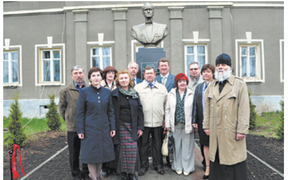
На открытии памятника К. Игумнову