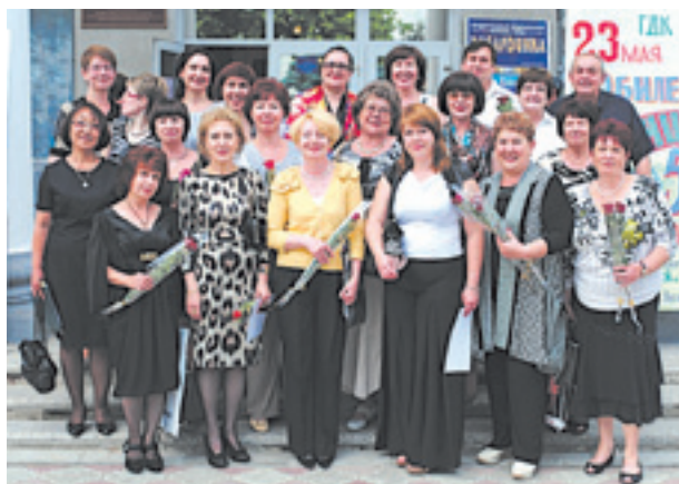
После юбилейного концерта

искусств им. А.С. Пушкина, в школе проводится цикл концертов «Декабрьские вечера». Учащиеся школы принимают участие в городских праздниках – дне города, фестивале дружбы народов, празднике «Широкая