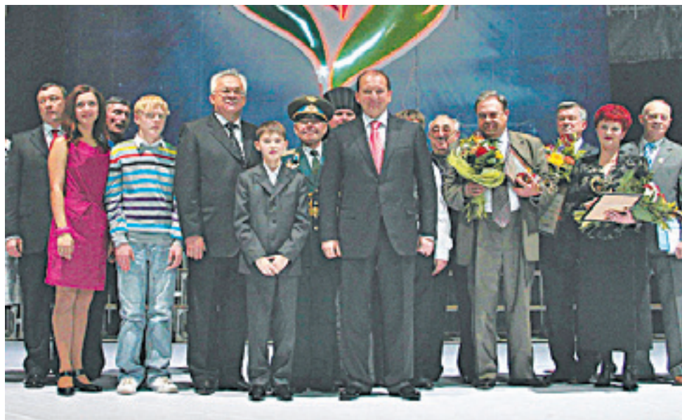
Вручение наград Областной общественной акции «Народное признание»

которых вначале было много трудностей, благодаря своему трудолюбию и системе работы преподавателя достигают великолепных результатов, становятся лауреатами и нашей гордостью. За этот год мы приняли участие в 21 конкурсе, и только за апрель дети получили больше 30 дипломов. А для нас это очень важно, ведь наш город небольшой – всего 29000 жителей. И благодаря нашим звездочкам город знакомится с классической музыкой и классическим балетом.