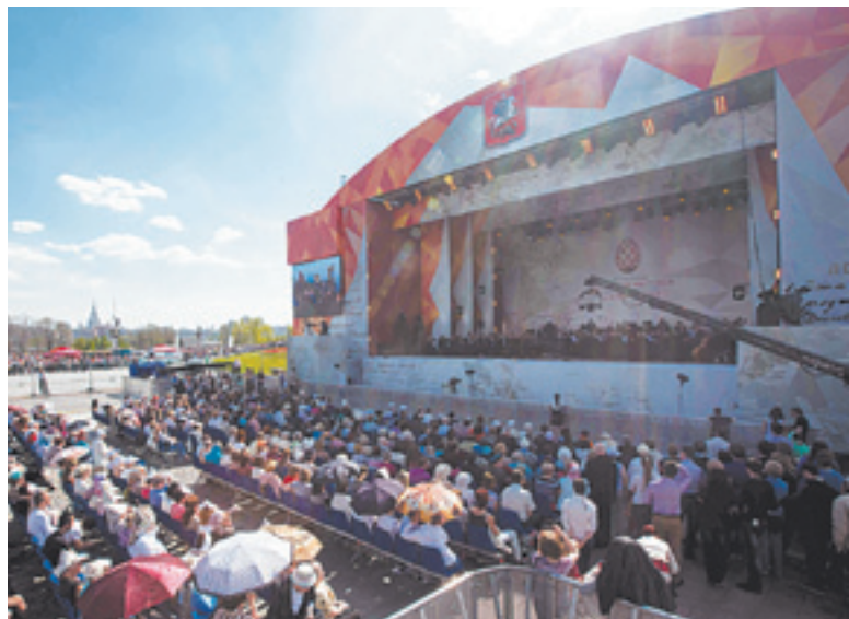
9 мая. Концерт на Поклонной горе

Художественный руководитель Пасхального фестиваля и его главный коллектив – Валерий Гергиев с оркестром Мариинского театра представили на предваряющем официальном открытии музыкального праздника трехчастную нон-стоп программу. Ее составили «Вознесение» О. Мессиана (по авторскому определению – «четыре симфонические медитации»), сюита из оперы Н. Римского-Корсакова «Сказание о невидимом граде Китеже и деве Февронии», а также финал оперы Р. Вагнера «Валькирия» («Прощание Вотана с Брунгильдой и заклинание огня»). Особой приманкой концерта стал немецкий бас Рене Папе (Вотан). Знаменитый артист, обладатель голоса прекрасной, благородной