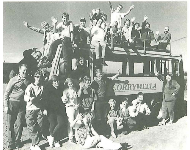
コリメーラ・センターの現在のスタッフとボランティア