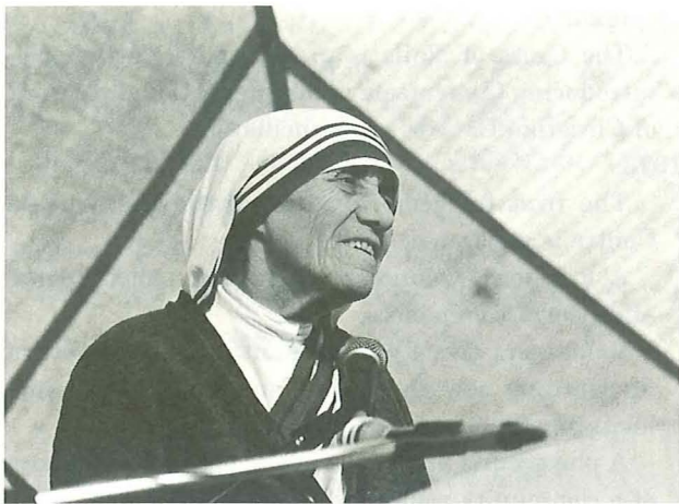
マザー・テレサニがコリメーラで講演 (1981年)