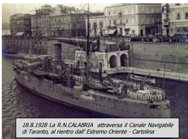
18.8.1928 La R.N.CALABRIA attraversa il Canale Navigabile di Taranto, al rientro dall' Estremo Oriente - Cartolina