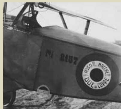
Aereo di Gordesco “Due di Coppe” 76 a Squadriglia