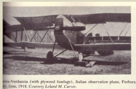
Savoia-Verduccia (with plywood fuselage), Italian observation plane, Furbara, June, 1918.

Fino ad agosto addestra gran parte dei 52 piloti dell'USA Air Service sul campo di volo di Furbara, piloti che poi si faranno onore sul fronte italiano e francese.