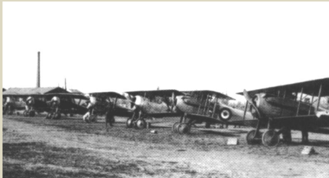
Campo di volo di Aiello. In primo piano due SPAD, seguono Nieuport 11 e 17

➤ 1917 febbraio – 1 novembre. Il Cap. Gordesco è nominato Comandante 80 a Squadriglia formata a sostegno delle battaglie dell'Isonzo; ha una forza di 5 piloti e 5 aerei passata poi, a marzo, a 10 Neuport 11 . Dal 15 marzo effettua sortite di guerra per circa 6 mesi dal Campo Volo di Aiello del Friuli (UD), località Prati ( "l'arido campo di Aiello" G.D'Annunzio). A seguito della battaglia di Caporetto la Squadriglia perde 5 velivoli ed il 27 ottobre è evacuata alla Comina (periferia di Pordenone).