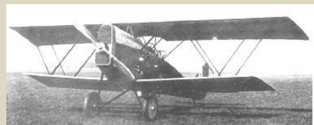
SVA 9 (Savoia-Verducci-Ansaldo)