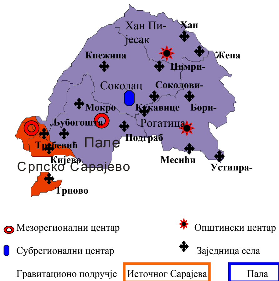
Картограм бр. 3.9: Нодално-функционална регионализација Сарајевско-романијске регије