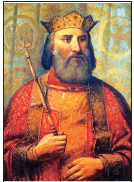
A Nemanja-dinasztia trónját felesége révén öröklő (Szent) Lázár szerb fejedelem (1371–1389), a rigómezei csata mártír hőse

A 19. század közepén, az immár nem egyházi pályákon mozgó, szerb nemzetiségű értelmiségiek számára a nyelvi összehasonlítás, konkrétan a magyar