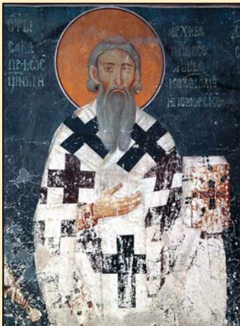
Szent Száva. 13. századi freskó a studenica ortodox kolostorban

ként újra alapították Hilandart az Athosz-hegyen (ez jelenleg a szerbek legnagyobb zarándokhelye). Vezető szerepet vállalt a szerbiai egyház életében: kialakította szervezetét, nyolc püspökséget alapított, rendezte a kolostorok működését, iskolákat és kórházakat hozott létre a kolostorokon belül, összeállította az első szerb jogszabálygyűjteményt. Az egyházi irodalom fordításával elősegítette a szerb irodalmi nyelv kialakulását és megerősítette az ortodox vallást.