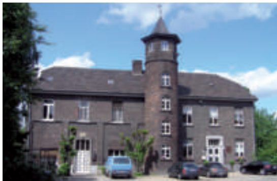
Strommoers (Station 6)