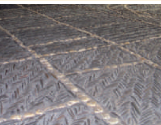
Kieselsteinfußboden am Holtmannshof (Station 10)