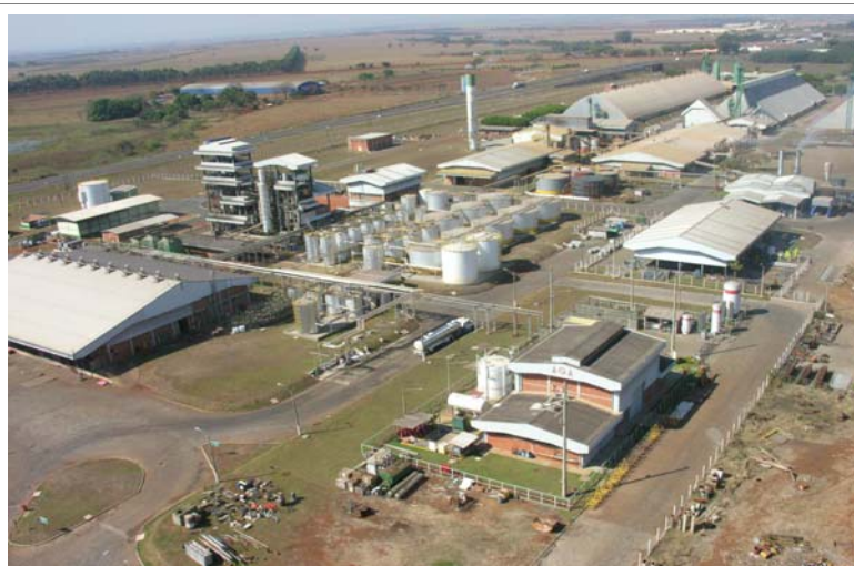
Empresa Maeda em Itumbiara - GO

Como indicação da influência destas empresas e da dinâmica crescente da economia do município, tem-se o aumento no consumo de energia elétrica industrial e o de arrecadação do ICMS, informado nos quadros 1 e 2. A tendência crescente desses dados revela o crescimento da industrialização e da produção no município.