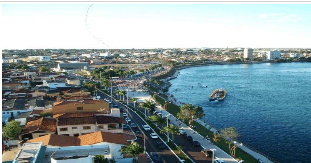
Avenida Beira Rio em Itumbiara - GO

Assim, com capacitação de mão-de-obra e uma agroindústria crescente que gera externalidades positivas na economia, proporcionará uma massa salarial crescente, que refletirá na renda per capita e no desenvolvimento do município. Um bom caminho para um município que tem como meta o desenvolvimento e exploração do seu potencial industrial, ainda mais, diante da expectativa de instalação de novas indústrias na área de biocombustível.