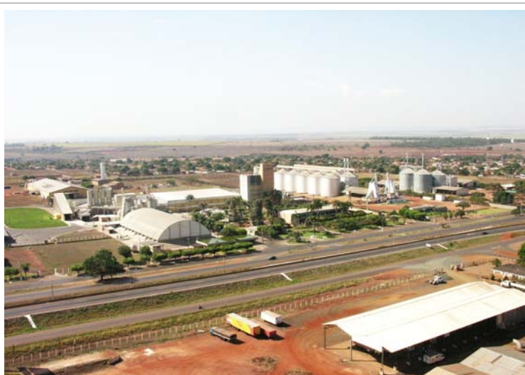
Caramuru Alimentos em Itumbiara -GO

Coopera para este crescimento e desenvolvimento do município, a presença de empresas exportadoras como Caramuru Alimentos (exportadora de soja), Maeda S/A Indústria e Comércio (exportadora de derivados de algodão) e Braspelco (exportadora de couro), que ajudam o município a ser um dos maiores exportadores do Estado de Goiás.