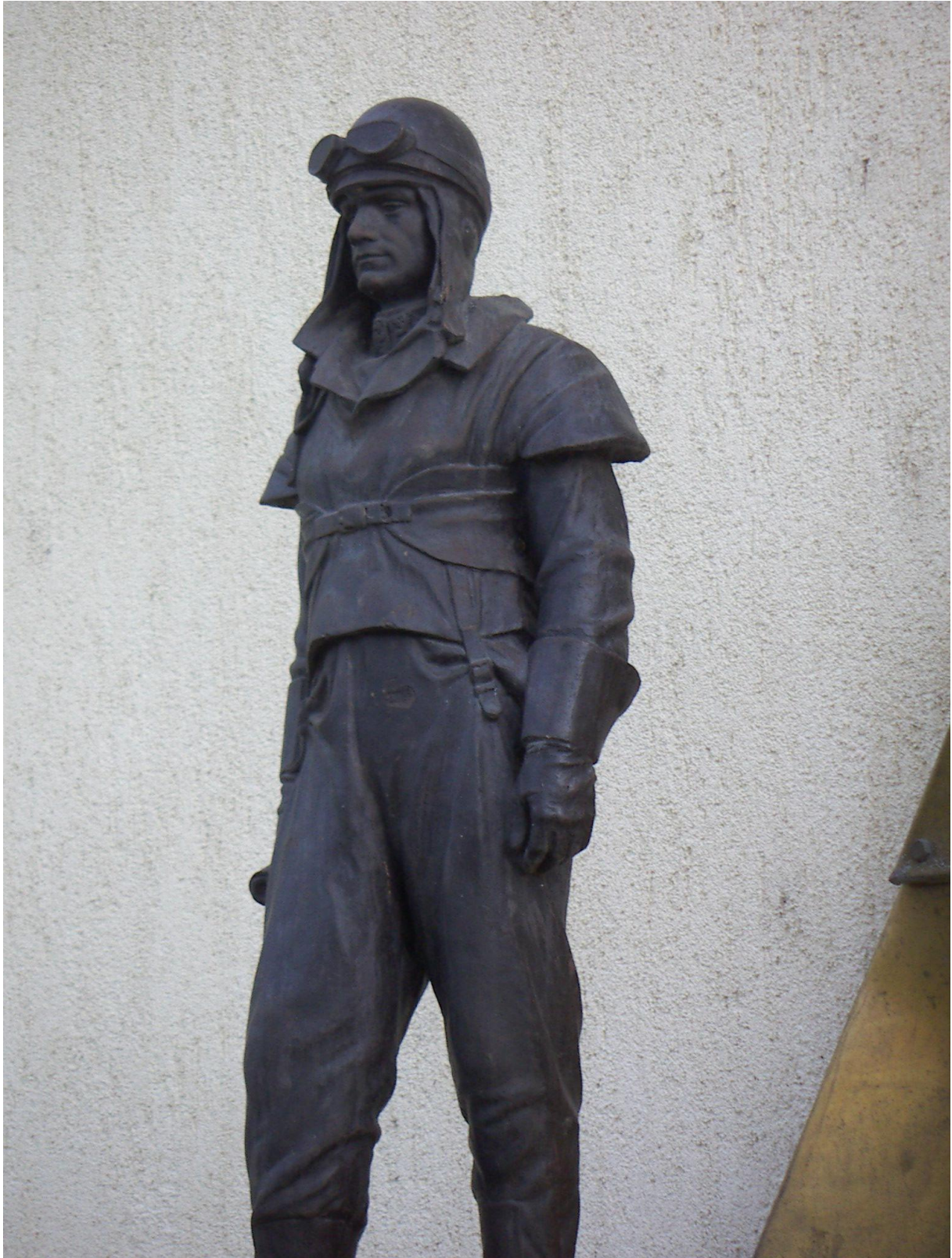
Figure 2 Štefánik' s statue in Szarvas