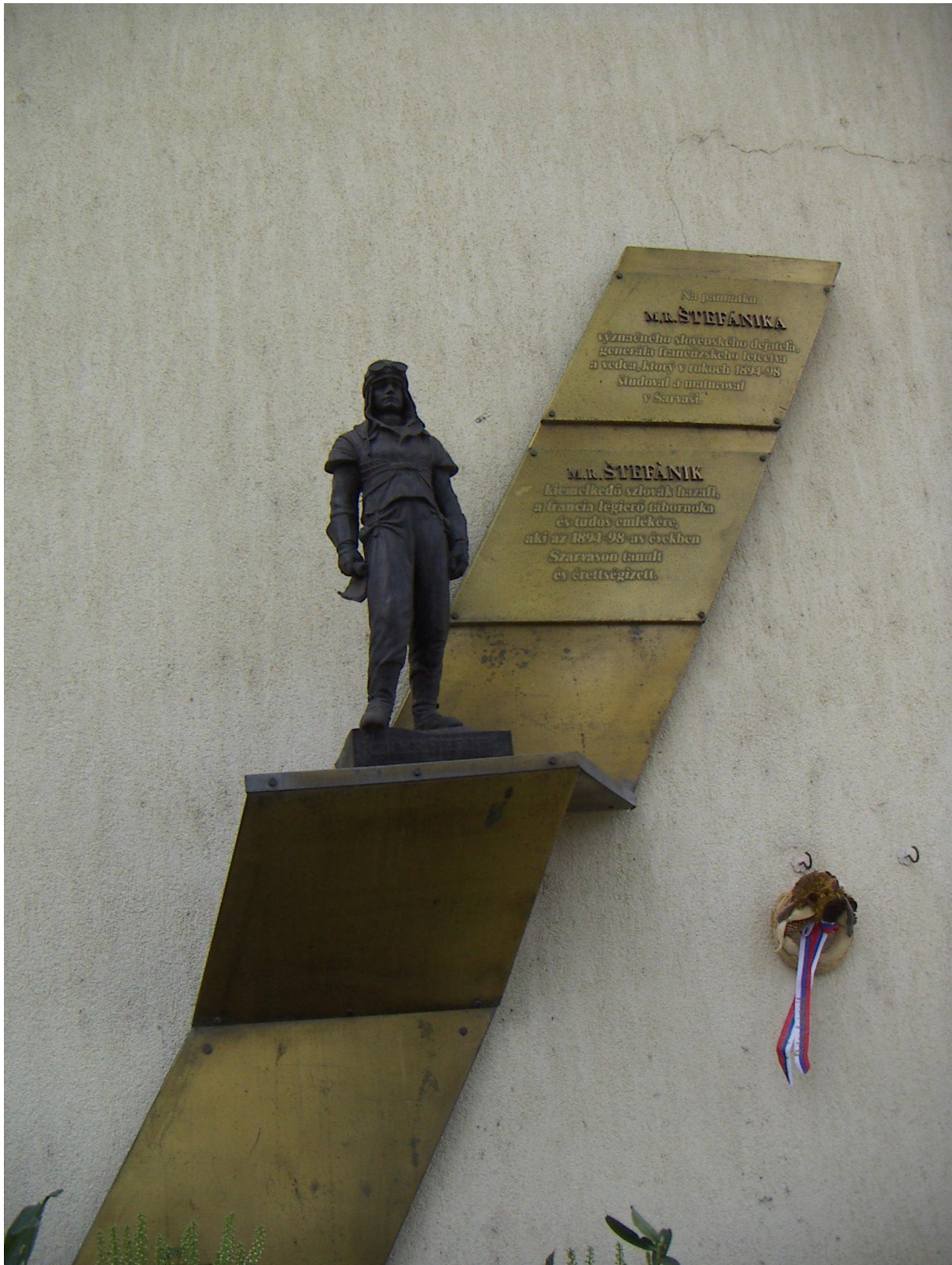
Figure 3 Štefánik' s statue in Szarvas