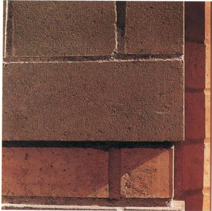
Detalj av tegelfasad vid Svartågatan.