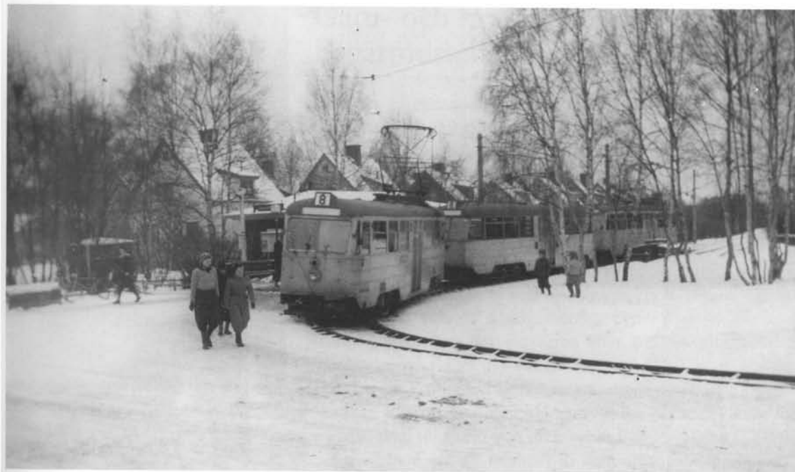
Linje 8 Slussen-Skarpnäck. Skarpnäcks hållplats 1949.

Som ivrig beundrare av Kung Karl XV ställde Neumüller viligt sina ägor till dennes förfogande för militära övningar och parader till minne av ilmarschen över fältet 150 år tidigare. För detta och sina goda relationer till kungen belönades han med Wasaorden.