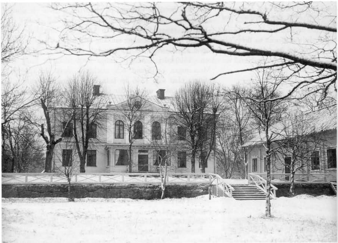
Skarpnäcks gård så som den såg ut under bryggarkungen Neumüllers tid. Foto: Bertil Norberg 1932, SSM.

I Skarpnäcksköpet ingick de stora ägorna liksom tillhörande torp. Senare köpte han även in Nacka gård med såg och kvarnar. Det var samma år, 1862, som lagen om kommunalt självstyre fastställdes, grunden för den kommunala demokratin. Adeln och prästerna avsåg sig då de sista företrädesrättigheterna framför det övriga folket. Men statarsystemet med mer eller mindre livegna jordbruksarbetare blomstrade, och med sådana som arbetskraft och tysk grundlighet lyckades han förvandla gården till ett rationellt mönsterjordbruk.