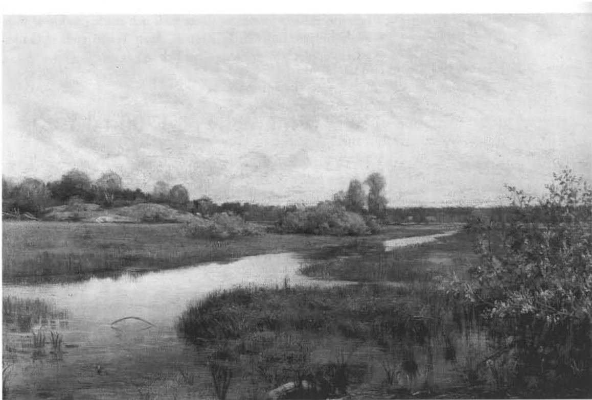
Motiv från Skarpnäck. Oljemålning av Pauline Åkerlund 1894. Foto: Lennart af Petersens, SSM.

Arbetet bekostades av kvarn- och stamparrendatorer i Nacka som ville få bättre vattengång. Kvarnarna arrenderades av bagare i Stockholm vilket kanske var skälet till att mossen började kallas Bagarmossen . Utdikningen föranledde bråk med innehavaren av Lill-Sickla, som ansåg att det var hans vatten man tog.