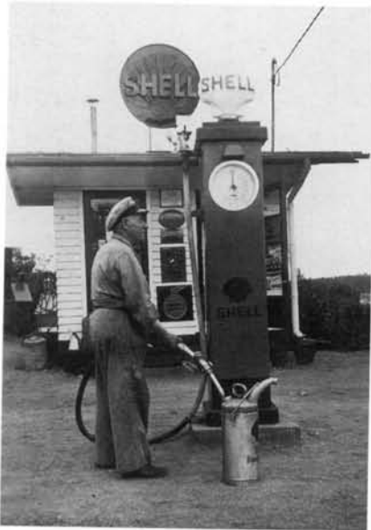
Skarpnäcks första bensinmack vid Gamla Tyresövägen där Pungpinans krog låg på 1700-talet.

och friherreskap liksom av större gods och markegendomar som adeln tidigare förlänats av Kronan. Även Tyresö gods styckades därvid upp och Skarpnäcks säteri fick nya ägare.