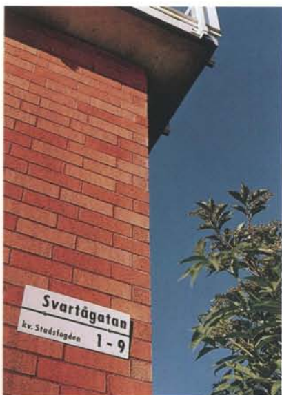
Flera av gatorna i Bagarmossen har fått sina namn efter svenska åar och vattendrag.