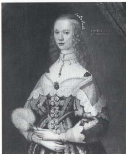
Grevinnan Maria Sophia De la Gardie (1627–94).

När Karl XI kom till makten var statskassan tom. År 1680 togs därför beslutet om den så kallade stora reduktionen , det vill säga indragningar, uppstyckningar och utförsäljningar av grev-