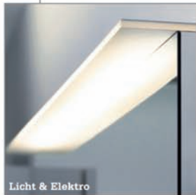
Licht & Elektro

schneidertes Bad aus einer Hand. Vom kleinen Bad bis zur Badelandschaft überzeugen wir Sie mit Ideen, Know-how und einem zuverlässigen Meisterteam ..