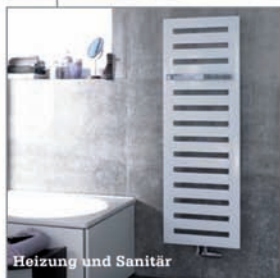
Heizung und Sanitär