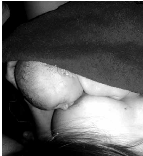
12 minut na světě

Alena: Velmi mnoho se mluví a píše o pozitivních a úspěšných případech porodů doma, méně však, spíše vůbec, o těch nepovedených a s komplikacemi. Je na matce a jejím svědomí, zda jí toto riziko za chvíli pohody stojí.