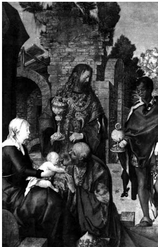
Albrecht Dürer, Klanění tří králů , olej na plátně, 98×111 cm, 1504, Florencie, Galleria degli Uffizi

O vánocích se v liturgii zdůrazňuje blahosklonnost a dobrovolné ponížení Božího Syna, jenž se stal chudým lidským dítětem. O Epifanii se naproti tomu zaměřuje pohled na božskou velikost tohoto dítěte, která již vyzařuje do světa. Vánoční doba