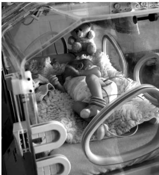
Je třeba pomoci

Co dodat? Pestrost názorů napovídá, že shrnutí cího závěru v jedné větě těžko dosáhneme. Proměnných je hodně a pohled profesionálek, jejichž rukama prošly stovky maminek i miminek je pochopitelně jiný než osobní pohled těhotné ženy. Podle údajů v časopise Děti a my klesl průměrný počet dětí na jednu ženu v ČR na 1,3 a přibývá žen, které nechťejí родit vůbec. Počet císařských řezů se od revoluce více než zdvojnásobil. Bezpochyby máme mezi porodníky většinu vynikajících od-