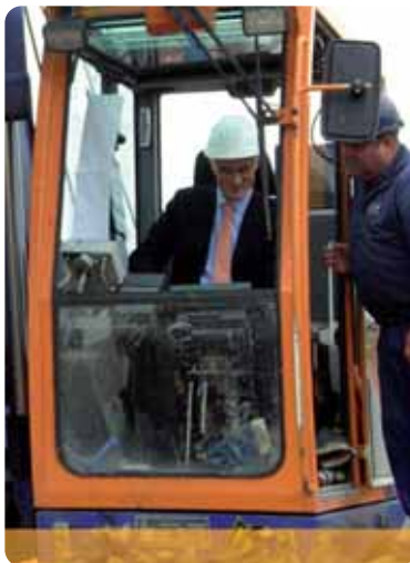
Geert Bourgeois: "Goede funderingen zijn letterlijk en figuurlijk van groot belang."

Tussen de verschillende commissies door keurt hij de subsidies goed voor