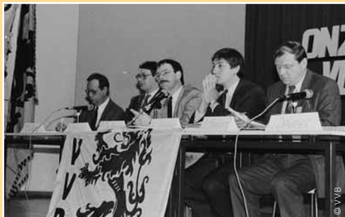
Op 21 april 1991 organiseerde de Vlaamse Volksbeweging in Kortrijk een nationaal congres onder het motto 'Onze toekomst in Europa: Vlaanderen onafhankelijk'. Op de foto onder anderen Peter De Roover, Jan Jambon en Jaak Peeters.

me klonk als incivismisme. Ondertussen is de VVB al veel verder gevorderd, in de richting van Vlaamse onafhankelijkheid. De