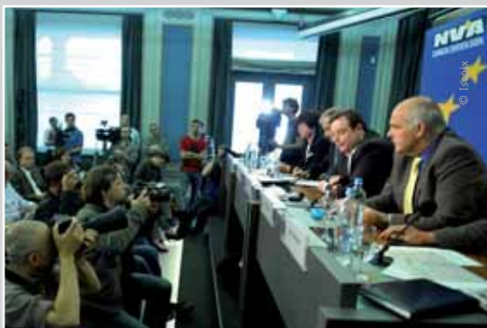
De internationale persconferentie werd druk bijgewoond.

Op 8 juni - vijf dagen voor de verkiezingen - organiseerde de N-VA een internationale persconferentie in hartje Brussel. Voorzitter Bart De Wever stelde er de visie van onze partij voor en counterde er in één klap het gespin van onze opponenten als zou een overwinning van de N-VA de financiële markten verontrusten. De persconferentie kwam er na tientallen interviewaanvragen van buitenlandse persluiders en werd dan ook druk bijgewoond. Zo waren er onder anderen journalisten uit Frankrijk, Duitsland, Groot-Brittannië, Tsjechië, Spanje, Nederland, Zweden, Finland, zelfs Japan ... Niet alleen in eigen land is de interesse voor onze partij sterk toegenomen, ook over de grenzen