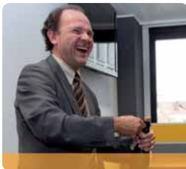
Vlaams minister van Sport Philippe Muyters zal de komende zes maanden het sportgezicht van de EU zijn.

Met het Verdrag van Lissabon is Sport op 1 december 2009 immers een aan-