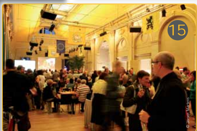
Meer dan 1,2 miljoen kiezers stemmen N-VA. Daarmee wordt de partij de grootste van Vlaanderen. Ook vanuit Morsel en Gent (Handelsbeurs) bereiken ons feestelijke foto's.