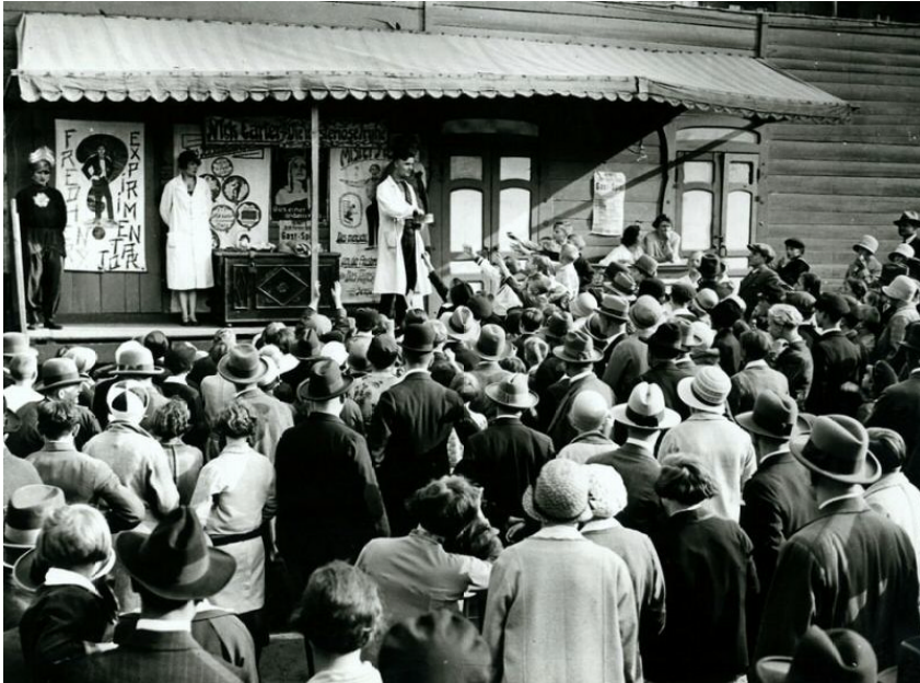
„Sideshow“ eines deutschen Zirkus, Silbergelatineabzug, vermutlich vor 1920, Fotograf unbekannt (Sammlung d. Verf.)

ten öffentlichen Erscheinungsbild dieser Institution unterscheidet. Sein Interesse an eben jenen Aktivitäten im Hintergrund, im Halbdunkel, im vordergründig nicht Wahrgenommenen oder Verdrängten, im Unaufgeräumten sollte seine wissenschaftlichen Arbeiten in der Soziologie wie auch die zur Parapsychologie und anderen Gebieten der Anomalistik sein Leben lang mitbestimmen. Das Abschreckend-Verlockende und gerade darum besonders Faszinierende, das dem öffentlichen Blick Entzogene („Okulte“) kann sich fortan seiner besonderen Aufmerksamkeit, seines kritischen Verstandes und seiner sorgsam abwägenden Begutachtung sicher sein.