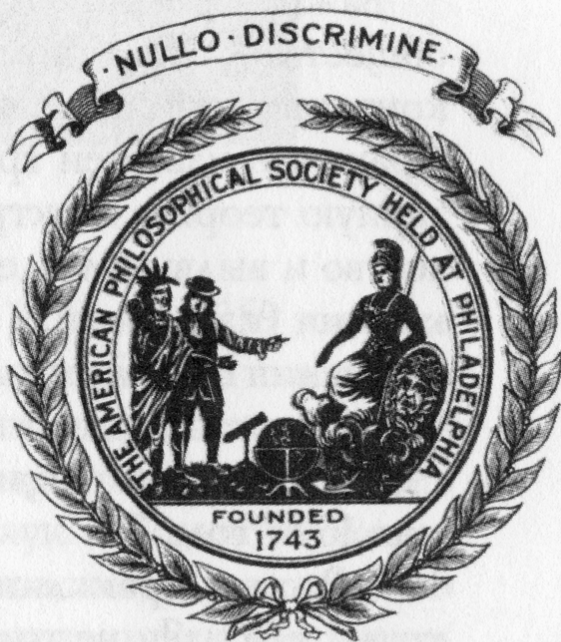
Эмблема Американского философского общества