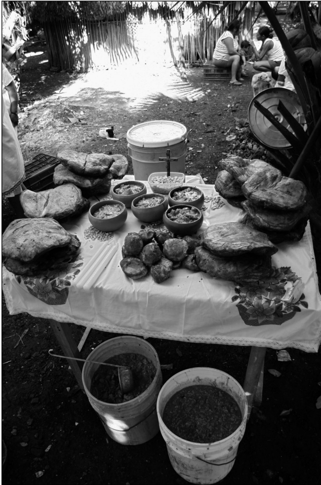
Fig. 8 El altar está lleno de ofrendas.