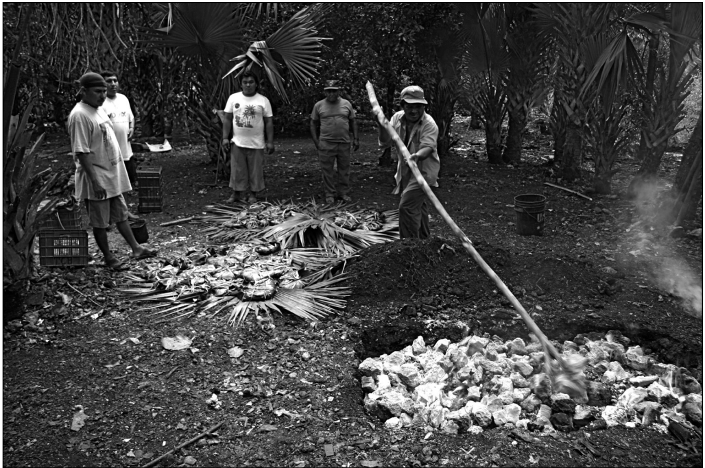
Fig. 4 Los panes envueltos en hojas al lado del horno, listos para enterrar.

La razón por la que mis informantes llevaron a cabo el jeets' lu'um era la enfermedad de la hija y de los animales. Me explicaron que, a diferencia del suyo, los vientos malignos no habían amenazado al terreno de al lado. Hanks describe que el j-men con quien trabajó consideraba el terreno afectado por los malos vientos como algo absoluto donde se encuentran los cuatro puntos cardinales más el medio (1990: 343). Considero el horno de tierra como indispensable en el jeets' lu'um . Para calmar los vientos del terreno se entierra el cielo de 13 capas de los túuti waj y de los ch'imo'ob en el horno de tierra, pib (Figs. 4-7). Doña Berta también asocia los aluxo'ob con vientos, “porque los aluxo'ob contienen viento y por eso pueden enfermar a la gente” (cf. Montemayor 1999: 109).