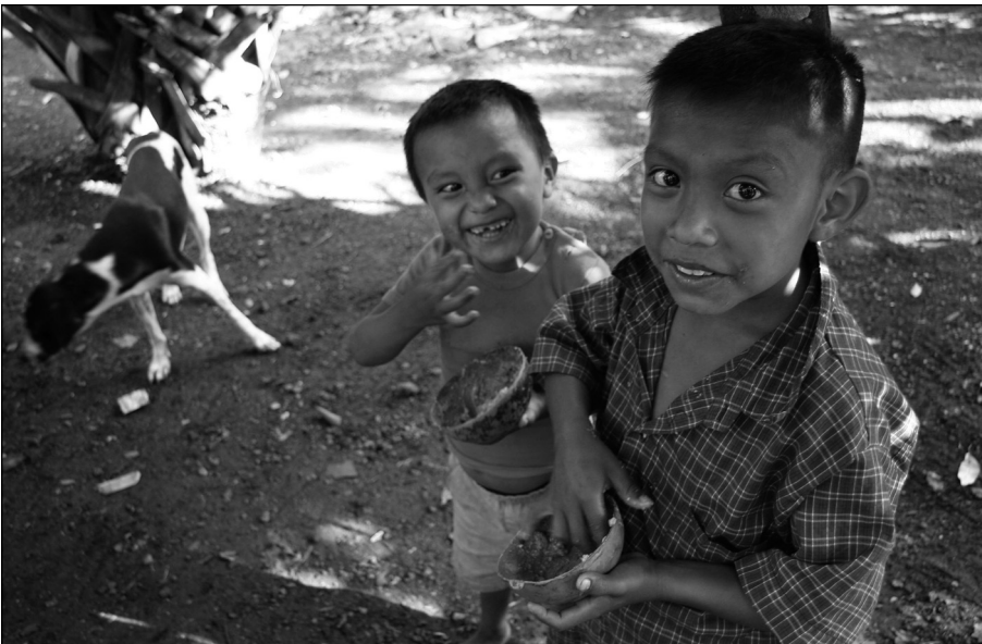
Fig. 12 Todos quedan satisfechos.