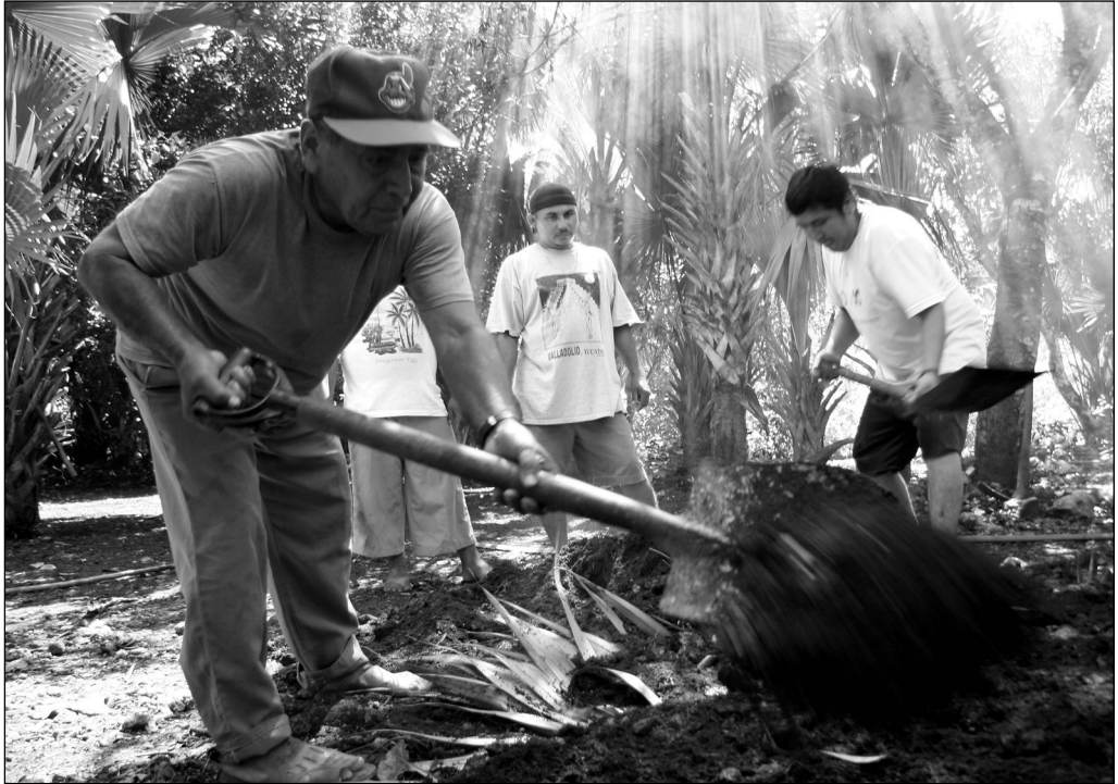
Fig. 7 Se tapa el horno con tierra.