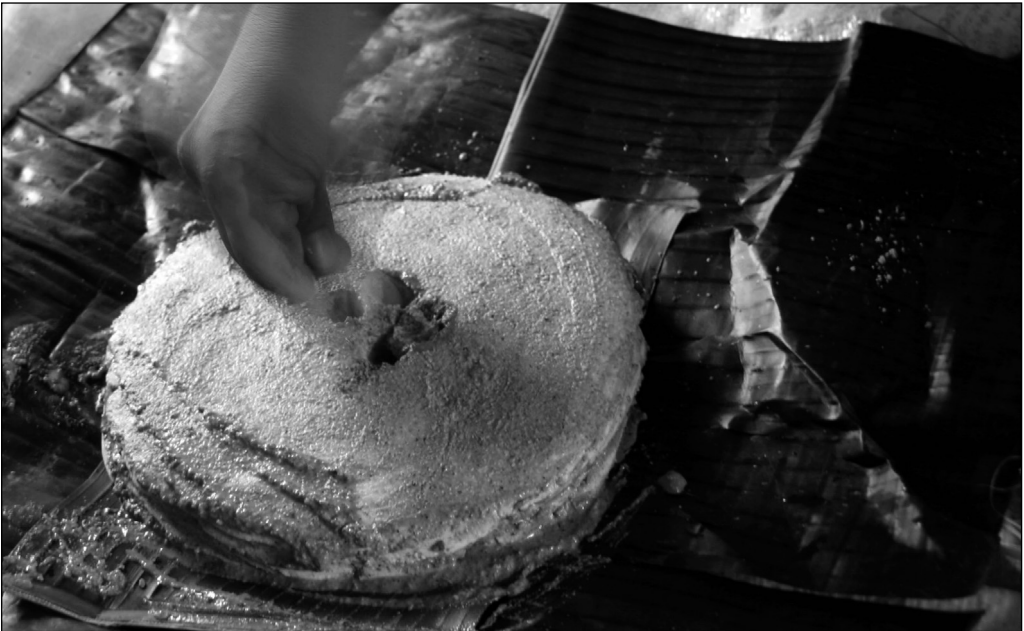
Fig. 3 Se hacen ojos en los panes para darles vida.

Los panes se hicieron en un proceso ritualizado. Hombres y mujeres trabajaron mano a mano. Las mujeres hicieron las tortillas gruesas, u péenchuko'ob , y los hombres las apilaron junto con la pepita. Hacer la tortilla es el trabajo clásico de la mujer. Pero, ¿por qué dejaron este proceso en el momento de apilar los péenchuko'ob con la pepita? En cada rito que observé, hubo división del trabajo basada en el género 5 durante las diferentes etapas del proceso de preparación. En este ritual las mujeres terminaron los panes, no habiendo así diferenciación por género del trabajo. Me parece ritualizado el proceso de hacer los panes entre hombres y mujeres por los espacios que los participantes ocupan y las actividades que realizan. Junto a la mesa estaban solamente las mujeres, haciendo los péenchuko'ob . Al otro lado de la casa los hombres apilaban la pepita y al final hicieron cuatro ojos a los panes (Fig. 3). Unas eran las labores de los hombres y otras las de las mujeres. La división del trabajo basada en género es un comportamiento normal en el Mayab. Antiguamente, a las mujeres no se les permitía estar presentes en el ch'a cháak (el rito para llamar a la lluvia). Los hombres eran los únicos encargados de preparar la comida ritual. Hoy en día, esta tradición está cambiando. Las mujeres participan en muchos ritos que antaño eran exclusivamente masculinos, aunque la separación de género al preparar los alimentos rituales todavía está presente.