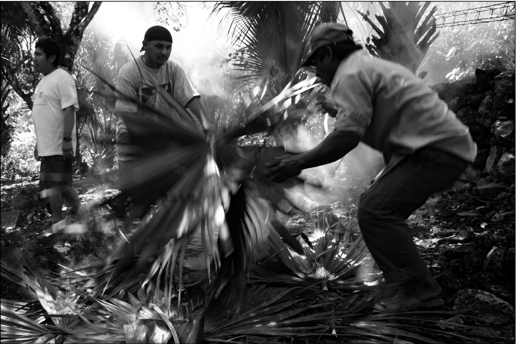
Fig. 6 Se tapa el horno con las hojas de palma.