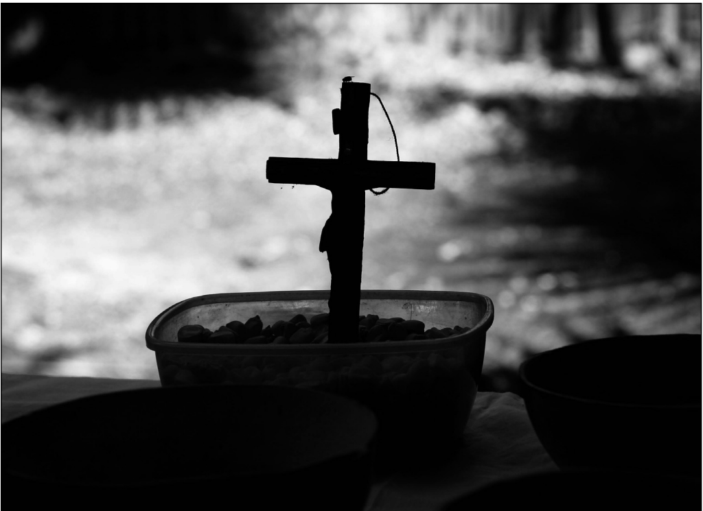
Fig. 14 El crucifijo con el maíz.

El crucifijo se pone en el recipiente con los granos de maíz (Fig. 14). Los túuti waj con sus trece capas representan “algo divino, porque trece es un número de Dios”, como lo expresó el padre de esta familia. Terán, Rasmussen y Cauich vinculan los panes rituales de trece capas con Jesucristo con sus doce discípulos. En el pasado, las trece capas representaban a los trece cielos de los mayas donde radicaban los diferentes dioses celestiales (Terán, Rasmussen y Cauich 1998: 59). En el proceso ritual, durante la preparación de la comida se forma una clase de hostias que desde mi punto de vista, alimentan el cuerpo y el espíritu.