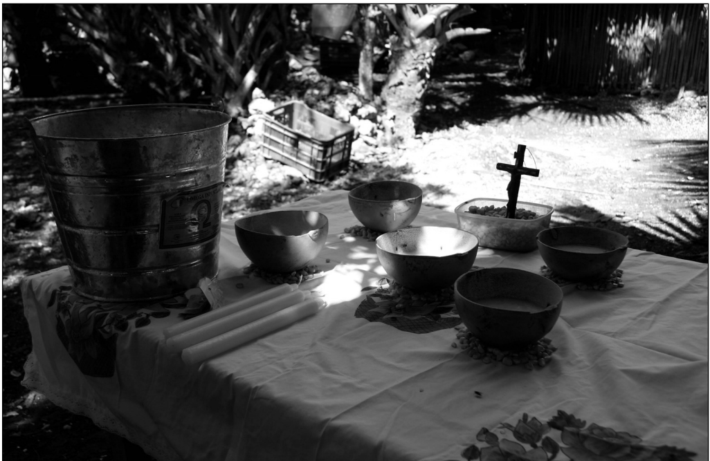
Fig. 1 El saka' sobre el altar.

Sobre el altar —en maya yucateco, ka'an che' — había maíz en grano, como base para las jícaras, evitando así que el saka' , la bebida ritual, se derramase, y un crucifijo dentro de un traste de plástico, lleno hasta la mitad de granos de maíz. “Esta vez tomaron maíz, normalmente usan piedras para que las jícaras no se caigan”, comentó doña Berta respecto al uso ritual del maíz. Ella había puesto el saka' en las cinco jícaras. “Normalmente lo endulzan con miel de abeja, esta vez tomaron azúcar de caña, también sirve”, añadió y empezó con el rito del jeets' lu'um . (Fig. 1)