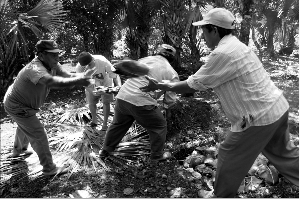
Fig. 5 Se ponen los panes en el horno.