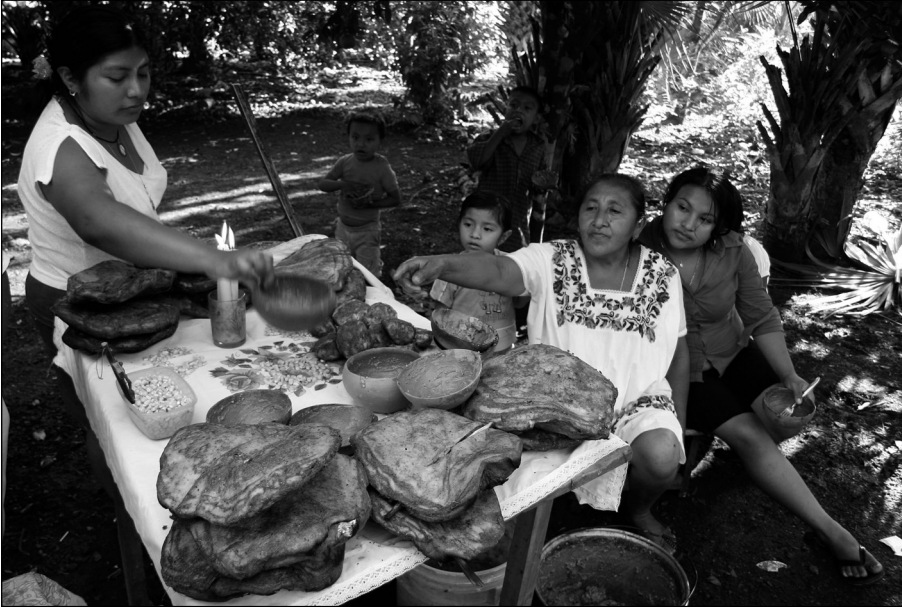
Fig. 10 Las mujeres de la familia junto al altar.

medio del altar y al lado puso los panes: los panes celestiales sacados del fuego del horno de tierra, y hechos ofrenda y hostia, son llevados al altar, al ka'an che' , al lado del altar, en el suelo había tres cubos llenos de chok'o' (Fig. 8). Encendió tres velas y quemó incienso. Cuando terminó el rezo, todos los demás empezaron a comer (Figs. 10-13).