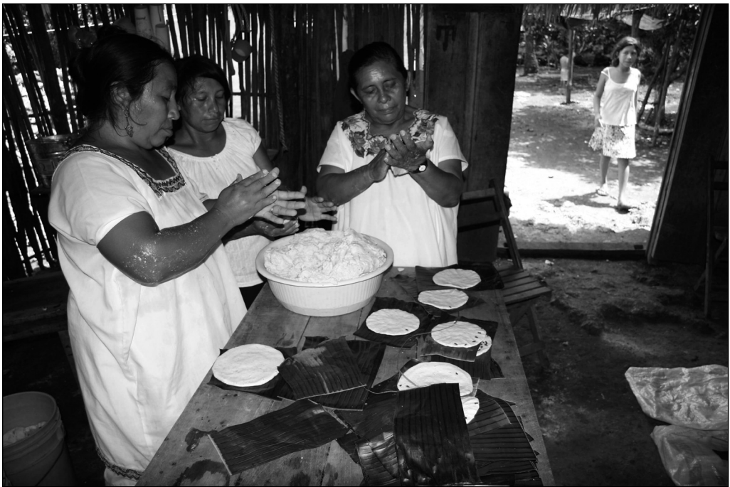
Fig. 2 Las mujeres hacen tortillas en la cocina.