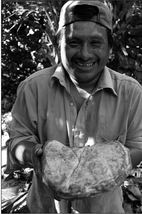
Fig. 11 El padre de familia con un pan ritual, u uuti waj.