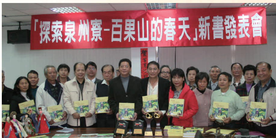
◆《百果山的春天》新書發表會2008.01