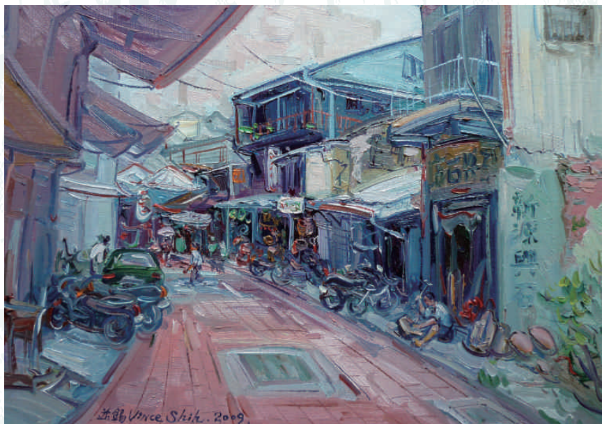
畫家施並錫作品「打石巷」2009