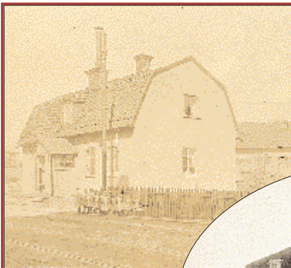
»Lilla Hemmet» hade plats för tio barn.

Edvard Welander gav de syfilissmittade barnen en chans till liv och hälsa