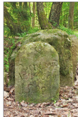
IV Zent- und Jagdstein von 1599 - Nördlich Tiereller