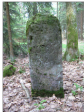
II Zent- und Jagdstein von 1599 - Nordlich der Straße nach Seßlach