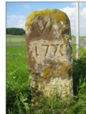
VII Grenzstein - westlich Rossach