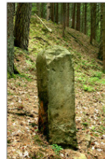
VI Birkengrabensteine - westlich Welsberg