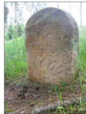
V Landesgrenzstein von 1803 - Neues an den Eichen/Schloß