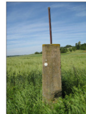
VIII Treibstaben - Kreuzel Rossach