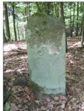
III Zent- und Jagdstein von 1599 - Nahe Tiereller