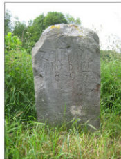
I Zent- und Jagdstein von 1803 - Nahe Watzendorf/Schneidtschke