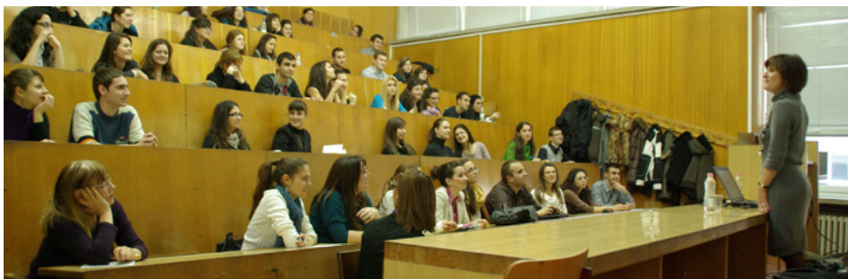
Лекцията събра около 70 студенти, които активно се включваха по време на дискусиата.