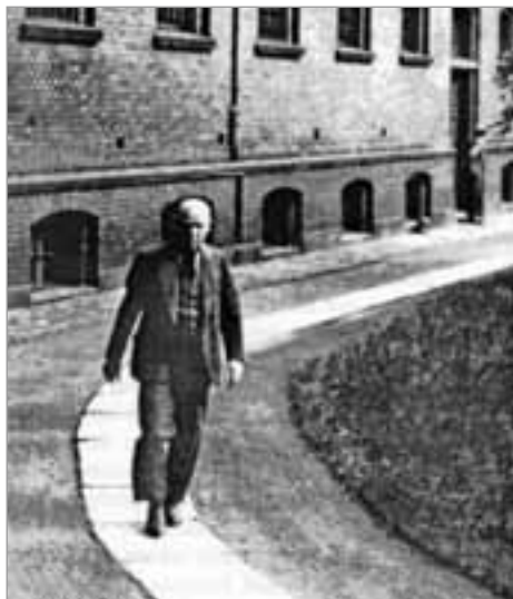
Wie ihr Führer Ernst Thälmann – hier im Hof des Untersuchungsgefängnisses Moabit – wurden Zehntausende deutsche Kommunisten durch das faschistische Schreckensregime eingekerkert. Auch Erich Honecker mußte zehn Jahre hinter Zuchthausmauern verbringen.

Das Kommando der GSSD ließ die Honeckers zur weiteren medizinischen Behandlung nach Moskau ausfliegen. Doch