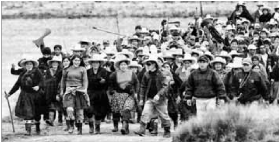
Am 31. Mai begann in der Region Cajamarca ein unbefristeter Generalstreik.

taler Repression gewesen ist, habe sich ein politischer Erdbeben vollzogen, lautete damals der Tenor vieler Kommentare. Hinter den über Nacht zum Staatschef aufgestiegenen Favoriten eines breiten politischen Spektrums stellte sich nicht nur die gemäßigte Linke. Auch die kampferfahrene Peruanische KP sicherte dem Wahlsieger ihre volle Unterstützung zu.