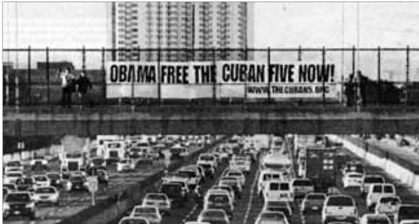
Spruchband über einem der befahrensten Highways in der Region von San Francisco

entsprechende Maßnahmen zur Vereitelung von den Exilkubanern geplanter Anschläge ergreifen konnte. Während das „Bureau“ in dieser Hinsicht nichts unter-