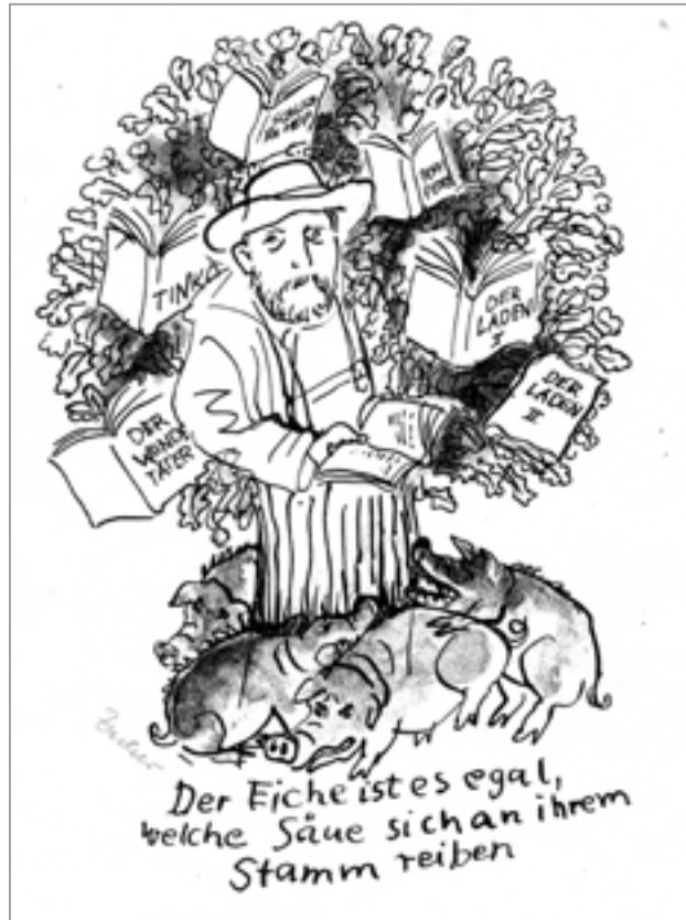
Grafik der bekannten DDR-Kinderbuchillustratorin Gertrud Zucker, Bad Saarow

reinfällt, in dieser rabenschwarzen, miesen Historienposse eine Rolle zu übernehmen. Mancher bäumt sich aber auch nur an Strittmatters Biographie auf, um die eigene unbedeutende ein wenig aufzupolstern und ins Gespräch zu bringen.