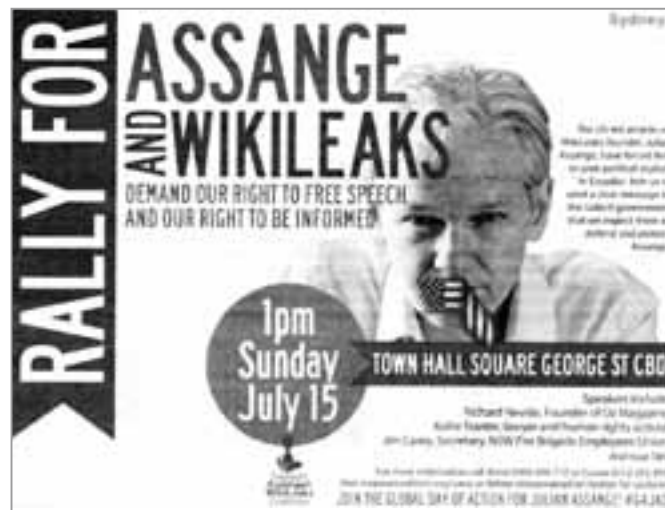
Australiens Antiimperialisten bekundeten auch durch diese Anzeige, die der kommunistische „Guardian“ veröffentlichte, ihre Solidarität mit WikiLeaks-Gründer Julian Assange.