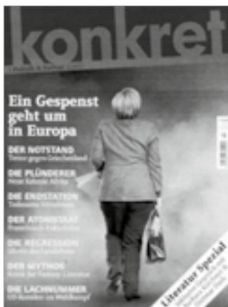
Ein Hamburger Magazin sieht ein Gespenst in Europa ...

vertreten wir in Übereinstimmung mit Marx und Lenin eine ganz andere Position. Dieses „vereinigte Europa“ ist doch lediglich die Einheit der Schafe im Magen des Wolfes. Das EU-Projekt stellt die bisher höchste Eskalationsstufe der Aushebelung des auf den Beziehungen zwischen Nationalstaaten beruhenden Völkerrechts dar. Wäre es denkbar, daß z. B. Venezuela, Brasilien, Chile, Argentinien, Uruguay, Ecuador, Bolivien oder gar Kuba – bei aller notwendigen Zusammenarbeit im lateinamerikanischen Raum – auf ihre Nationalstaatlichkeit zugunsten eines Sammelbeckens unter Vorherrschaft der USA verzichten würden?