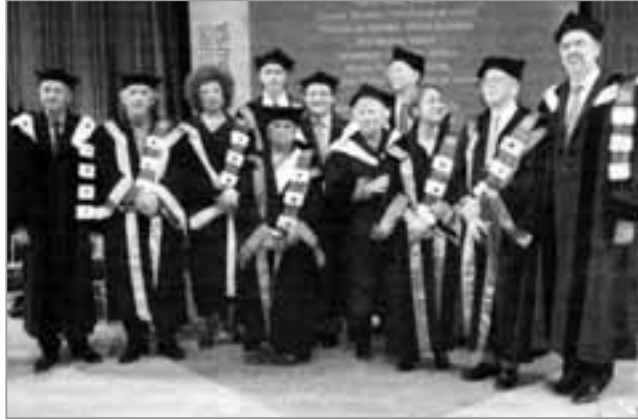
Angela Davis (3. v. li.) bei der Ehrenpromotion in Brüssel

hatte“, sagte Angela Davis. „Unser Fehler bestand darin, daß wir nach der Wahl Obamas den Druck auf ihn nicht aufrechterhalten haben. Man hätte die Massen sofort mobilisieren und mehr Druck auf