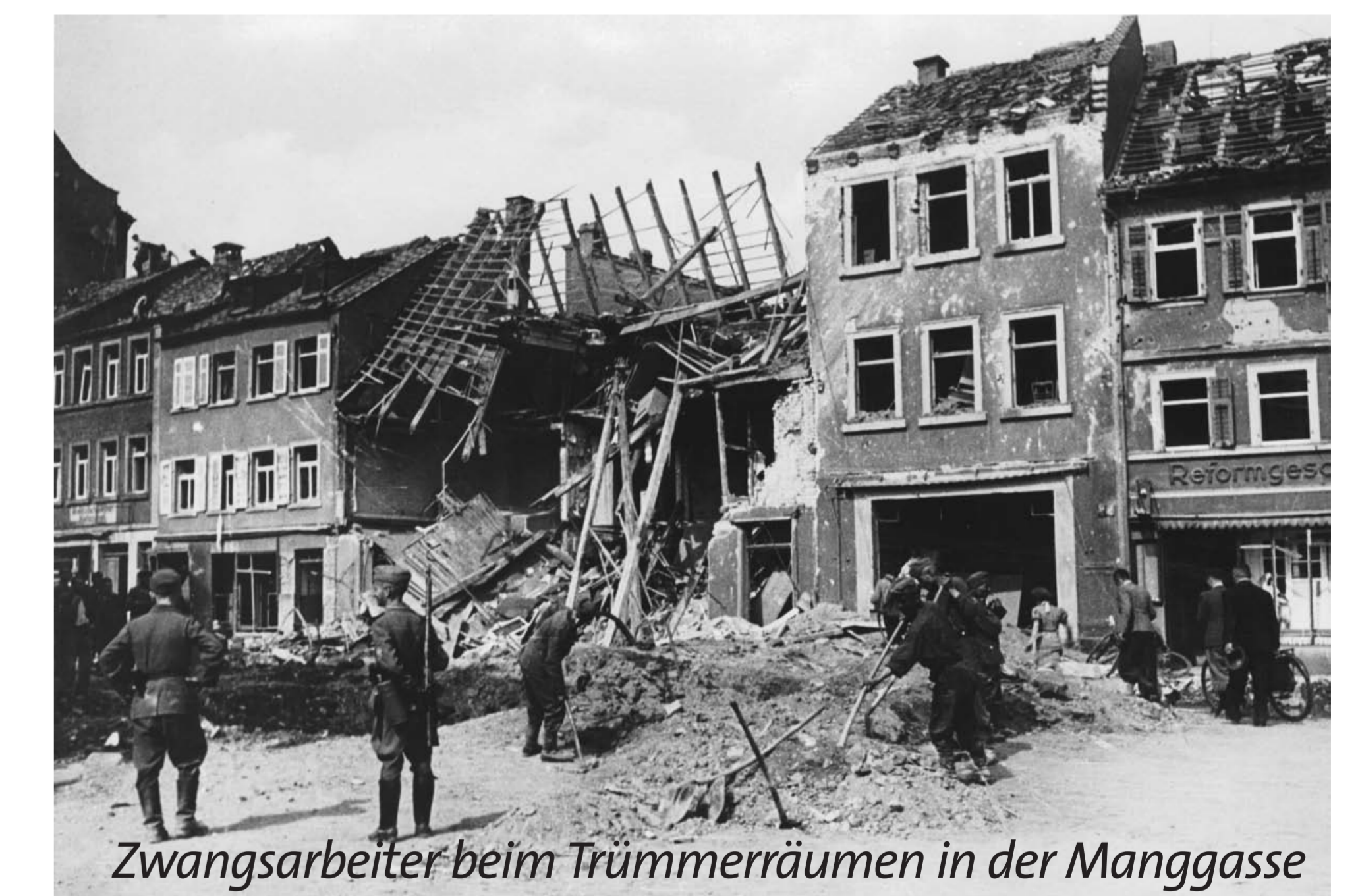
Zwangsarbeiter beim Trümmerräumen in der Mangasse