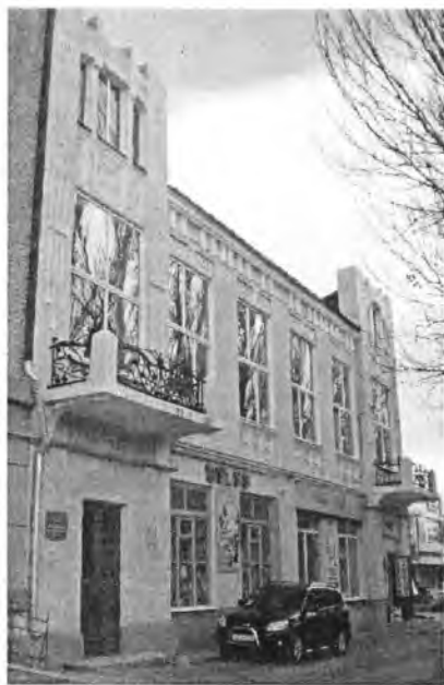
Банк Общества взаимного кредита