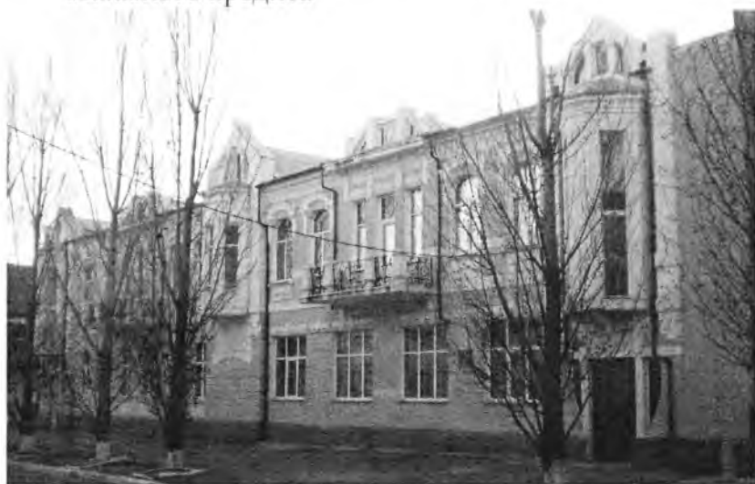
Дом Самуила Полякова