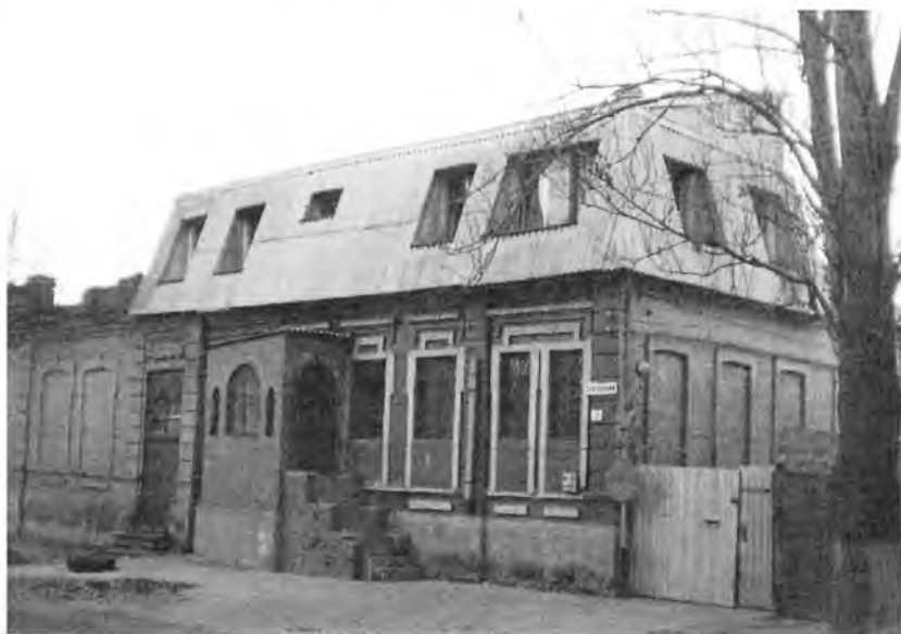
Дом Абрама Французова