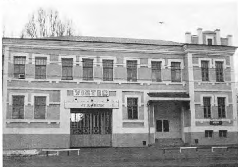
Завод В.Г. Французова