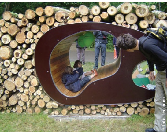
Educatie en ecologie geïntegreerd in de houtril