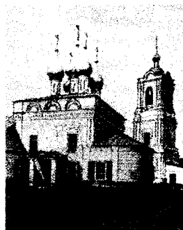
Церковь св. Николая Чудотворца в Драчах (1688 — 1939); колокольня XVIII в.