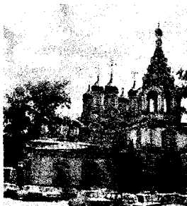
Церковь Знамени Пресвятой Богородицы у Петровских ворот (1681)