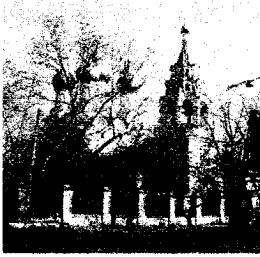
Церковь св. Николая Чудотворца в Пыжах (1672)

слободы, жители которой ранее составляли приход церкви Благовещения Пресвятой Богородицы 149 , ставшей слободским храмом местного стрелецкого приказа.