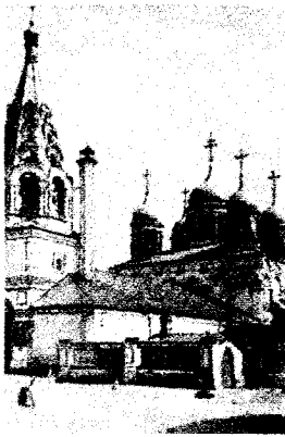
Церковь Спаса Преображения на Песках, за Петровскими воротами (после 1657 – 1934)