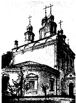
Церковь св. Николай Чудотворца в Воробине (1693 – 1932)