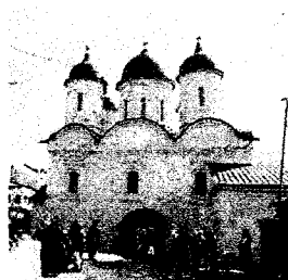
Церковь Живоначальной Троицы в Сухарево или в Листах (1661)

После возвращения из Низовского похода в марте того же года стрельцы Пушечникова приказа наряду с другими его участниками