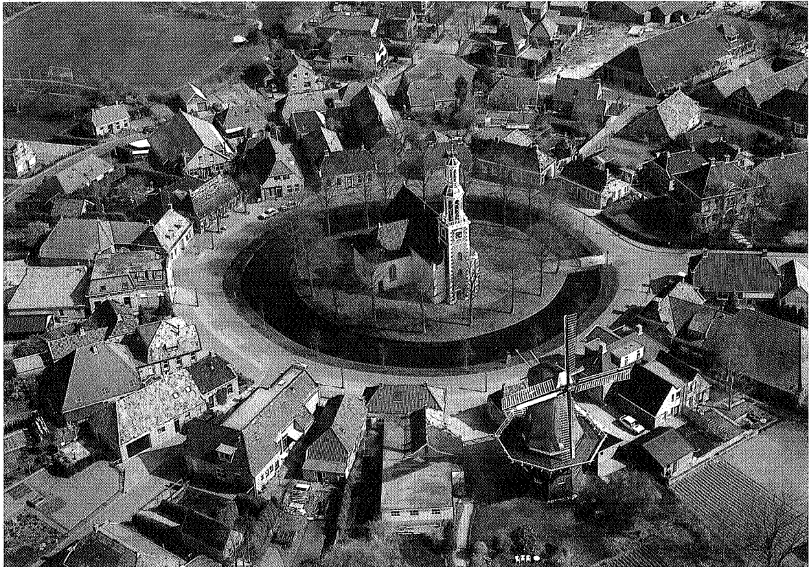
De kerk van Spijk op de top van de wierde

van het dorp. Aan 't Loug vinden we de korenmolen Ceres en verschillende monumentale panden. De Sarrieshut, waar men de belasting op het malen van het meel moest betalen was op nr. 14. De radiaire structuur en de osseweg van de oude wierde zijn goed bewaard gebleven.