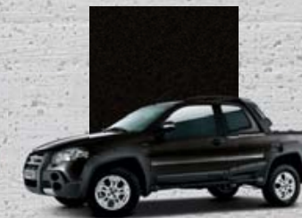
807 Czarny Vesuvio