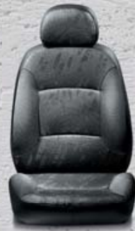
309 Tkanina Jacquard Rede