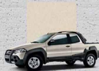
761 Beżowy Savannah