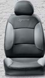
432 Skóra (opcja)