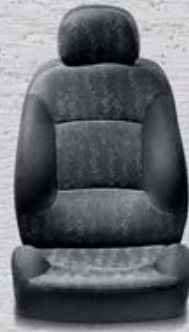
393 Tkanina Jacquard Trib