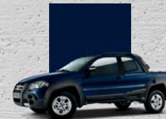
460 Niebieski Trinidad