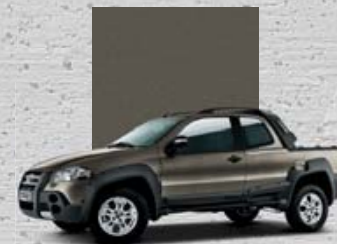
301 Szary Terra