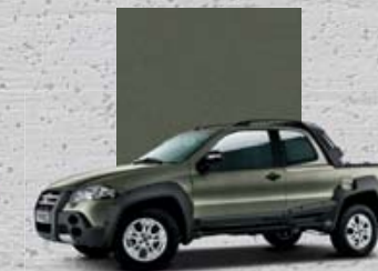
577 Zielony Savage