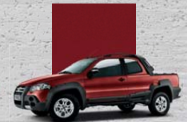
155 Czerwony Lumberjack