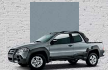
692 Szary Scandium