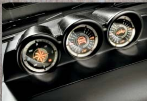
Kompas i pochyłościomierz w Fiacie Strada Adventure.

Praca z Fiatem Strada nigdy dotąd nie była tak wygodna i relaksująca. Każdy, kto pracuje, wie, co oznacza zmęczenie, i wystarczy mu rzut oka, aby rozpoznać prawdziwą wygodę. Zajmij miejsce za kierownicą Fiata Strada – z pewnością Cię nie rozczaruje. Całe wnętrze, poczynając od deski rozdzielczej, zyskało nowy wygląd. Przyciski sterujące są łatwo dostępne i proste w obsłudze, aby zapewniać komfort jazdy w poczuciu pełnego bezpieczeństwa. Strada to samochód zaprojektowany do ciężkiej pracy i z myślą o niezrównanej jakości. Tapicerka siedzeń i materiały wykończeniowe przywodzą na myśl auto wyższej klasy. W wersji Adventure jako wyposażenie opcjonalne dostępna jest skórzana tapicerka.