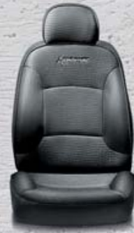
342 Tkanina Jacquard Pietra