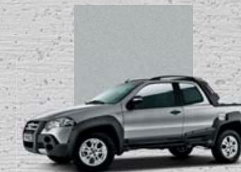
619 Srebrny Bari