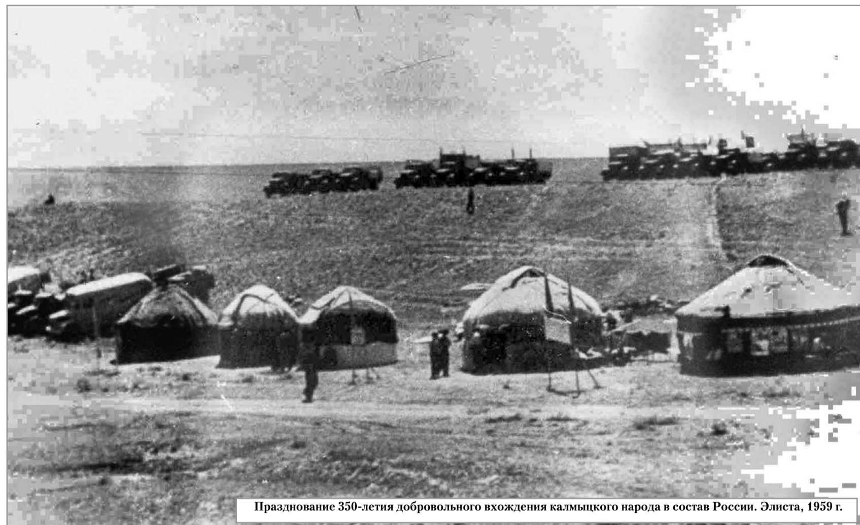
Празднование 350-летия добровольного вхождения калмыцкого народа в состав России. Элиста, 1959 г.

ствующие изменения. Эта характеристика до сих пор хранится в моем личном архиве.