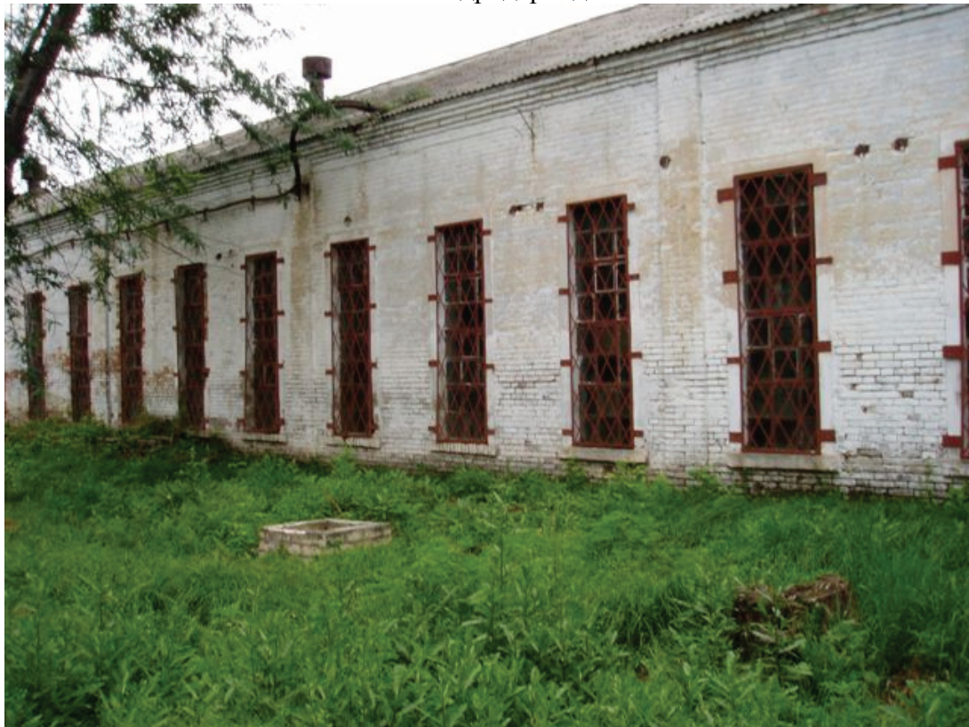
2008г. с. Александродар. Здание фабрики Якоба Герцена.