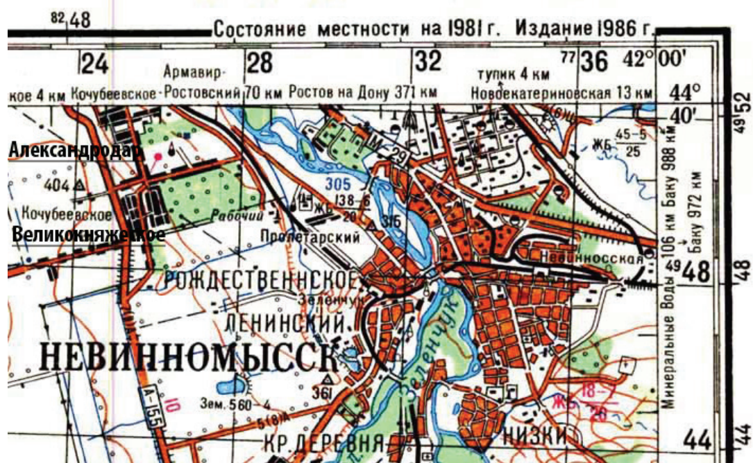
Современная топографическая карта м-ба 1: 200000 района с. Велик княжеское и Александродар