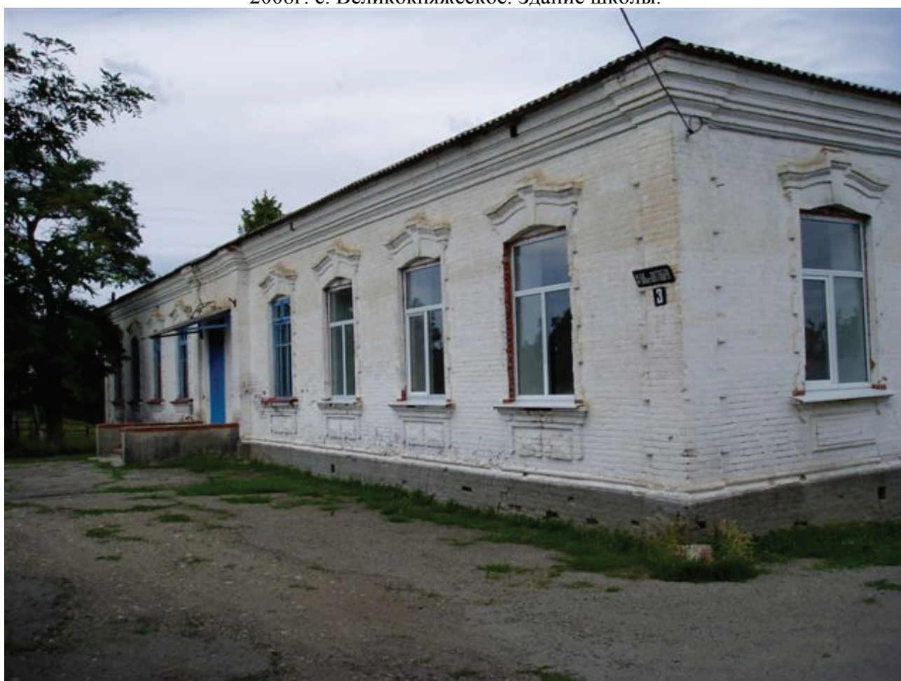
2008г. с. Великокняжеское Здание сырной фабрики.