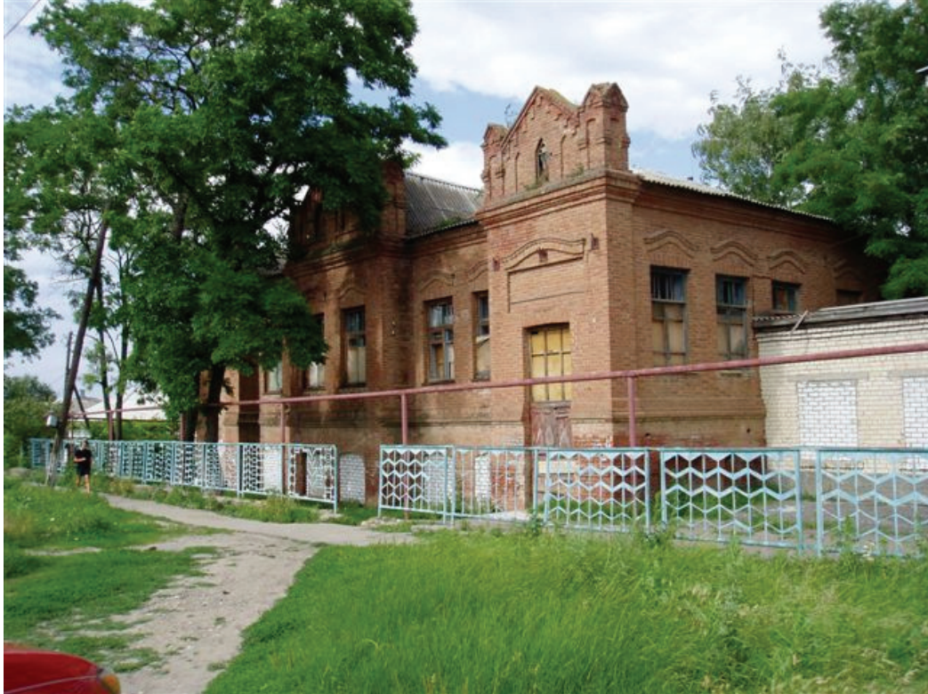
2008г. с. Александродар. Здание банка.

Интернет стр. архитектурного бюро Руди Фриезена: http://www.friesentokar.com/