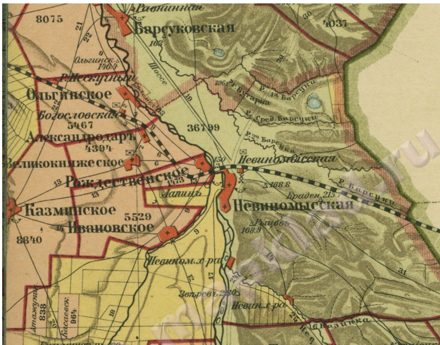
Район колонии «Кубань» на десятиверстовой карте Кубанской области 1902 г. составленной Иваненковым.