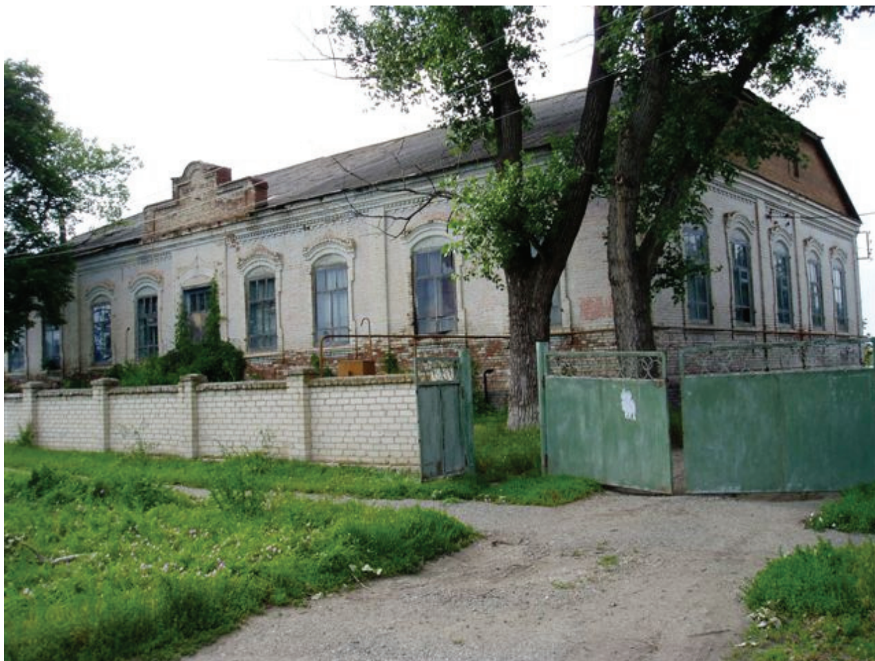
2008г. с. Великокняжеское. Здание школы.