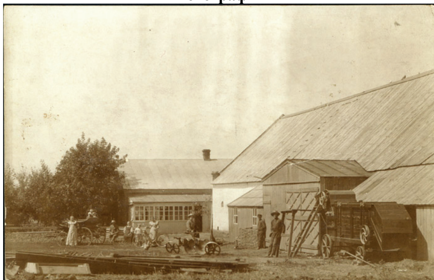
Дом (ферма) Генриха Унру в с. Великокняжеское