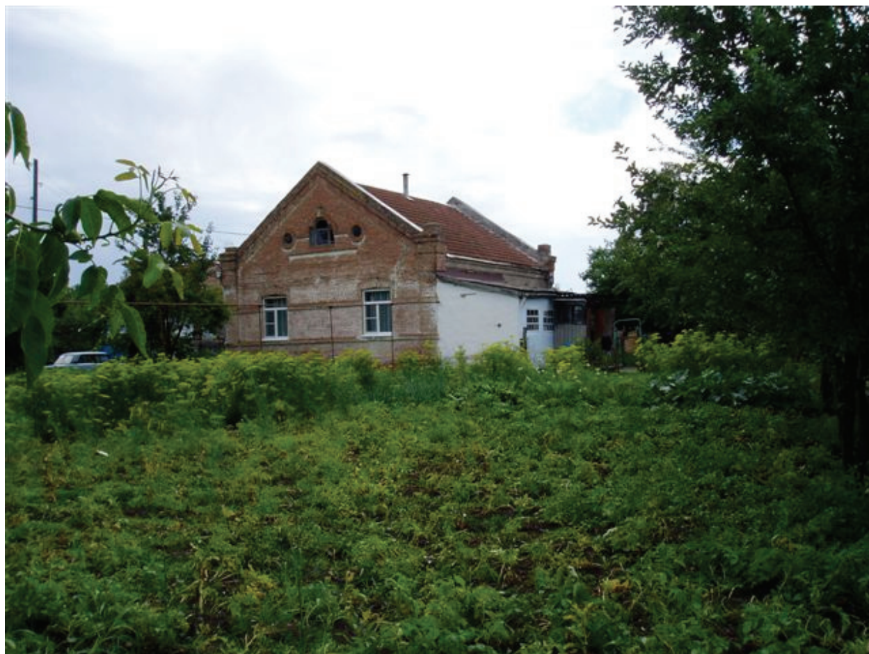
2008г. с. Великокняжеское. Дом построенный семьей менонитов в 1914 г.