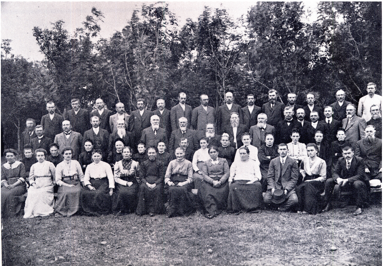
1914 г. с. Великокняжеское. Празднование 50-летия колонии. Старожилы села с женами.