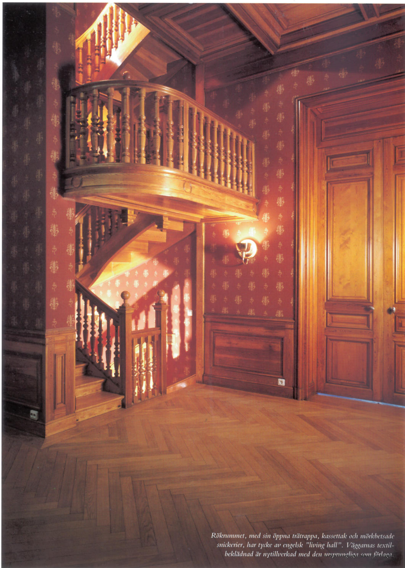
Rökrummet, med sin öppna trätrappa, kassettak och mörkbetsade snickerier, har tycke av engelsk "living hall". Väggarnas textilbeklädnad är nyttillverkad med den ursprungliga som förlaga.