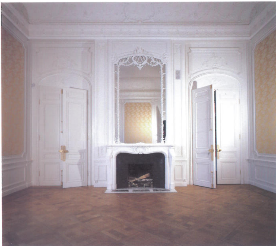
Del av salongen.

dåvarande Byggnadsstyrelsen bygga om det. Fastighetsverket övertog ansvaret för huset 1 oktober 1993 och har nu avslutat arbetena som projekterats av Tengbom arkitekter med Svante Tengbom som ansvarig arkitekt.