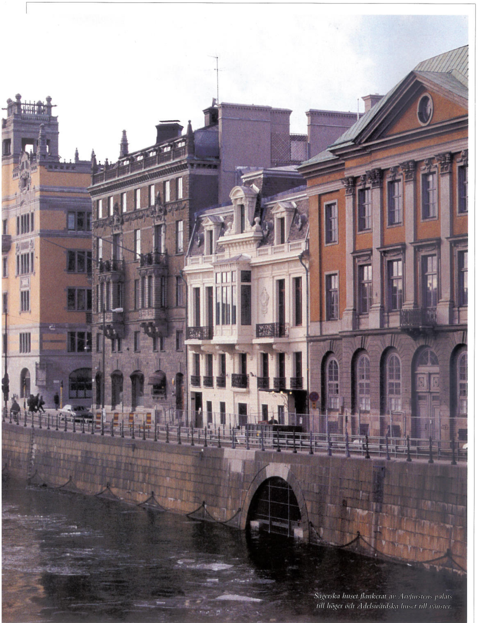
Sagerska huset flankerat av Arnfurstens palats till höger och Adelsvärdiska huset till vänster.