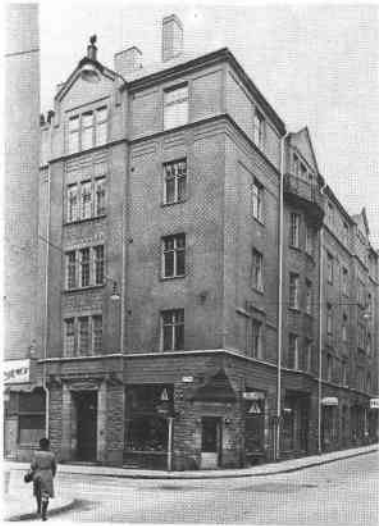
Björns Trädgård 4 Tjärhovsg 3