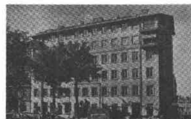
Fiskaren Större 10, 11 Mosebacketorg 6

Byggt 1890-1892, arkitekt Carl Malmström, byggherre och byggmästare Carl Blomdahl.