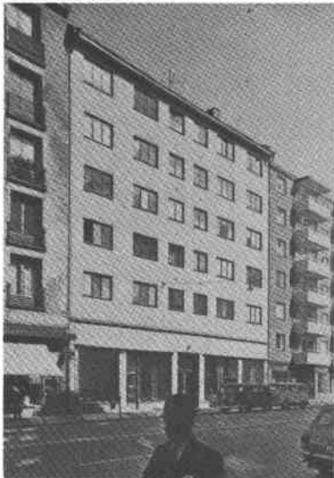
Droskhästen 12 Folkungag 67

Östgötagatan 31, Tjärhovsgatan 16 Bostadshus (5 vån + inredd vind) svart plåttak, putsfasad. Ursprungliga byggnadsdetaljer bevarade, bl a takmålning. Gården asfalterad. Byggt 1911-1918, arkitekt N C Runholm (ändr. av Sam Kjellbergs ritn), byggherre och byggmästare E V Lundin och därefter C J Lindberg.