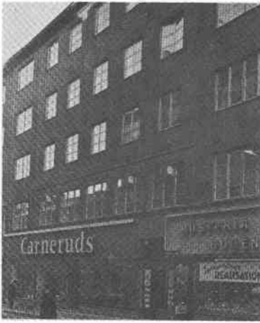
Fiskaren Större 3 Götg 21