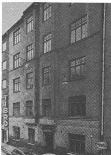
Droskhästen 6 Tjärhovsg 18

Den västra flygeln på- och tillbyggd senare.