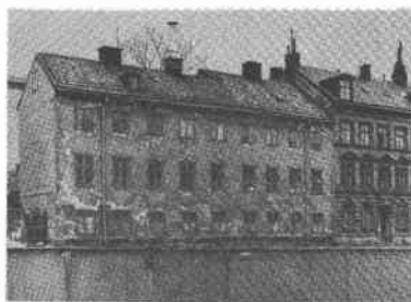
Dalsland 2 Söderg 12