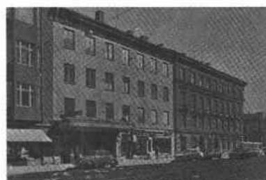
Buketten 2 Folkungag 105