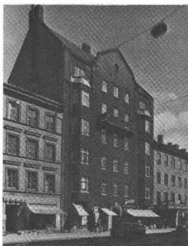
Buketten 3 Folkungag 103

Bostadshus Folkungagatan och Tjärhovsgatan (6 vån) tegeltak, mörka tegelfasader, bur- språk och bottenvåning Tjärhovsgatan putsade. Portgång och trapphus Folkungagatan i välbe- varad jugendstil. Taket tunnvalvt i portgång- en, marmorerade och pilasterindelade väggar. Ursprunglig hiss. Portgång och trapphus Tjärhovsgatan delvis omgjort på 1930-talet. Asfalterad gård.