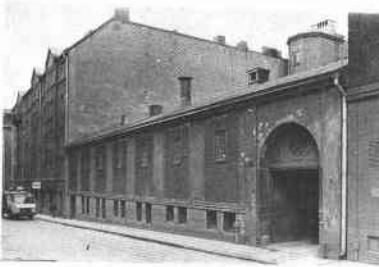
Björns Trädgård 3 Östgötag 16