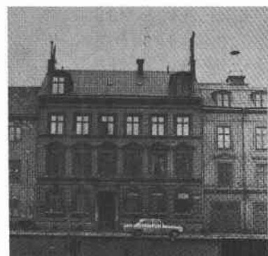
Dalsland 1 Söderg 10