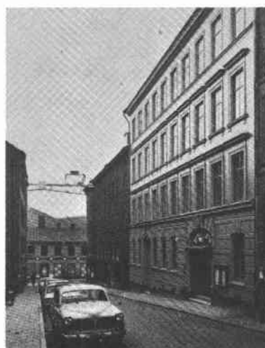
Fiskaren Större 21 Svartensg 3