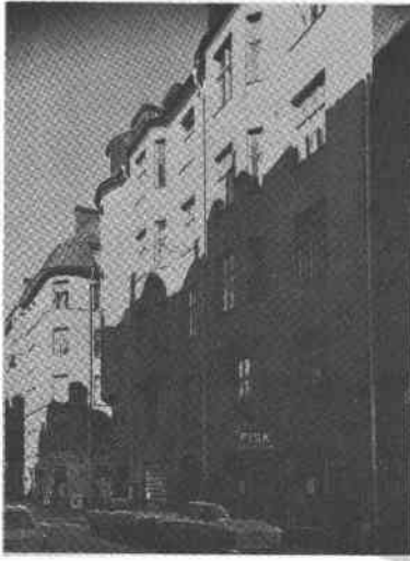
Droskhästen 9 Östgötag 31 Tjärhovsg 16