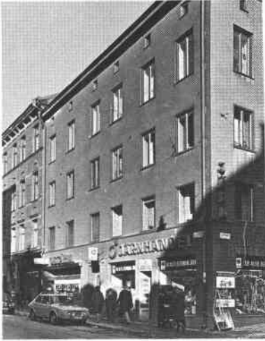
Fiskaren Större 1 Götg 25 Svartensg 1