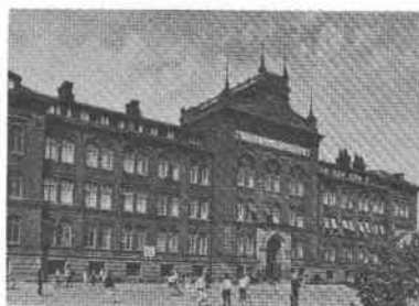
Dalsland 3 Stigbergsg 42

Den muromgivna gården är delvis kullerstensbelagd, delvis grusad. Den ursprungliga tomten sträckte sig till Ragvaldsgatan, en ny tomtindelning aktualiserades av nybyggnadsarbeten för Södra Latinläroverket. Enligt mantalslängden 1730 låg ett tvåvånings stenhus vid dåvarande Skaraborgsgatan (Södergatans övre del). Från mitten av 1700-talet verkade här snickarmästare, bl a ebenisten Carl Diedrik Fick från 1794. Denne lät påbygga och nyinreda huset. Våning 1 tr fick förnämlig inredning med bl a helboasering uppdelad i väggfält, skuren i nyklassicistiska motiv. Ombyggnad företogs 1853, vissa inredningsdetaljer är bevarade från denna tid. Husets 1700-talskaraktär dominerar dock, varvid speciellt märks den välbevarade boaseringen. Under 1920-talet användes fastigheten i viss omfattning som annex för skolan.