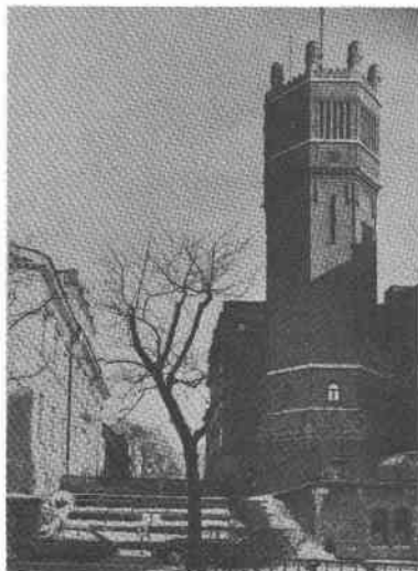
Fiskaren Mindre 16 Mosebacketorg 7