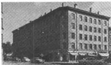
t.h. Buketten 5 Folkungag 99 Renstiernas Gata 15