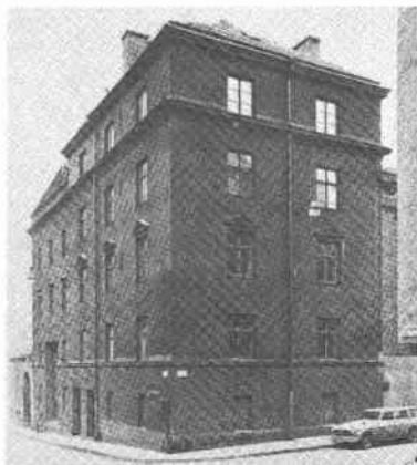
Stadsäga 7130 inom Björns Trädgård Kapellgr 14 Östgöttag 14

Stä 7130 invid kv Björns Trädgård Kapellgränd 14, Östgöttagatan 14 Elverket Katarinastationen (5 vån) maskinhall, ackumulatörtrum, transformatorhall, bostadslä- genheter. Utbyggnad av Katarinastationen skedde 1923-24. Ritn sign av Gustav de Frumerie. Tegel- tak, sprutbehandlad putsfasad.