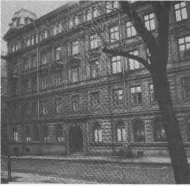
Fiskaren Större 18 Mosebacketorg 8