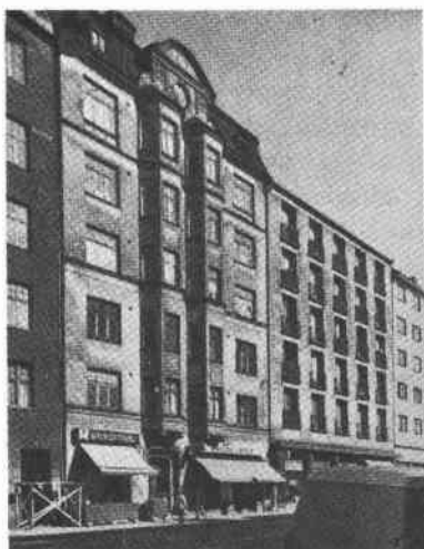
Droskhästen 7 Folkungag 63