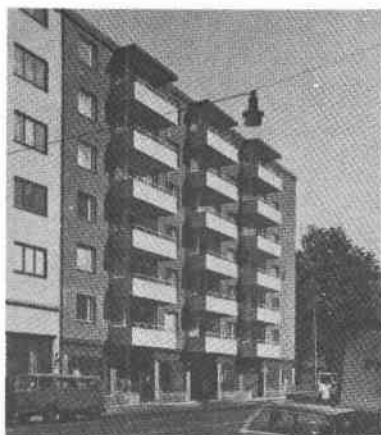
Droskhästen 14 Folkungag 69-71 Tjärhovsg 24