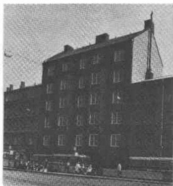
Buketten 3 Tjärhovsg 54