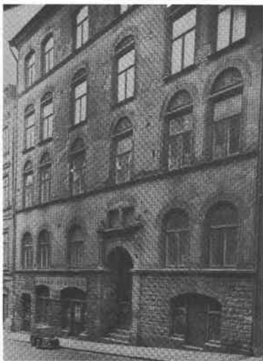
Fiskaren Större 19 Svartensg 7