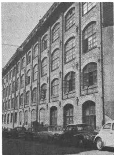
Fiskaren Mindre 14 Svartensg 21-25