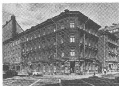
Buketten 1 Folkungag 107 Tjärhovsg 58 Borgmästarg 2

Stä 7130 invid kv Björns Trädgård Kapellgränd 14, Östgöttagatan 14 Elverket Katarinastationen (5 vån) maskinhall, ackumulatörtrum, transformatorhall, bostadslä- genheter. Utbyggnad av Katarinastationen skedde 1923-24. Ritn sign av Gustav de Frumerie. Tegel- tak, sprutbehandlad putsfasad.