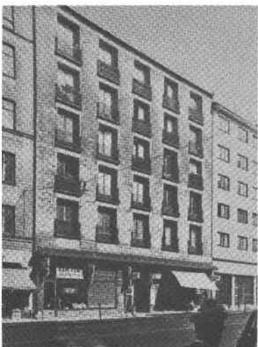
Droskhästen 13 Folkungag 65

Folkungagatan 67 Bostadshus (6 vån) svart plåttak, sprutbehandlad putsfasad. Gården stenlagd, träd- och blomplanterad. Byggt 1934, arkitekt J Asplund, byggherre Fastighetsföreningen Droskhästen, byggmästare J A Wester.