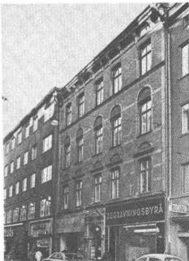
Fiskaren Större 2 Götg 23