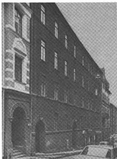
Fiskaren Större 7, 8 Hökens g 8 A, B