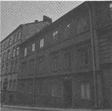
Fiskaren Större 18 Svartensg 9

Mosebacke Torg 8, Svartensgatan 9 Bostadshus. Gathus (5 vån mot Mosebacke Torg, 3 vån mot Svartensgatan) rött plåttak, spritbehandlad putsfasad. Gårdshus (4 vån) sten, gul spritputs. Mosebacke Torg: Kryssvälvd portgång med ursprungliga snickerier. Gården asfalterad. Svartensgatan: Enkel portgång. Mosebacke Torg: Uppfört 1882-1883, arkitekt C Widell, byggherre Bostadssällskapet N Tessin, byggmästare A M Andersson. 1963 fasadputsning. Svartensgatan: Enligt brandförsäkringshandlingar fanns ett tvåvånings stenhus + vind 1759. Detta påbyggdes 1862.