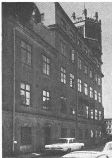
Fiskaren Mindre 14 Fiskarg 6