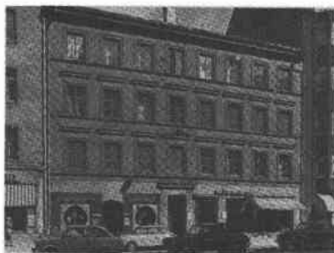
Buketten 4 Folkungag 101