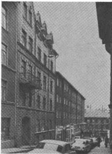
Fiskaren Större 6 Hökens g 6

Byggt 1928-1930, arkitekter J Herbert och A Sjöqvist, byggherre A Sjöqvist, byggmästare G Andersson.