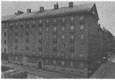
Björns Trädgård 5 Björns Trädgårdsgr 3 Tjärhovsg 1