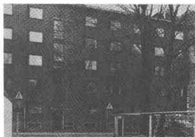
Droskhästen 17 Tjärhovsg 22

Folkungagatan 69-71, Tjärhovsgatan 24 Bostadshus (7 vån) Nybyggnad 1969-70, arkitekt Ernst Grönwall.