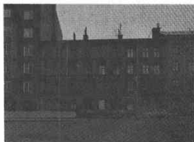
Buketten 7 Tjärhovsg 52

Byggt 1883, byggherre och byggmästare C G Tiderström. 1922 om- och påbyggnad. 1928 delvis ombyggnad och fasadändring.