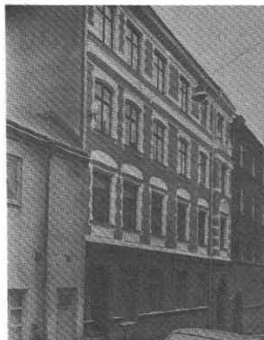
Fiskaren Större 9 Hökens g 10

Byggt 1904-1905, arkitekter Mauritz Pousette och Ivar Engström, byggherre N Nilsson, byggmästare Carl Molin.