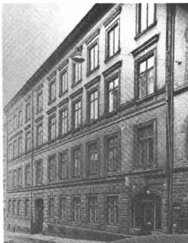
Fiskaren Större 20 Svartensg 5