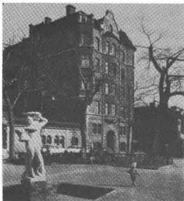
Fiskaren Mindre 15 Mosebacketorg 9 Svartensg 19