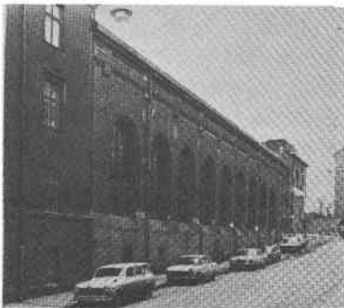
Stadsäga 7129, 7131 inom Björns Trädgård Kapellgr 14-10

Maskinhall för Elverket. Fastigheten av 1 vånings höjd och 9 fönsteraxlars bredd. Ny- byggnad 1902, arkitekt troligen Ferdinand Boberg. Enligt ritningen skulle huset upp- föras i 5 fönsteraxlars bredd. Tillbyggnad skedde 1918 av 2 fönsteraxlar och 1924 av ytterligare 2. Grått plåttak, tegelfasad.