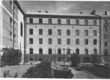
Björns Trädgård 3 Björns Trädgårdsgr 1

Östgötagatan 16, Björns Trädgårdsgränd 1 Televerket kontorsbyggnad och telestation. 5 vån mot Björns Trädgårdsgränd, koppartak, slammad fasad, 1 vån mot Östgötagatan, gråmålat plåttak, slät- och spritputsad fasad. Uppförda 1917-1918, arkitekt F O Lindström, byggmästare O Elgström.