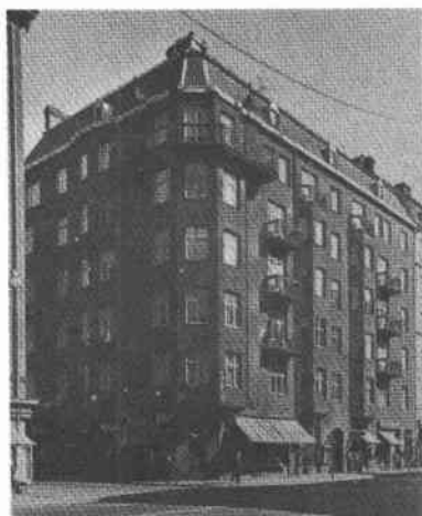
Droskhästen 8 Folkungag 61 Östgötag 33