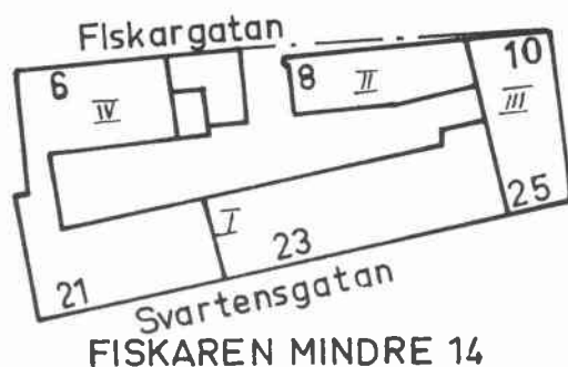
FISKAREN MINDRE 14