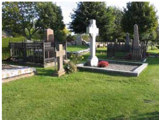
De äldre påkostade gravvårdarna i södra delen av kvarter D utgör en egen grupp i kvarteret. Längst bort i bild syns Israel Sven Wellins gravplats. (KI Högby kyrkog 028)

Den äldsta urngravvården är från 1959 men de flesta vårdarna är från 1980- och 90-talen. De är mindre än kistgravplatsernas vårdar och flera av vårdarna är liggande. Flera av gravvårdarna är av kalksten men det finns också vårdar av svart och grå granit samt enstaka av röd granit. Bland urngravvårdarna finns fyra vårdar av svartmålat smide och en gravplats omgärdad av buxbomshäck. Omkring några av kistgravplatserna finns omgärdningar kvar. Tre gravplatser omgärdas av gjutjärnsstaket, en av en stenram och kring ytterligare en finns rester av en stenram. Två av dessa omgärdade gravplatser är belagda med grus och en har öppen jord. Framför två av gravvårdarna finns en gravkulle överväxt med murgröna. Yrkestitlar är relativt vanliga och flest vårdar finns med titlarna kyrkoherde eller prost. Det finns också titlar som överstelöjtnant, landssekreterare och fil. jubeldoktor. På flera vårdar anges från vilken by eller gård den döde kommer, men det är ovanligare på urngravplatsernas vårdar och de allra äldsta vårdarna.