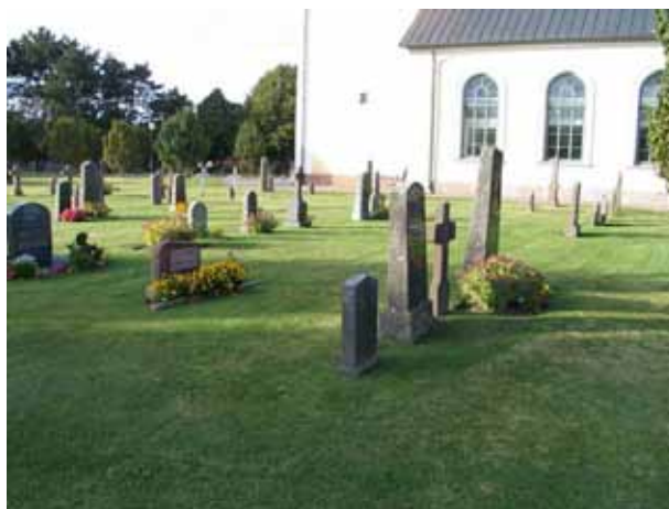
Kvarter G från sydost. (KI Högby kyrkog 042)