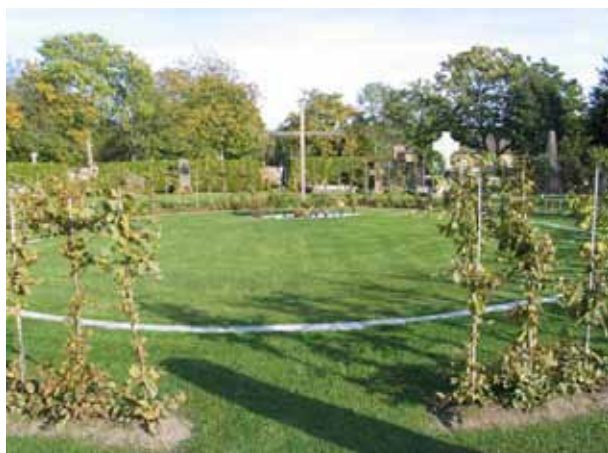
Minneslundan från väster. (KI Högby kyrkog 034)