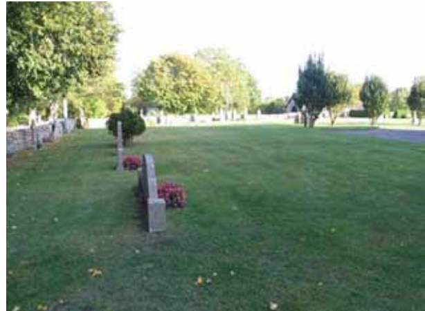
Kvarter C från väster. (KI Högby kyrkog 021)