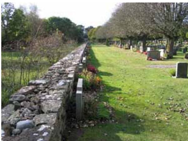
Kyrkogårdens mur i söder. Till höger i bilden syns en rad av oxlar. (KI Högby kyrkog 010)