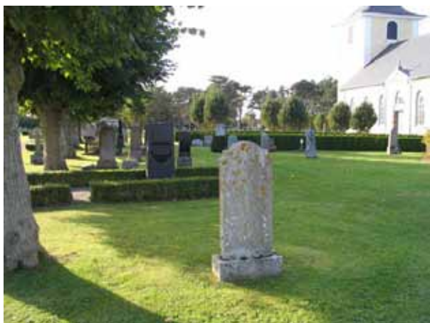
Kvarter E, och bortom det, kvarter F från öster. (KI Högby kyrkog 035)

mellan kvarter E och F. Här har häckar av tuja planterats och mot dem står gravvårdarna uppställda vända mot väster eller öster. I kvarter G, H, och K är majoriteten av vårdarna vända mot öster. Stora gräsytor som inte brukats för gravsättningar sedan en längre tid tillbaka finns i kvarter G och H. Här står äldre gravvårdar, som lämnats kvar, utspridda.