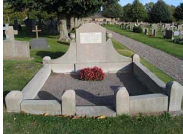
En av kyrkogårdens gravplatser som fortfarande har kvar sin omgärdning i form av en stenram och grusbeläggning är Gottfred Anderssons gravplats från 1930. Här ligger också hans syster Gerda Persson död 2001 begravd. Gravvården har en för 1930-talet typisk utformning men är mera påkostad än vanligt. (KI Högby kyrkog 039)