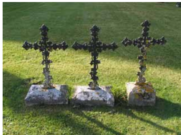
Tre små gjutjärnsvårdar står på rad i kvarter C. (KI Högby kyrkog 023)