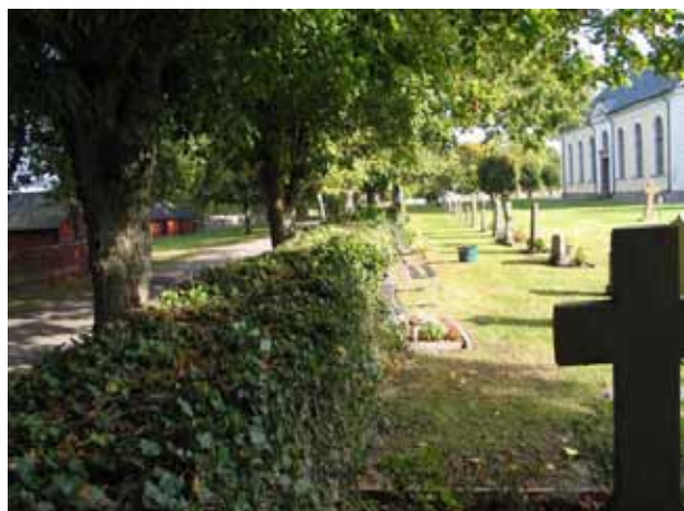
Kyrkogårdsmuren i norr. (KI Högby kyrkog 004)

På Högby kyrkogård blev dock inte svart granit så dominerande som på andra kyrkogårdar utan kalkstenen fortsatte att vara ett vanligt gravvårdsmaterial. Man tog dock till sig det nya formspråket som gravvårdarna fick vid den här tiden. Det fanns flera konstriktningar som inspirerade till vårdarnas utformning. En av dessa var nationalromantiken. Karaktäristiskt för gravvårdar som är nationalromantiskt inspirerade är oslipade ytor och asymmetriska krön. Tanken är att gravvården ska efterlikna förhistoriska gravmonument och runstenar. En annan viktig influens, som blev allt vanligare under början av 1900-talet, var antiken. Denna konststil kallas klassicismen. Typiska drag hos gravvårdar är symmetriska krön, slipade ytor och dekorelement som urnor, draperingar, kransar och girlanger av löv. När det gäller dekoren på gravvårdarna var den kristna symboliken naturligtvis också viktig. Vanliga kristna dekorelement var t.ex. kors, facklor, oljelampa och duva. På några av gravvårdarna på Högby kyrkogård från tiden omkring sekelskiftet 1900, kan man också ana närmast nygotiska drag. Mest framträdande för denna stil är de spetsbågiga formerna.