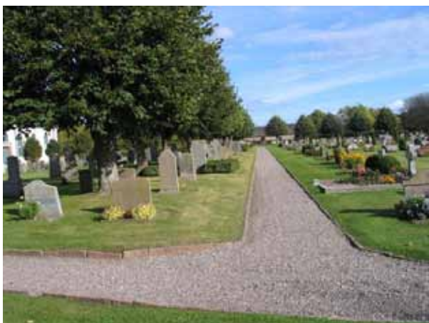
Gången mellan kvarter K och M som också är gränsen för den utvidgning som gjordes på 1920-talet. (KI Högby kyrkog 016)

På kyrkogården finns ingen uppställningsplats för äldre gravvårdar som tagits bort från kyrkogården. Istället står flera äldre gravvårdar kvar på kyrkogården. En del av de vårdar som har tagits bort förvaras idag i prästgårdsboden öster om kyrkan.