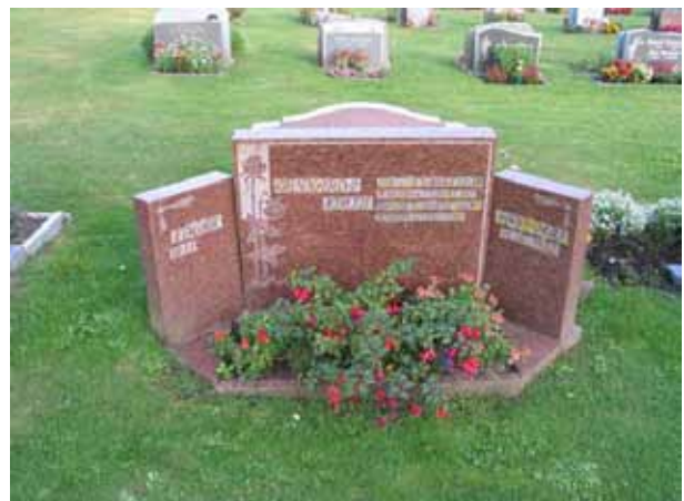
Gravvård i röd granit typisk för 1980-talet. De båda mindre stenarna vid sidan är senare tillägg och ger sammantaget gravvården en ovanlig utformning. (KI Högby kyrkog 053)