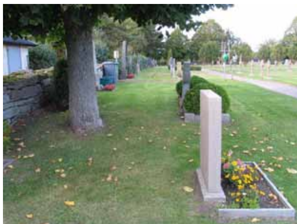
Kvarter J från söder. (KI Högby kyrkog 049)