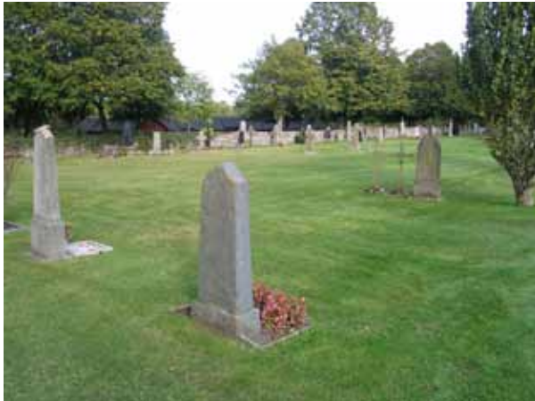
Kvarter A och B från väster. (KI Högby kyrkog 020)

Kvarter A-C utgör den norra delen av den gamla kyrkogården, norr om kyrkan. Utmed kyrkogårdsmuren från kyrkogårdens västra ingång till gränsen mot kvarter D, en idag insådd gång, finns två rader med gravvårdar. Söder om dessa finns en öppen gräsmatta med ett mindre antal äldre gravvårdar. Utmed kyrkogårdsmuren är gravvårdarna vända in mot kyrkogården och på det öppna området är alla vårdar vända mot öster.