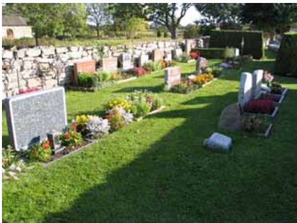
Urngravsområdet i kvarter D. (KI Högby kyrkog 026)