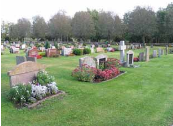
Kvarter M från nordväst. (KI Högby kyrkog 051)

Kvarteren L-R utgör den del av kyrkogården som tillkom på 1920-talet. I väster och öster ligger de långsmala kvarteren L och R. Emellan dessa båda kvarter finns två större ytor åtskilda av en grusgång kantad med höga tujor. Väster om gången ligger kvarteren M och N med gravplatser som rymmer två till fyra kistor. Öster om gången ligger Kvarteren O och P som rymmer gravplatser för två respektive en kista. Kvarter P utgörs till stora delar av ett linjegravsområde från 1920-talet. I samtliga kvarter är gravvårdarna placerade i rader vända mot öster eller väster. Runt kvarteren M-N och O-P är också gravplatser placerade och dessa gravvårdar är vända mot en gång. I södra delen av dessa båda områden är en rad med oxlar planterade. Samtliga kvarter har en låg och enhetlig karaktär. Ett undantag är dock de två rader med gravvårdar som kantar gången som delar kvarteren N och O. Utmed denna gång står gravvårdar i form av höga kors.