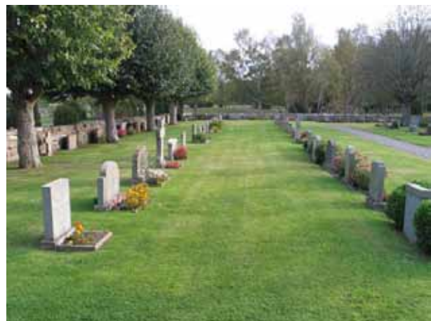
Kvarter R från norr. (KI Högby kyrkog 065)