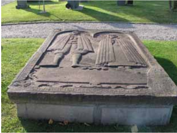
Mårten Vahti och hans hustrus gravtumba täckt av en vackert huggen kalkstenshäll med de döda porträtterade i helfigur. (KI Högby kyrkog 040)