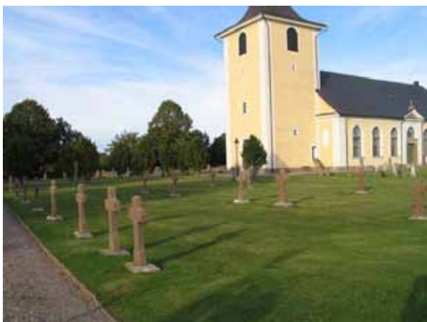
I kvarter H finns flera kalkstens kors från slutet av 1800-talet. Bilden är tagen från sydväst. (KI Högby kyrkog 048)