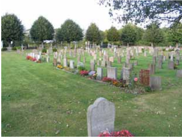
Gränsen mellan kvarter O och P från söder. (KI Högby kyrkog 060)