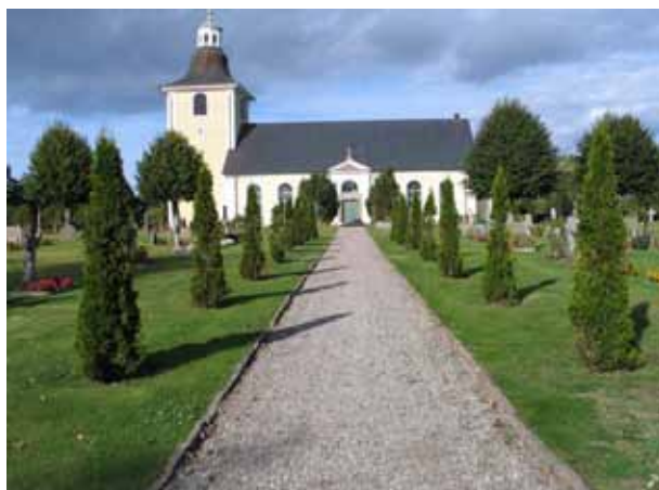
Gången fram till kyrkans södra ingång kantas av tujor. (KI Högby kyrkog 013)