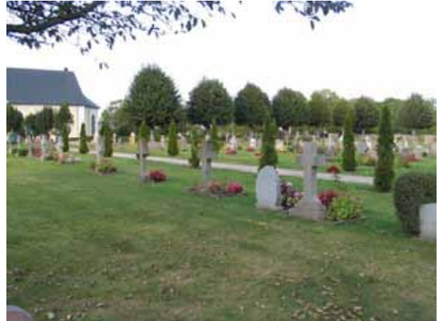
Utmed gången som skiljer kvarter N och O har gravplatserna gravvårdar i form av höga kors. (KI Högby kyrkog 056)