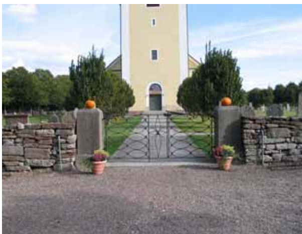
Kyrkogårdens ingång i väster. (KI Högby kyrkog 003)