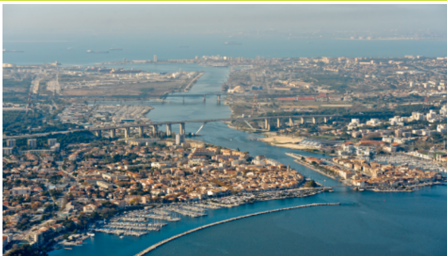
Martigues et le Viaduc de Caronte