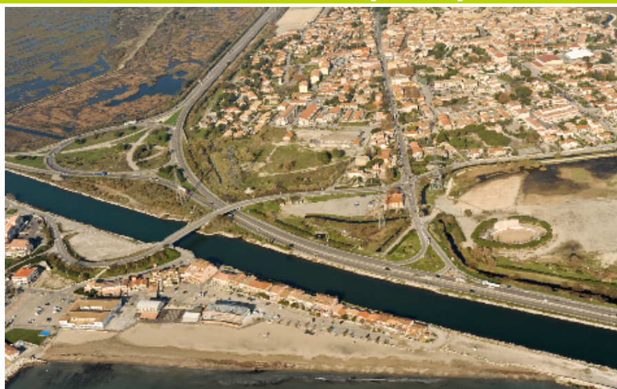
Carrefours St Gervais (à gauche) / Ma Campagne (à droite), commune de Fos-sur-Mer