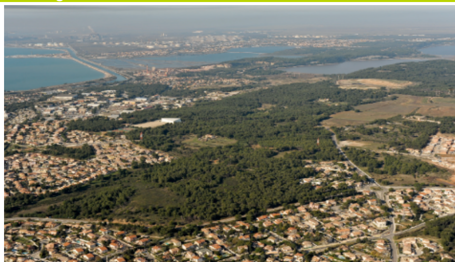
Port-de-Bouc — Crédits de l'image : studio Magellan ©