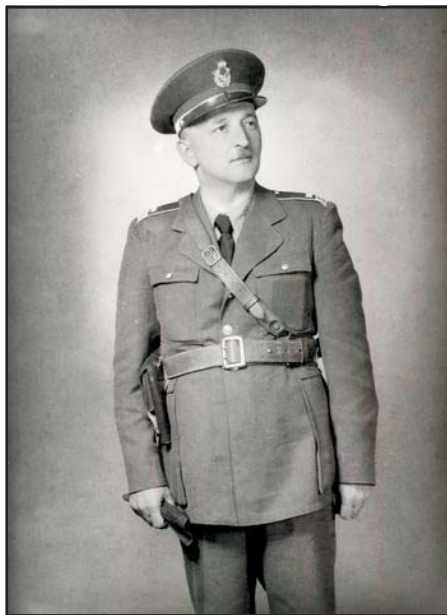
Reviczky Imre, 1940-es évek vége

Miért tették, amit tettek? Miért vállaltak kockázatokat? A történelmi családból való származás talán megkönnyítette számukra a nonkonformista viselkedést. Persze voltak a nagy történelmi családok sarjai között is jó páran, akik lelkesen meneteltek a nációkkal, de az arisztokraták általában – Magyarországon, Lengyelországban, Franciaországban, Olaszországban és Németországban egyaránt – jobban kiállták az emberség és a tisztesség próbáját, mint bármely más társadalmi csoport. Idegennyelv-tudásuk, ismeretségük más országokkal és kultúrákkal – és az európai nemesség „internacionáléjával” való kiterjedt kapcsolatrendszerük is – sokat nyomhatott a latban.