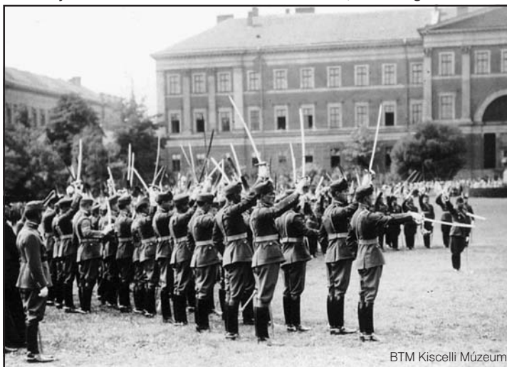
Új tisztek eskütétele a Ludovika Akadémián, 1930. augusztus

A háború utolsó hónapjaiban a nyilas hatóságok közel 50 ezer budapesti zsidót hajszoltak gyalogmenetben az osztrák határ felé, másokat a nyilas pártszolgálatosok gyilkoltak meg Budapesten, de nagy többségük, több mint százezren, életben maradtak részben Európa utolsó, hivatalosan felállított gettójában, részben semleges követségek kétes erejű védelme alatt, az úgynevezett nemzetközi gettóban, részben pedig keresztény barátaiknál bujkálva. A nyilasok akkor már nemcsak zsidókra, hanem nem zsidó „lógósokra és katonaszökevényekre” is vadásztak, így