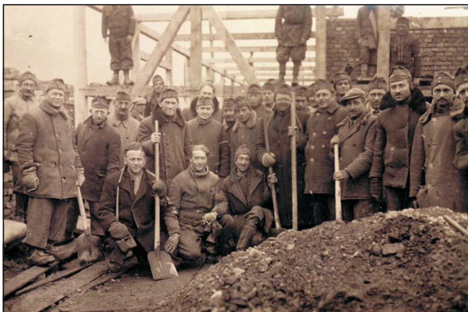
Munkaszolgálatos század és parancsnoka. Az első képen az előtérben álló zsidó kisfiú szüleit németek ölték meg és a keretlegénység bújtatta. • A második képen zsidó munkaszolgálatosok sódert termelnek ki. Lavocsne, 1943

közülük – kikeresztelkedettek és zsidó vallásúak egyaránt – a tábornoki, illetve tengernagyi rangig vitték. Márpedig nem volt tiszteletreméltóbb és kiváltságosabb foglalkozás a Monarchiában, mint a katonatiszté.