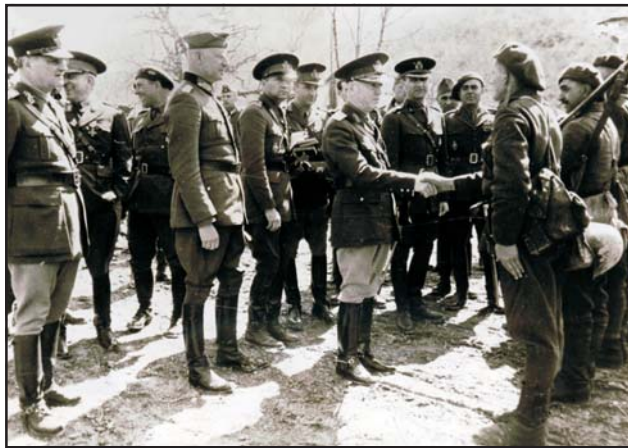
Antonescu marsall látogatása a fronton, 1942

A nemzeti kormányok Hitler Európájában – kevés kivétellel – nem feltétel nélkül németbarát és radikálisan antiszemita elemekből álltak, hanem konzervatív nacionalistákból , akik országuk és társadalmi osztályuk érdekeit tartották szem előtt. Maguk a németek is szívesebben működtek együtt a konzervatív katonai vezetőkkel – Pétain marsallal, Antonescu marsallal, Horthy admirálissal vagy a