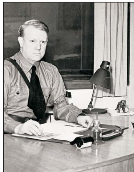
Vidkun Quisling, norvég fasiszta vezető

A kollaboráció és az ellenállás határai meglehetősen elmosódtak Hitler Európájában. A németek által megszállt és közvetlen kormányzásuk alatt álló országokban – Lengyelországban, a balti államokban és a németek fennhatósága alá tartozó orosz területeken – az ellenállóknak a teljhatalmú német megszállók ellen kellett küzdeniük, akiket a helyi kollaboránsok és az országban élő ellenséges magatartást tanúsító etnikumok is segítettek. A