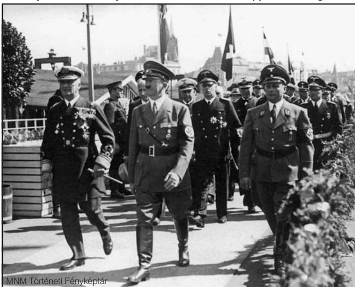
MNM Történelmi Fényképtár