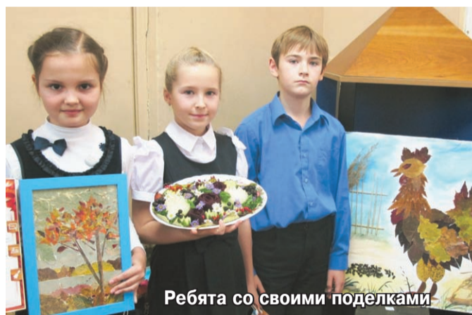
Ребята со своими поделками

Конкурс детских поделок прошёл в начальной школе-детском саду № 30.