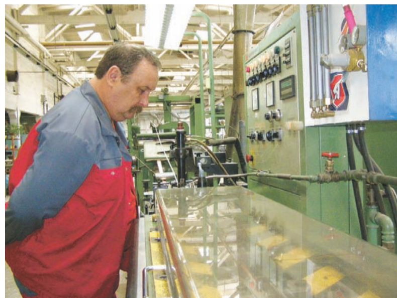
Производство предприятия по-прежнему востребована