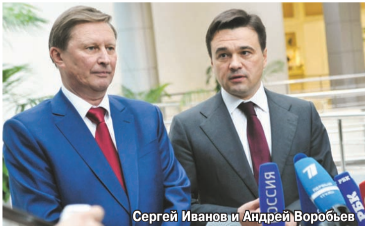
Сергей Иванов и Андрей Воробьев

Назначенный Указом Президента Российской Федерации исполняющим обязанности губернатора Московской области Андрей ВОРОБЬЕВ обозначил основные аспекты своей будущей деятельности. Как подчеркнул новый глава Подмосковья, главным итогом работы должно стать повышение качества жизни населения региона.