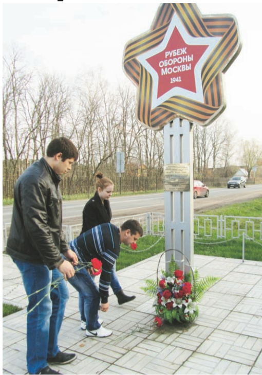
У рубежа Славы

Автопробег, посвящённый 71-й годовщине исторической битвы под Москвой, стартовал в Марфине. В нём приняли участие представители поисковых отрядов сельского поселения Федоскинское, мытищинского «Исток», а также ветераны-афганцы Всероссийской организации «Боевое братство».