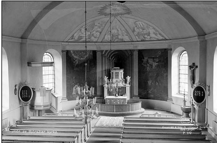
Björsäters kyrka 1956