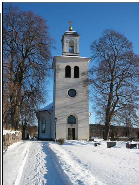
Björsäters kyrka 1949 och 2004.

Björsäters nuvarande kyrka uppfördes 1799-1801 efter ritningar av stiftsbyggmästaren Casper Seurling (1757-1808) med hjälp av brodern och byggmästaren Johan Seurling. Den är byggd av gråsten och tegel med vitputsade fasader och plåttäckt valmat tak. Planen är strikt symmetrisk såväl exteriört som interiört. Långhuset har elipsens form och tornet ansluter som en kvadrat i väster och sakristian i öster. Ingångar finns i väster genom tornet och centralt på långhusets södra vägg. Kyrkorummet får en speciell karaktär och ljusföring genom långhusets ovanliga planform. Koret domineras av Pehr Hörbergs stora målningar föreställande Kristi födelse och Kristi korsfästelse inkomponerade i en större målningssvit med skenarkitektur och grisaillemålningar, d v s målningar utförda i gråskalan. Målningarna är utförda med oljefärg direkt på putsen. Målaren, tecknaren, grafikern och skulptören Pehr Hörberg (1746-1816) var sin tids mest anlitade kyrkomålare. Han har målat 87 altartavlor varav 57 i Östergötland. Altarpredikstolen är tillverkad 1709 av bildhuggaren Gabriel Beutin. Den överfördes från den gamla kyrkan och komponerades om för att passa in i den nya kyrkans nyklassicistiska stil. Anordning med predikstol över altaret utfördes ofta av Seurling, som t ex i den samtidigt uppförda S:t Lars kyrka i Linköping. Predikstolen pryds av säteriet Ekhults ägares vapen,