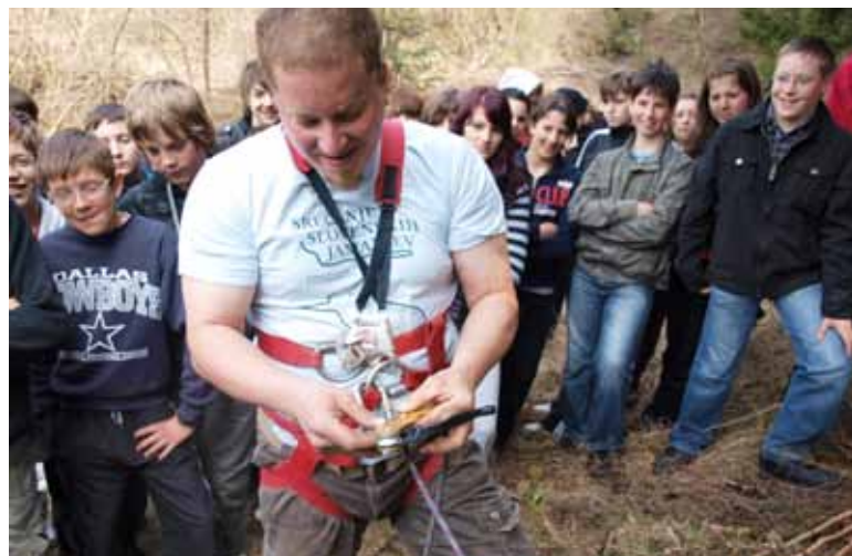
Ekodan z jamarji