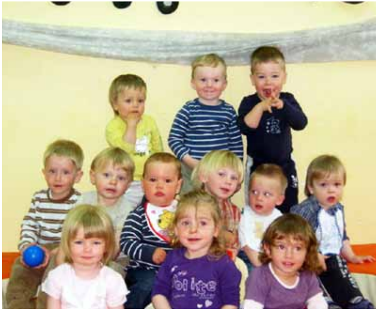
Skupina Pikapolonice, najmlajši otroci vrtca Nova vas.

Pisalo se je leto 2000, ko je enota vrtca prišla pod streho OŠ Tone- ta Šraja Aljoše. V vrtcu je bilo 19 otrok v eni kombinirani skupi- ni od starosti dveh let pa do vs- topa v šolo. Tudi prostorski pogo- ji so omogočali varstvo le eni skupini otrok. Zaradi večjega povpraševanja po varstvu smo junija leta 2004 odprli nov pren- ovljen vrtec. Takrat sem zapisala: »Odpiramo vrata lepega, svetle- ga, prostornega vrtca, ki bo nudil vzgojo in varstvo 38 otrokom«.