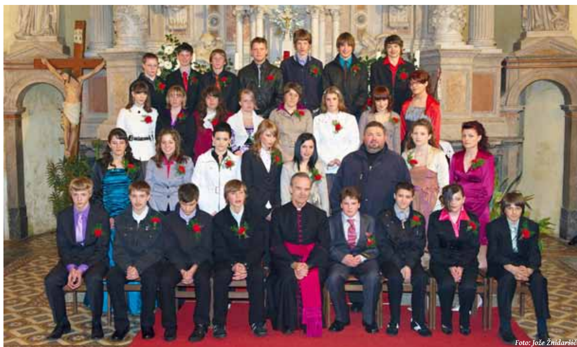
Birmanci v Novi vasi