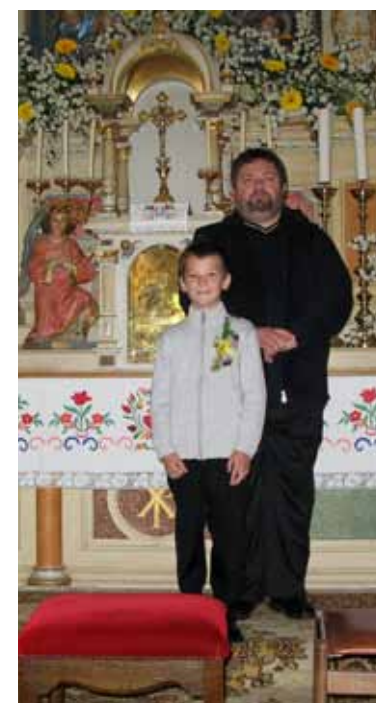
Prvoobhajanec pri Sv. trojici