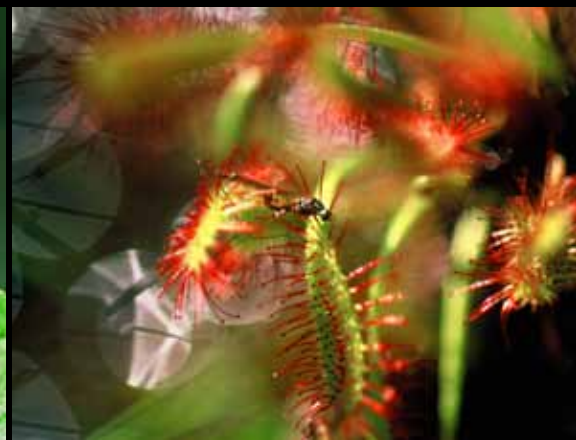
Dolgolistna rosika – Drosera anglica

sušilo rosna krilca na prvem soncu, s kakšno vabljivo pretvezo je mesojeda rosika z vabljala zaletave mušice in radovedne veččice v svoje lepljive čašice, kako bahavo so se postavljale barvite kukavice po obpotočnih travnikih, kako vesoljno so odmevali žabji zbori ... Z vseh strani pa je neizčrpen repertoar ptičjega petja dajal vtis, da ra-