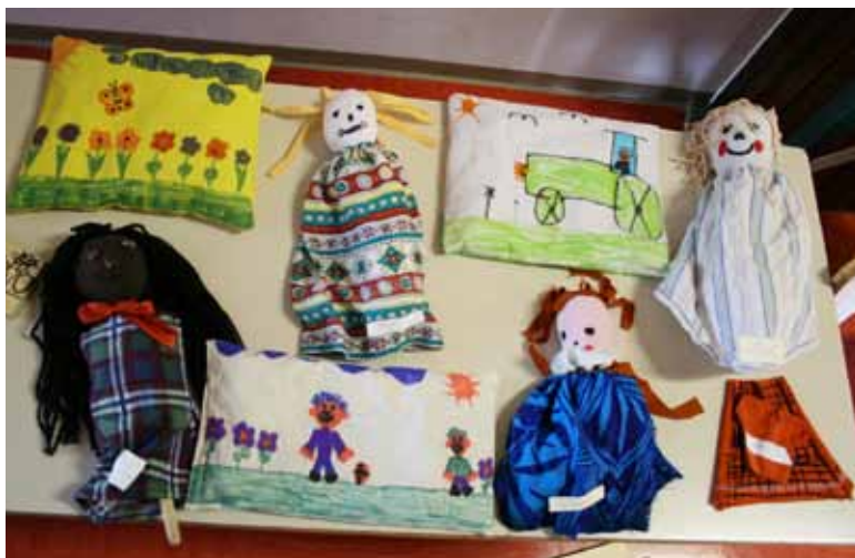
Razstava ob zaključku ekobralne značke