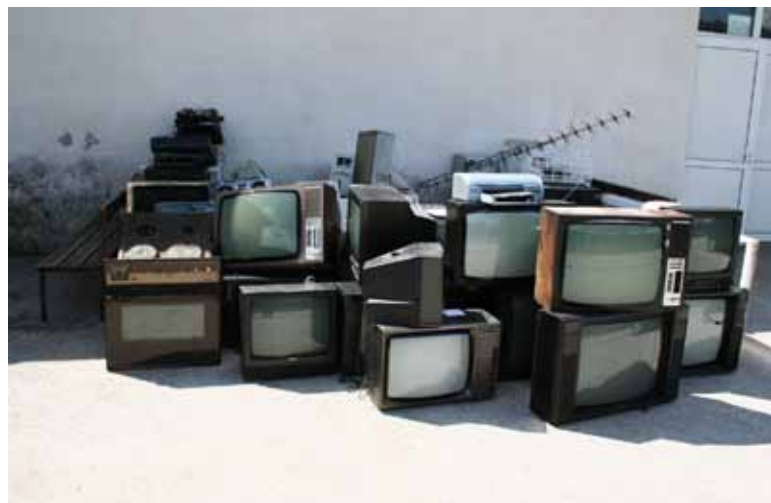
Akcija zbiranja odsluženih električnih aparatov in elektronskih odpadkov