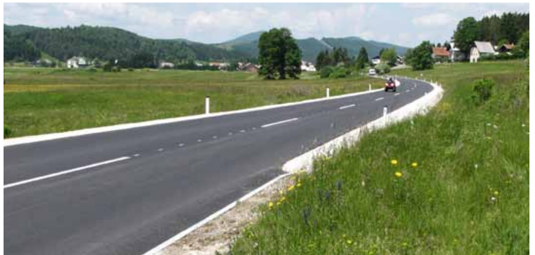
Glavna cesta na Blokah