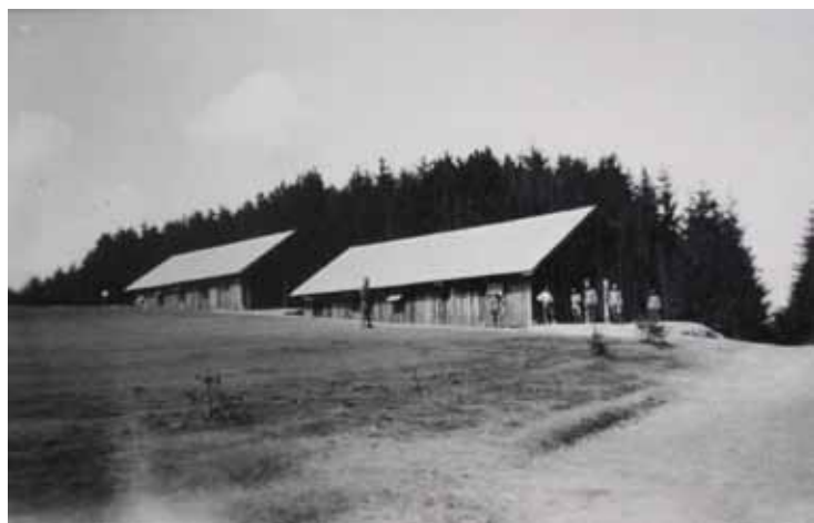
Vojaški hlevi za konje na Volčjansken hribu.