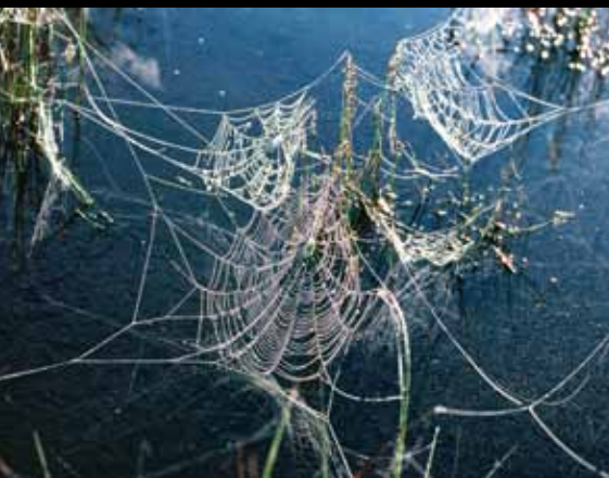
Pajčevine nad Bloščico