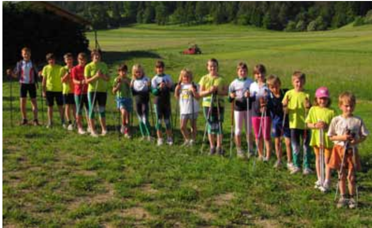
Del tekmovalne ekipe slikan pred letnim treningom. Med njimi nekaj mlajših, ki so se nam pridružili pred kratkim.

V društvu iščemo nove oblike delovanja in se poskušamo prilagoditi težjim razmeram, povezanih z gospodarsko krizo. Denarja za delovanje je vse manj