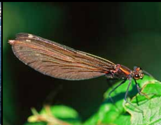
Samička modrega bleščavca – Calopteryx virgo