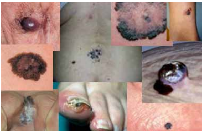
Pigmentni kožni rak (obarvane lise in bulice)