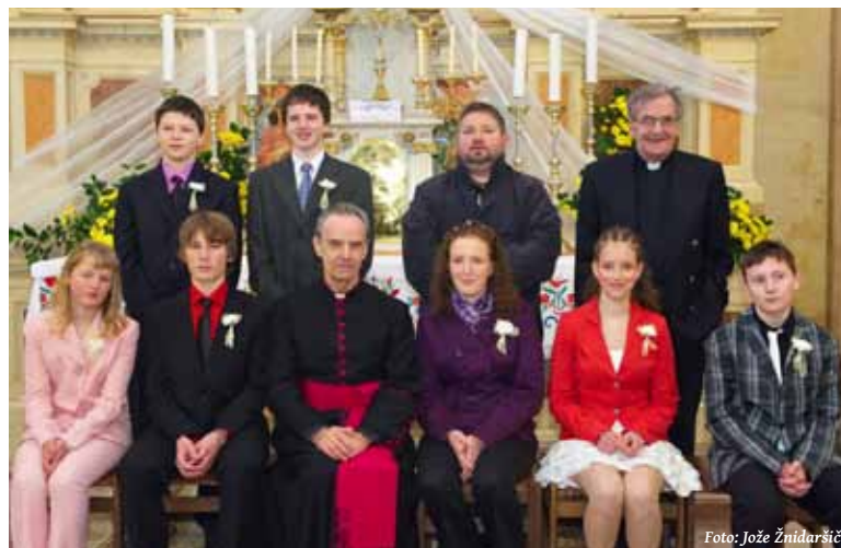
Birmanci pri Sv. trojici