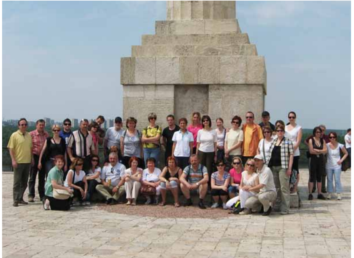
Na Kalemegdanu smo se slikali za Bloški korak.