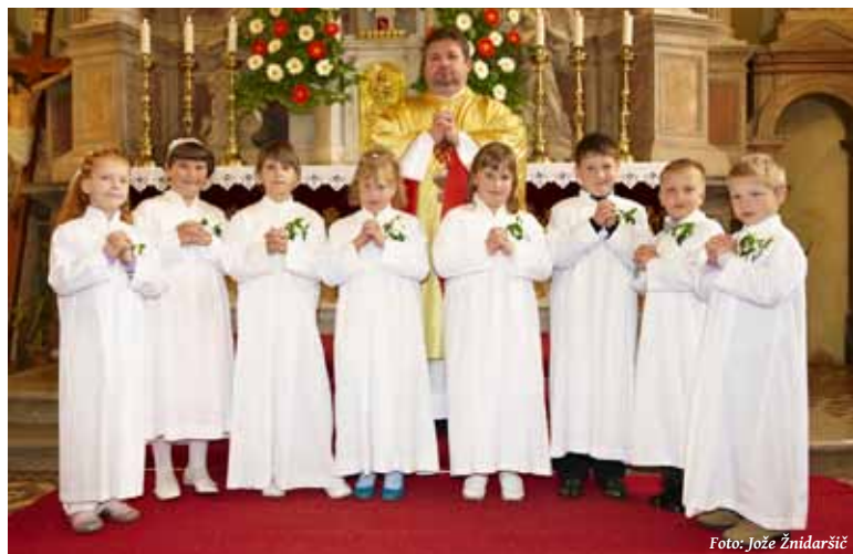
Prvoobhajanci v Novi vasi

PODELITEV PRVEGA SVETEGA OBHAJILA JE VSAKO LETO PRAZNOVANJE ZA FARNO OBČESTVO. LETOS PA JE BILA NA BLOKAH TUDI SV. BIRMA. PRILIKA ZA KAR DVOJNO SLAVJE.