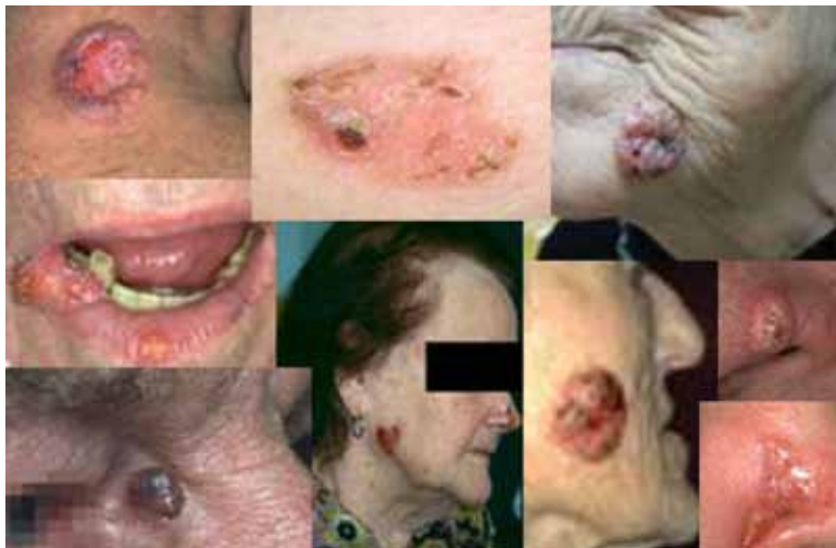
Navadni kožni rak (krastava žarišča, bulice, zatrdline, rane, ki se ne celijo)