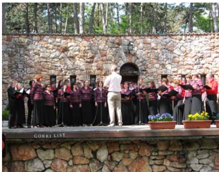
Palič – maraton folklornih in pevskih skupin

li po Vojvodini, sredi neskončno dolgih in širokih polj. Cesta je bila ravna, po površini pa približno taka kot naša proti Velikim Blokam. Nenadoma se je vzporedno z avtobusom nekaj pokadilo in glej ga zlomka, že je mimo nas prihrumel dobri stari yugo, lepo rjav, s počeno izpušno cevjo. In takoj za njim še 101-ka, pa potem ena 126-ka pa ... ojej ... fičko! Moj fotoaparati je kar škljocal, saj takih avtov pri nas skorajda ne vidiš več! Najbrž imajo danes na Paliču tudi srečanje starodobnih avtomobilov, sem si mislila sama pri sebi. Pa so me nekateri sopotniki, ki potujejo večkrat po naših bivših bratskih republikah, kmalu postavili na realna tla. Medtem ko se je naša država kar lepo razvijala, je gospodarstvo v Srbiji in še posebno v Vojvodini popolnoma obstalo. Za vsaj 20 let! Človek težko dojame, da je ob tako rodovitni zemlji, kot je v Vojvodini, kjer zraste in obrodi vse, kar vanjo vsadiš, vse tako zaostalo.