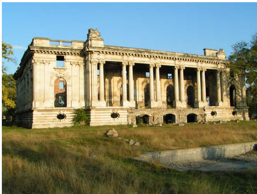
Florești. Palatul Cantacuzino