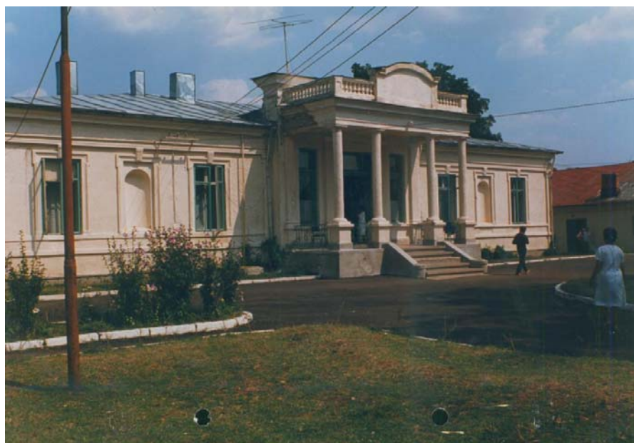
Călinești. Conacul Mavros Cantacuzino