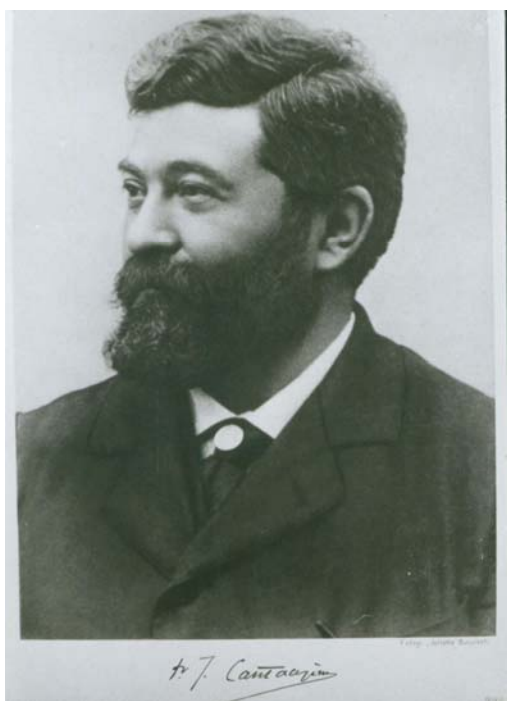
Călinești. Dr. Ioan Cantacuzino