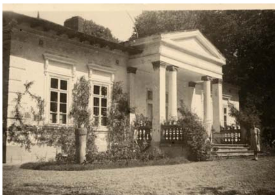
Văcărești. Conacul Văcărescu