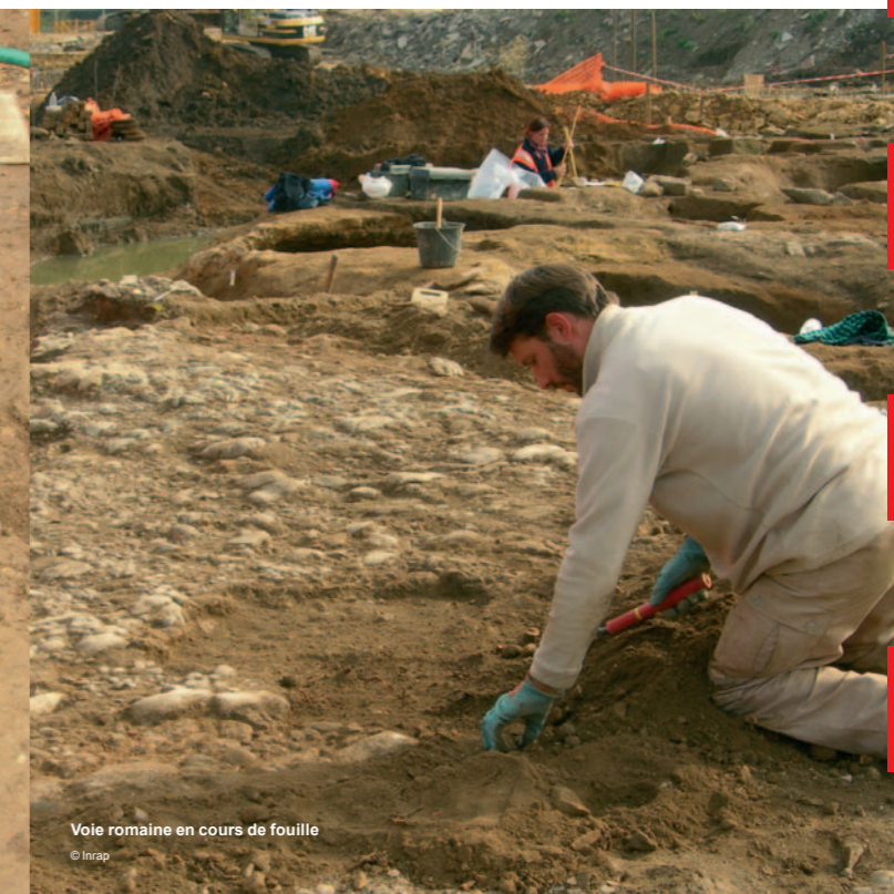
Voie romaine en cours de fouille