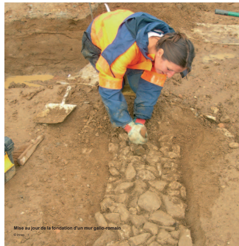
Mise au jour de la fondation d'un mur gallo-romain