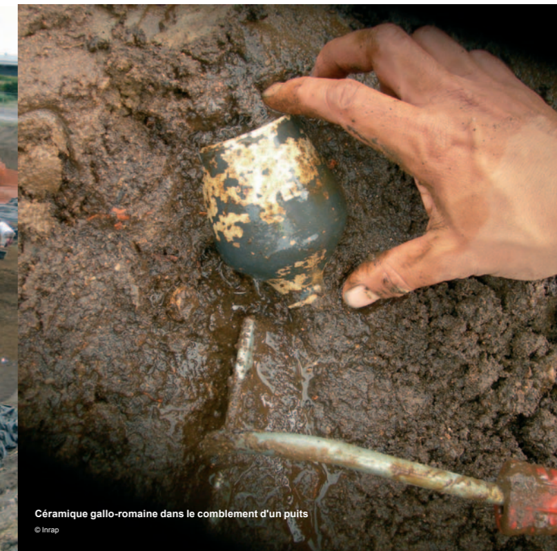
Céramique gallo-romaine dans le comblement d'un puits