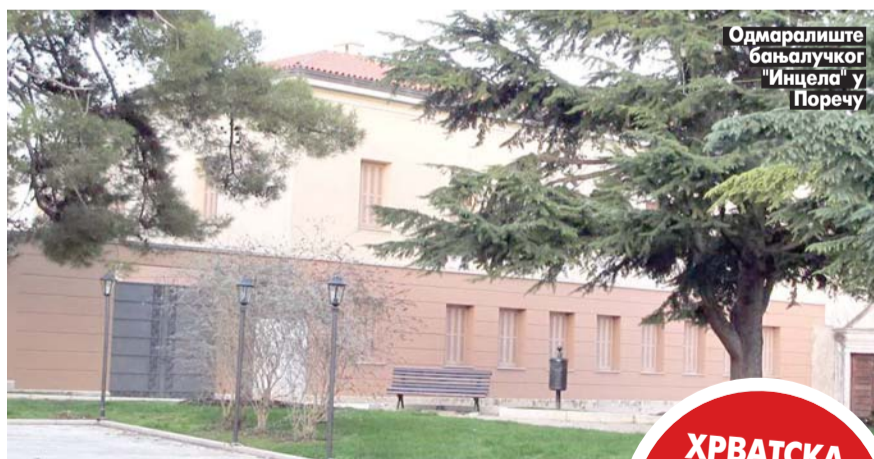
Одмаралиште бањалучког "Инцела" у Поречу

Тужилаштва и судови воде поступке у вези са НЕКРЕТНИНАМА РС У ХРВАТСКОЈ