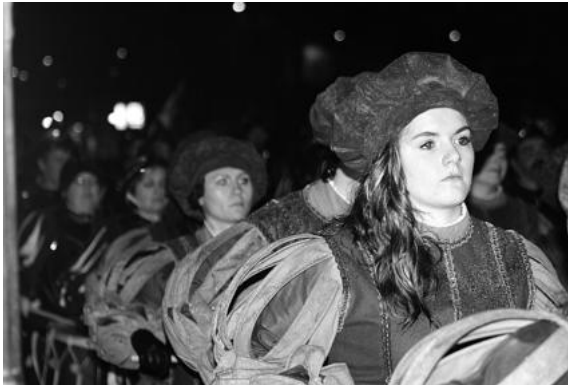
Azpeitian emakumeak danborra jotzen, sansebastianetan. HITZA

Hala ere, horrelakoek beti ematen dute aukera kritikatzeko, gizartearen alde ilunak ateratzeko,