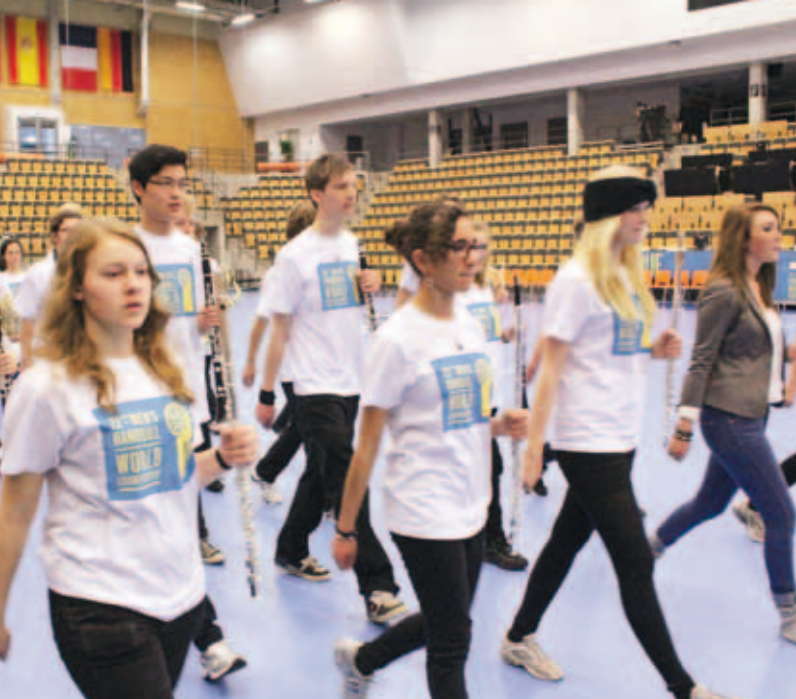
... och marsch!