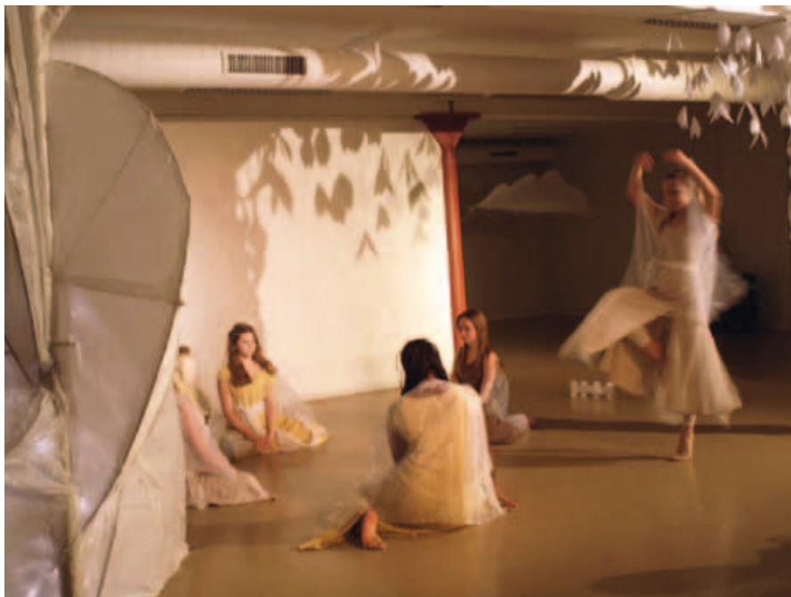
Ålvdans.