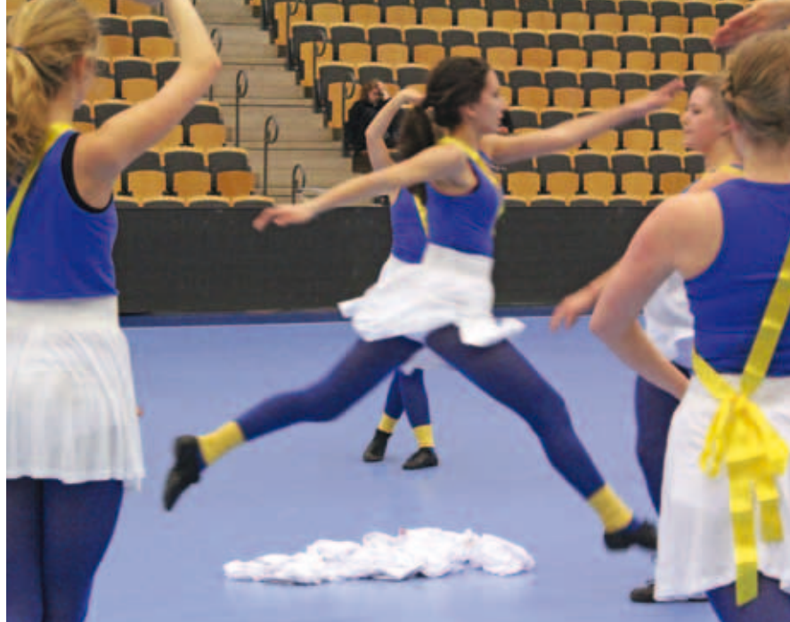
Jazz- och showdansgruppen från Kulturskolan hade övat på sitt nummer sedan strax innan jul. För dem var det en annorlunda upplevelse att dansa till levande musik.

Frosta sparbank arena, såg en möjlighet att förena de båda i samband med handbolls-VM. Det var han som kontaktade Kulturskolan för ett år sedan ungefär och frågade om de ville spela under mästerskapets matcher i Lund.