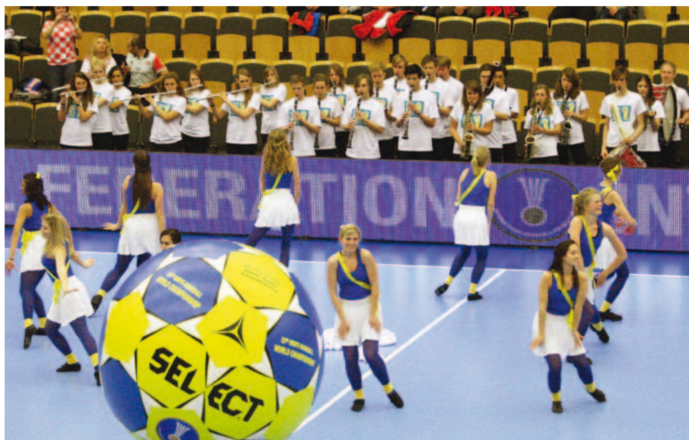
Här är det på riktigt. Lördagen den 22 januari när det var paus i matchen mellan Kroatien och Argentina intog dansarna planen i alla fall. Lund Symphonic Band fick stå vid sidan av på grund av internationella säkerhetsbestämmelser.