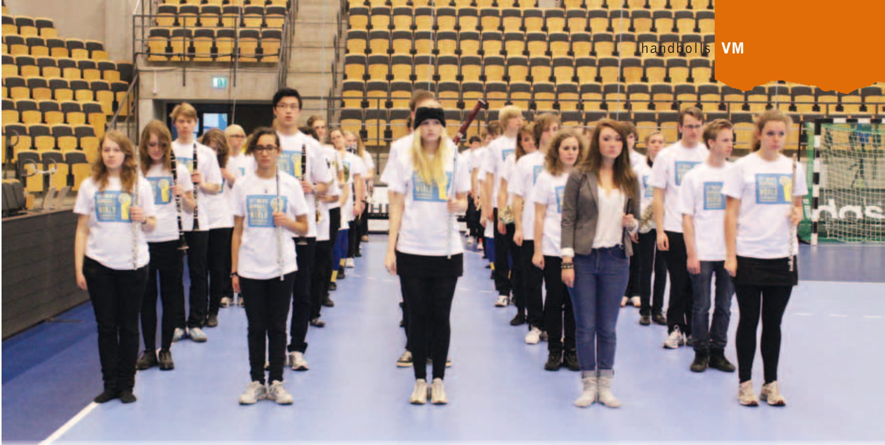
Uppställning för marsch inne på planen i Arenan.