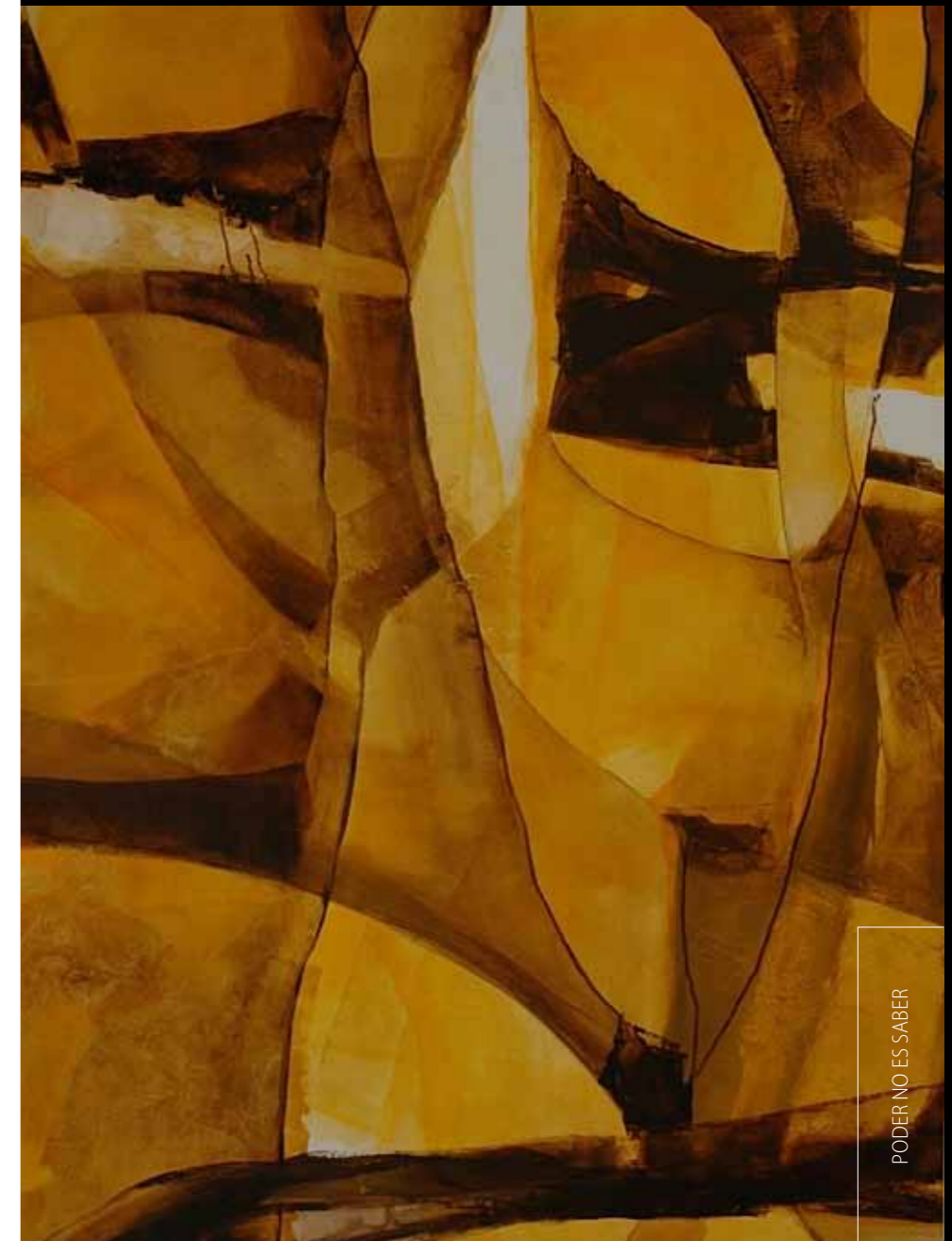
PODER NO ES SABER

"Sueños, símbolos e imágenes, atraviesan el día: un desorden de mundos imaginarios confluyen sin cesar en el mundo..." Jorge Luis Borges