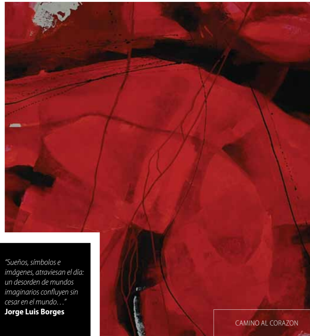
CAMINO AL CORAZON