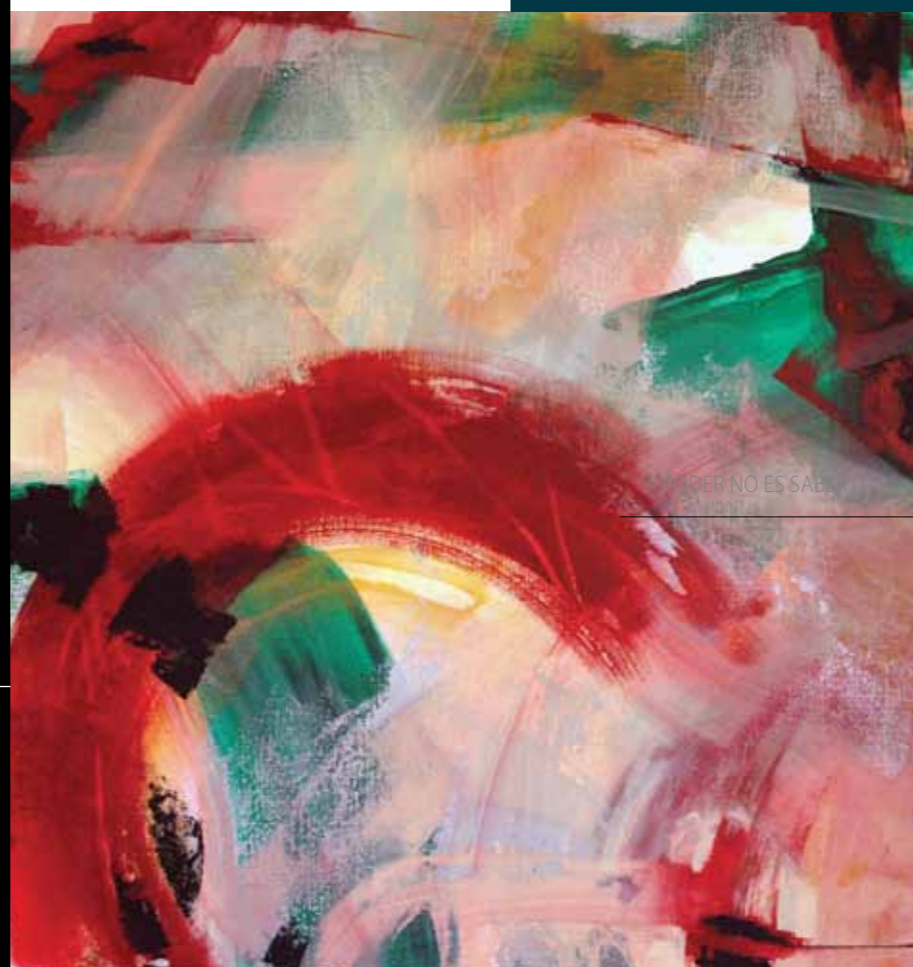
LA FIESTA NO ES SABEL