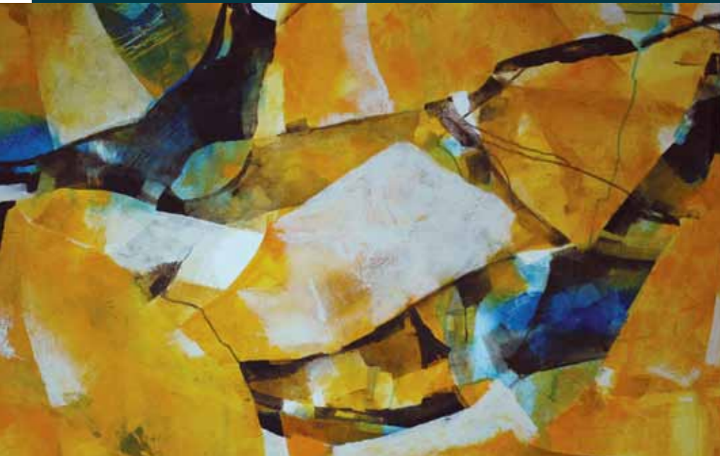
LA JORNADA LABORIOSA