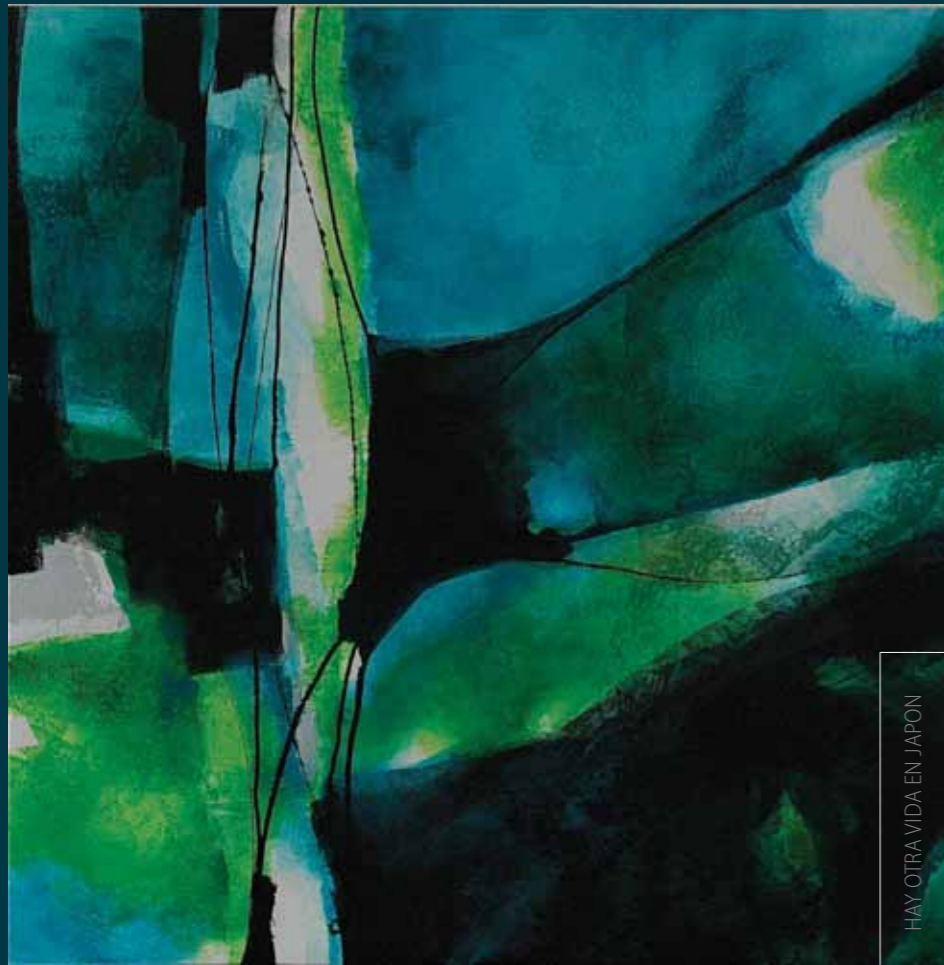
HAY OTRA VIDA EN JAPON