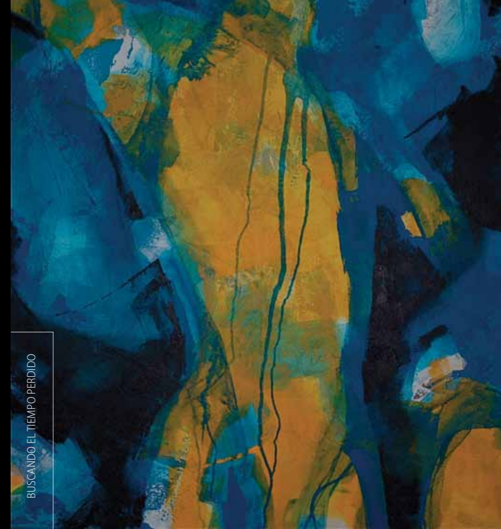
BUSCANDO EL TIEMPO PERDIDO