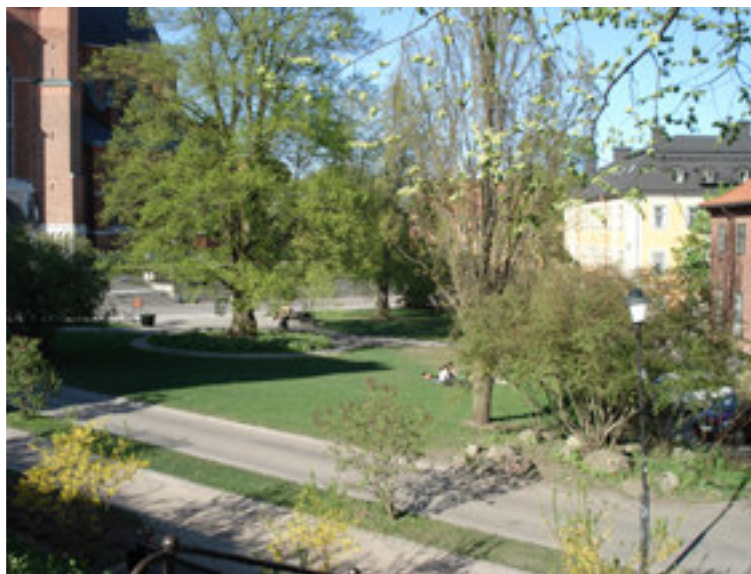
Fig. 8. På bilden ser vi Riddartorget som idag är en park.

Sedan mitten av 1700-talet kallats det Riddartorget och man tror att det är efter räntmästaren Peter Julinsköld som lät uppföra Dekanhuset som privatbostad under 1740-talet. 59 Enligt bild från 1760-talet kan man se att torget var en öppen yta med vägar längs kanterna. År 1868 är platsen torg på kartan och 1880 är det park så under åren där emellan har funktionen ändrats.