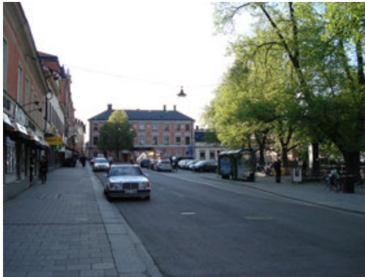
Fig. 6. Fyristorg domineras av vägen, men har en del grönska med träden längs ån.

1954 anlags bilparkering på torget som i början var avstängd på handelsdagar, men på 1990-talet parkerades det där även på handelsdagar. Hälften av parkeringarna togs bort 1999 och idag får man bedriva handel på de delar som inte är parkering. 43