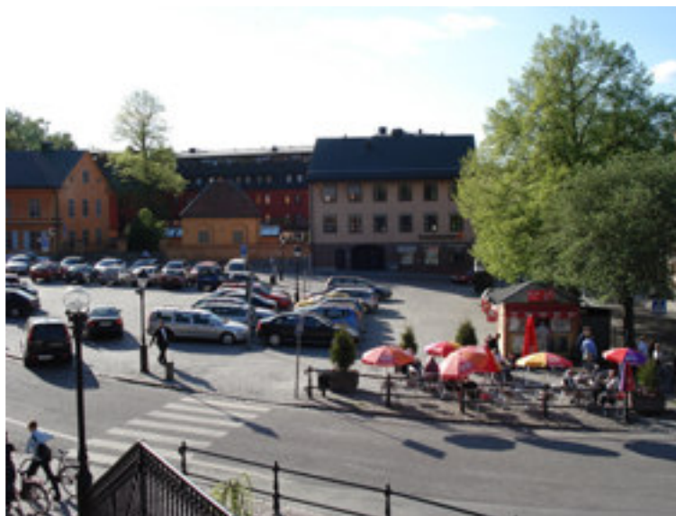
Fig. 7. På bilden ser vi dagens S:t Eriks torg som idag är en bilparkering med några träd.

Enligt foto från 1902 kan man se nyplanterade träd och dessa kan vara de som står där idag. Vid början av 1900-talet var det fortfarande handel på hela torget, man sålde alla slags matvaror fram tills Saluhallen byggdes år 1909. 53