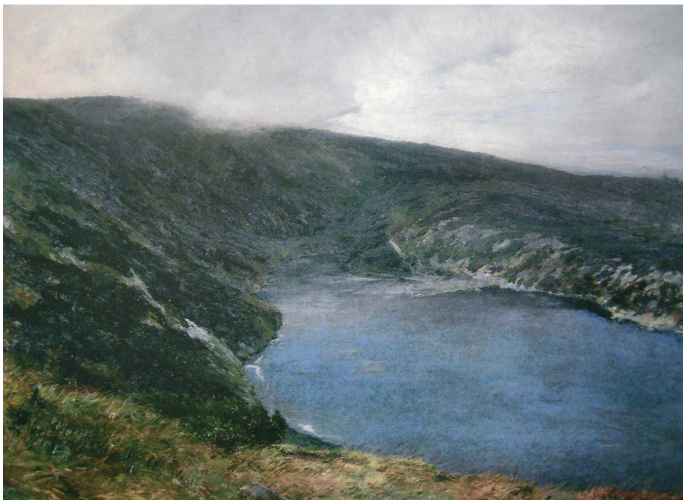
Velké jezero v Krkonoších, 1896

Podívejte se společně na všechny kresby. Mají obrázky něco společného nebo si každý představil mlhu jinak a viděl nakonec v krajině jiné obrysy. Co se stalo s barevností krajiny? Jak byste se v takovéto krajině cítili?