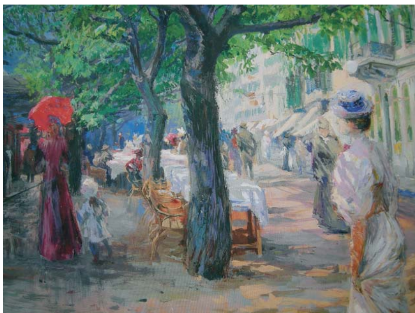
Z Karlových Varů, 1898

Podívejte se na obraz Z Karlových Varů (1898). Najdete tam shodné prvky s vaším obrazem? V čem by se dal váš popis obrazu použít i zde a kde se naopak s Lebedou výrazně rozcházíte? Je to námět, kompozice, barvy, nálada?