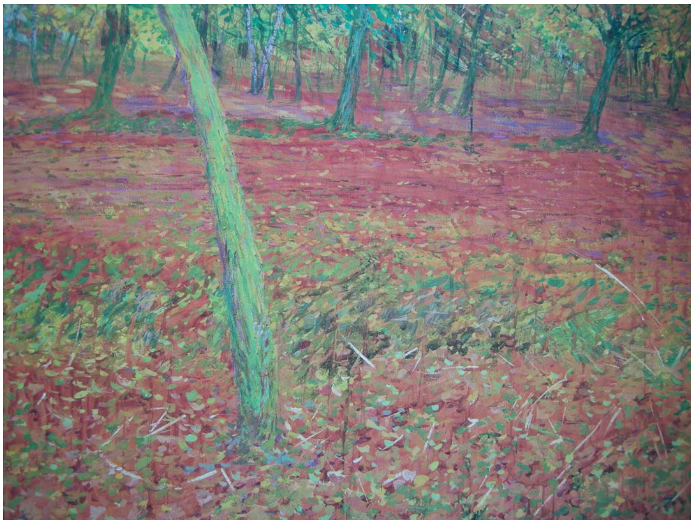
Podzim , 1898

Mohl by být tento obraz odrazem nějaké vaší životní situace? Co se s vámi dělo? Co přesně to v obraze odráží? Jsou to zvolené barvy, rukopis nebo kompozice stromů?