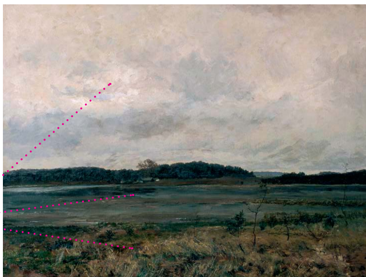
Na vypuštěném Flughause, 1895, olej, plátno, 90 x 119 cm

důraz na strukturu materiálů pomocí rukopisu (suché rákosí, bahno, nebe)