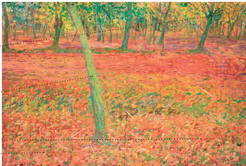
Podzim 1898, syntonos, lepenka, 71,5 x 106 cm