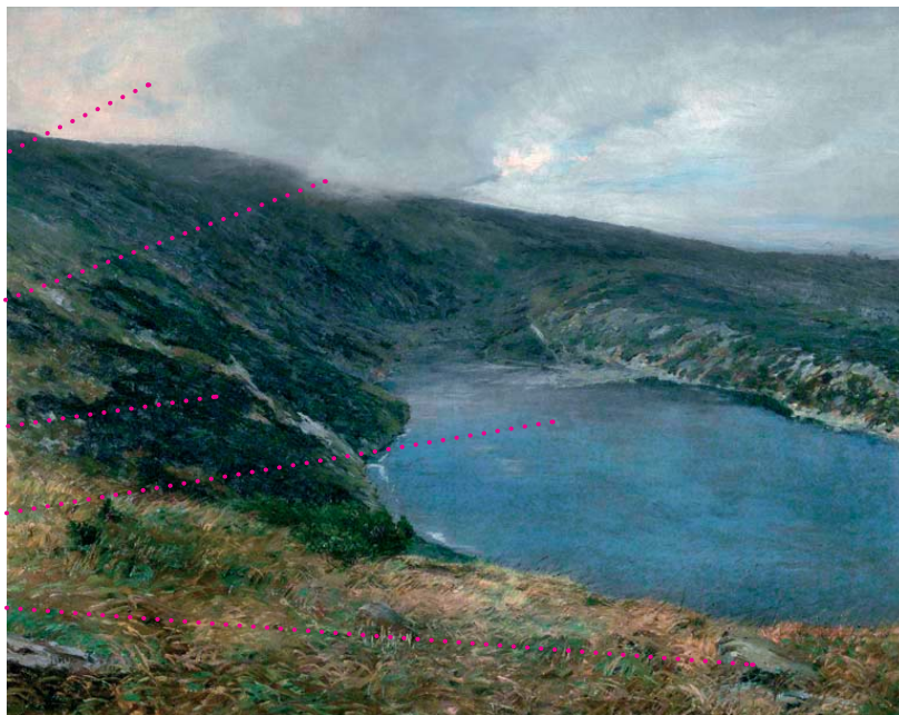
Velké jezero v Krkonoších, 1896, olej, plátno, 78 x 98 cm