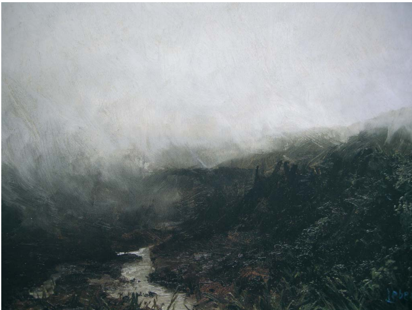
Z Krkonoš I, 1896

Slova si navzájem přečtěte. Napadají vás ještě další? Povídejte... Zkuste si na obraze Z Krkonoš I (1896) dokreslit tužkou, kudy asi může vést horizont.