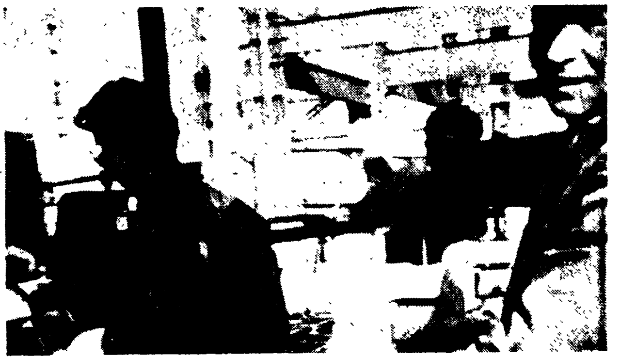
Operai addetti al montaggio della supercentrale di Porto Vesme

Inconfessati interessi ritardano l'applicazione della legge. Presa di posizione unitaria delle Commissioni Interne. Positive dichiarazioni ai lavoratori del direttore generale Carta - Interrogazione comunista al Consiglio regionale