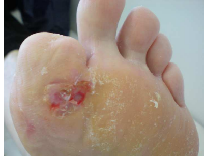
90. den po aplikaci MDM terapie