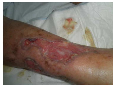
90.den po aplikaci MDM terapie